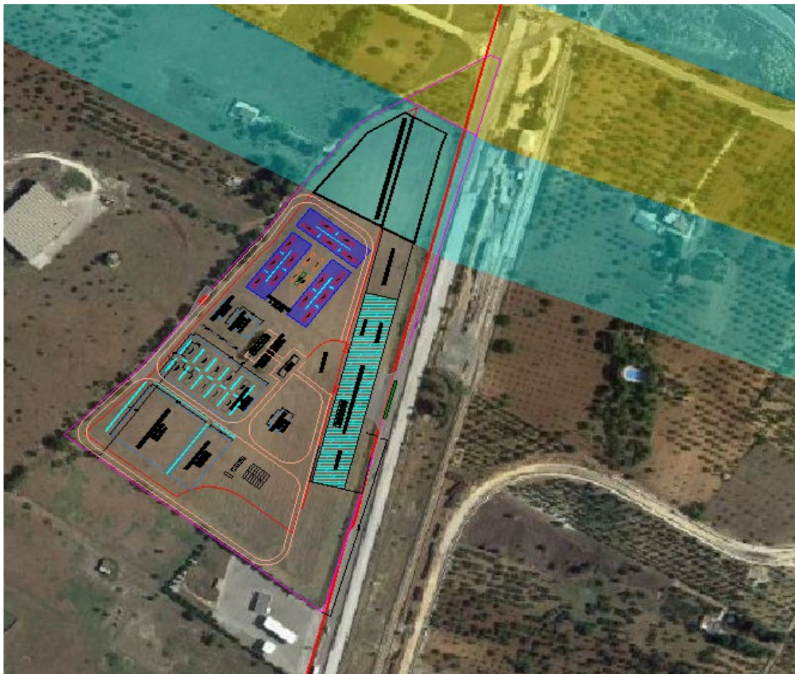
Figura 1 - Inquadramento sito idrogeno

Negli stessi lotti è prevista una stazione di servizio con sistema di ricarica elettrica e rifornimento di idrogeno per l'autotrazione, un punto ristoro e un parco verde attrezzato con percorso botanico.