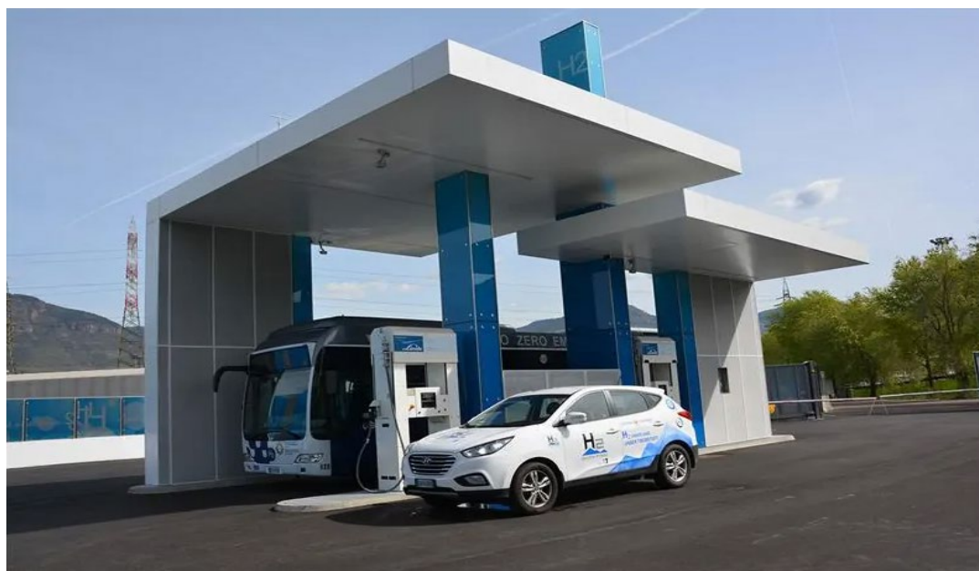
Figura 4 – Stazione di rifornimento