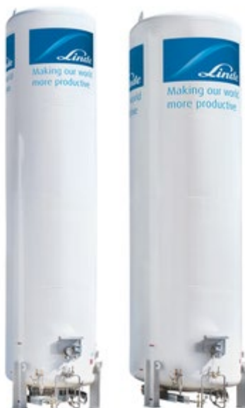
Figura 3 – Cryogenic tanks

252,8 ° C). Occorre qui fare attenzione, perché l'idrogeno liquido ha una densità di energia maggiore dell'idrogeno gassoso, in questi casi portarlo alle temperature richieste può essere molto costoso. Inoltre, i serbatoi di stoccaggio e le strutture per lo stoccaggio dell'idrogeno liquido criogenico devono essere isolati per impedire l'evaporazione nel caso in cui il calore venga trasportato nell'idrogeno liquido a causa di conduzione, convezione o radiazione.