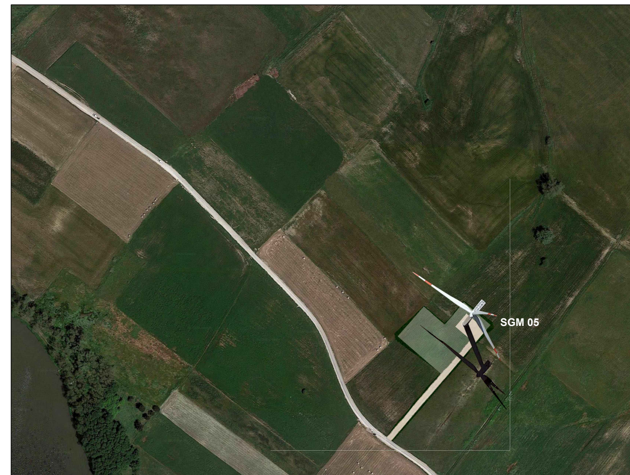
STATO DI FATTO - LAYOUT IMPIANTO ESISTENTE DA DISMETTERE