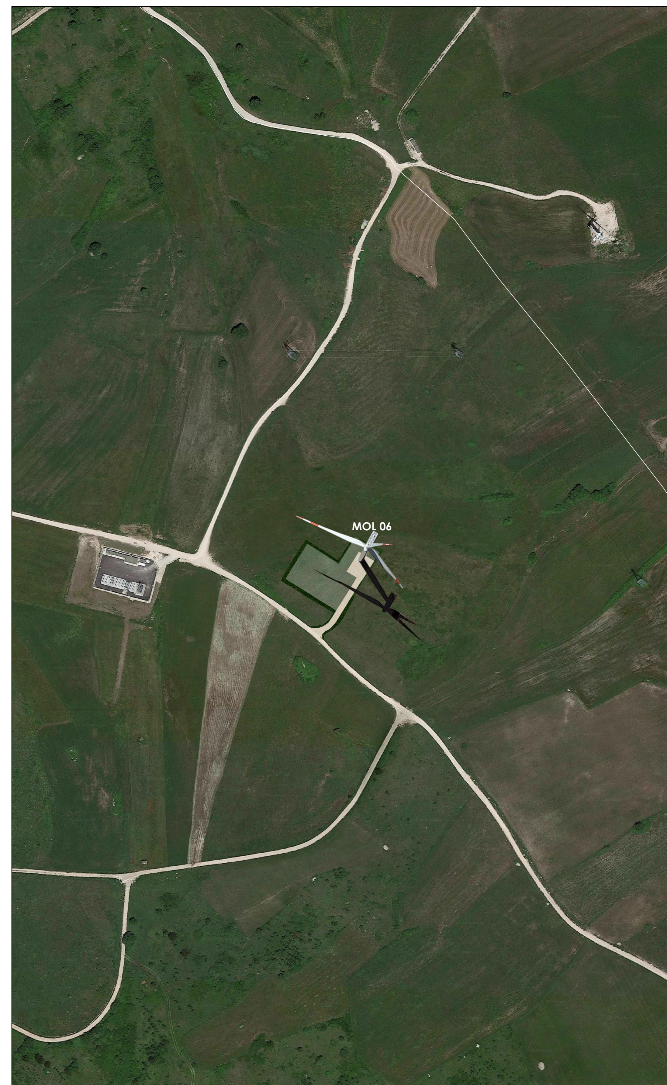
STATO DI FATTO - LAYOUT IMPIANTO ESISTENTE DA DISMETTERE