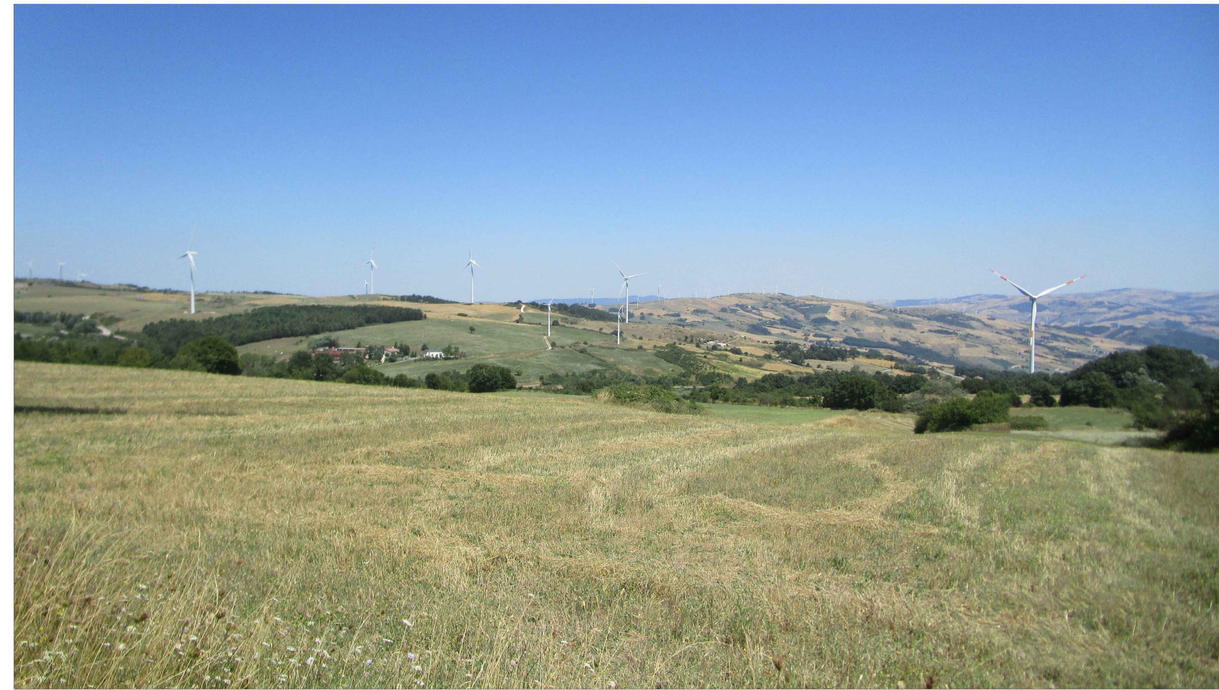
SCATTO FOTOGRAFICO N.5