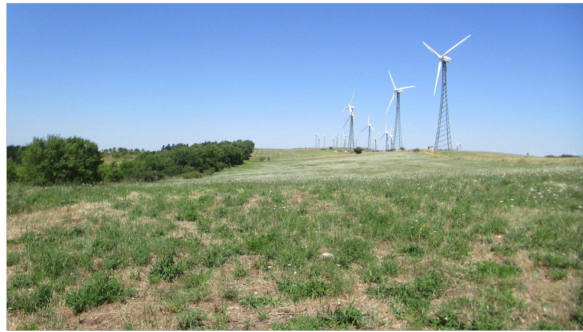
SCATTO FOTOGRAFICO N.3