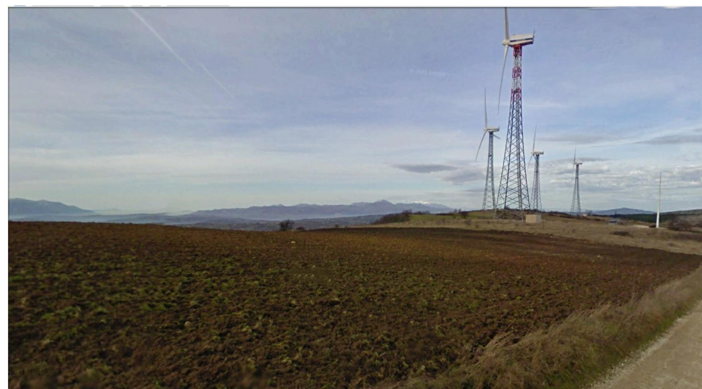
SCATTO FOTOGRAFICO N.9