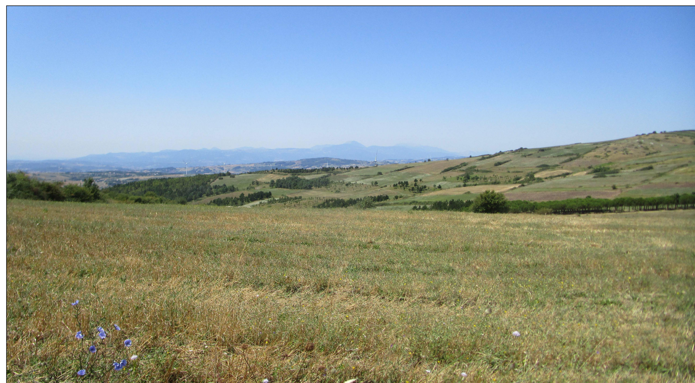
SCATTO FOTOGRAFICO N.2