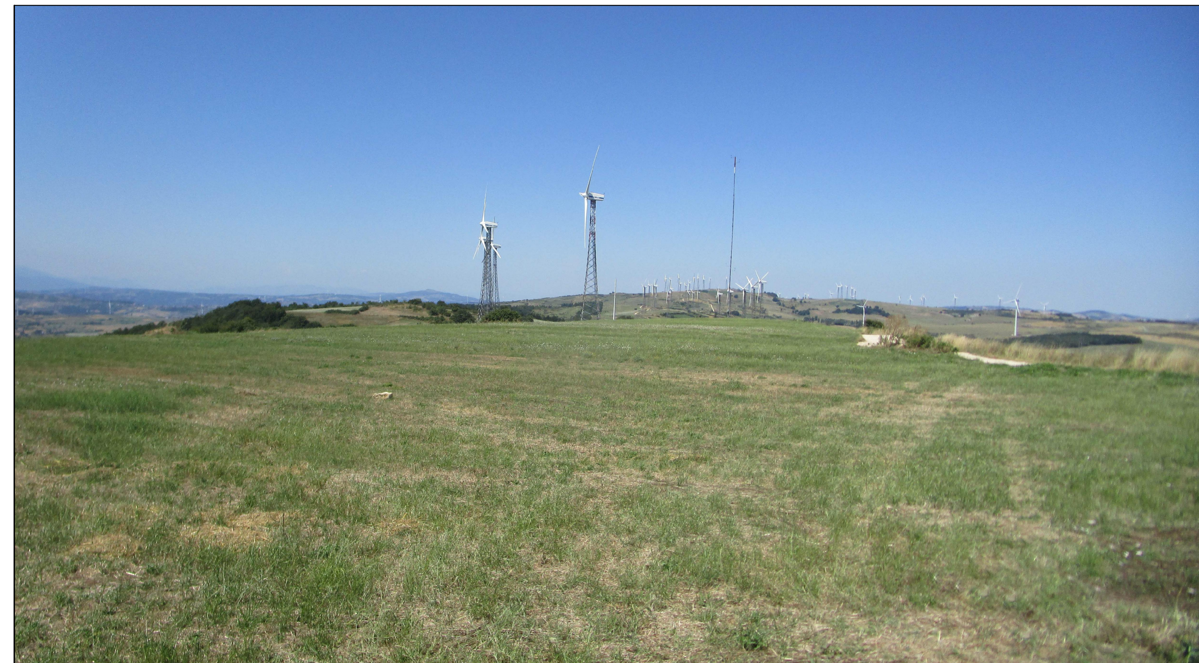
SCATTO FOTOGRAFICO N.7