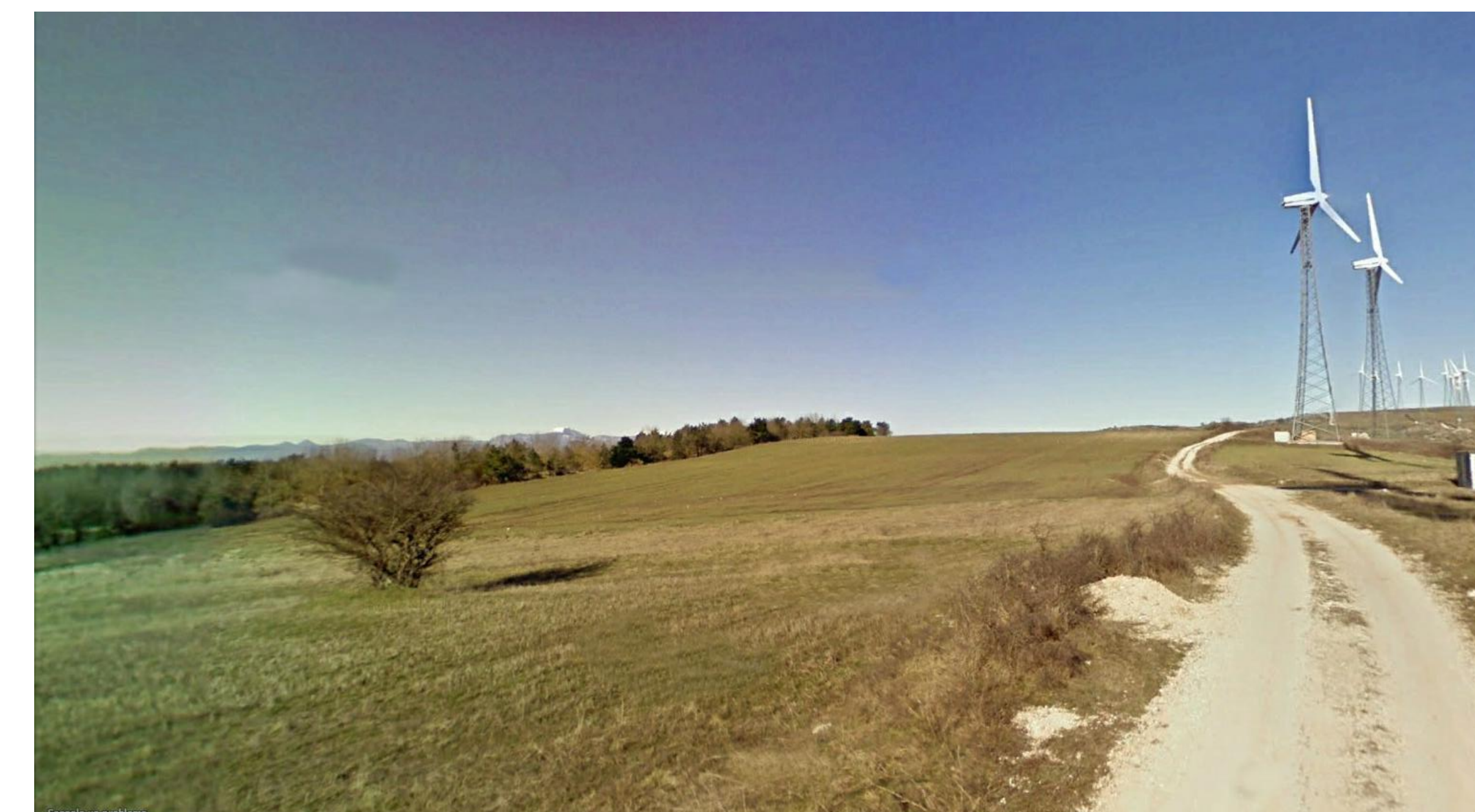
SCATTO FOTOGRAFICO N.10