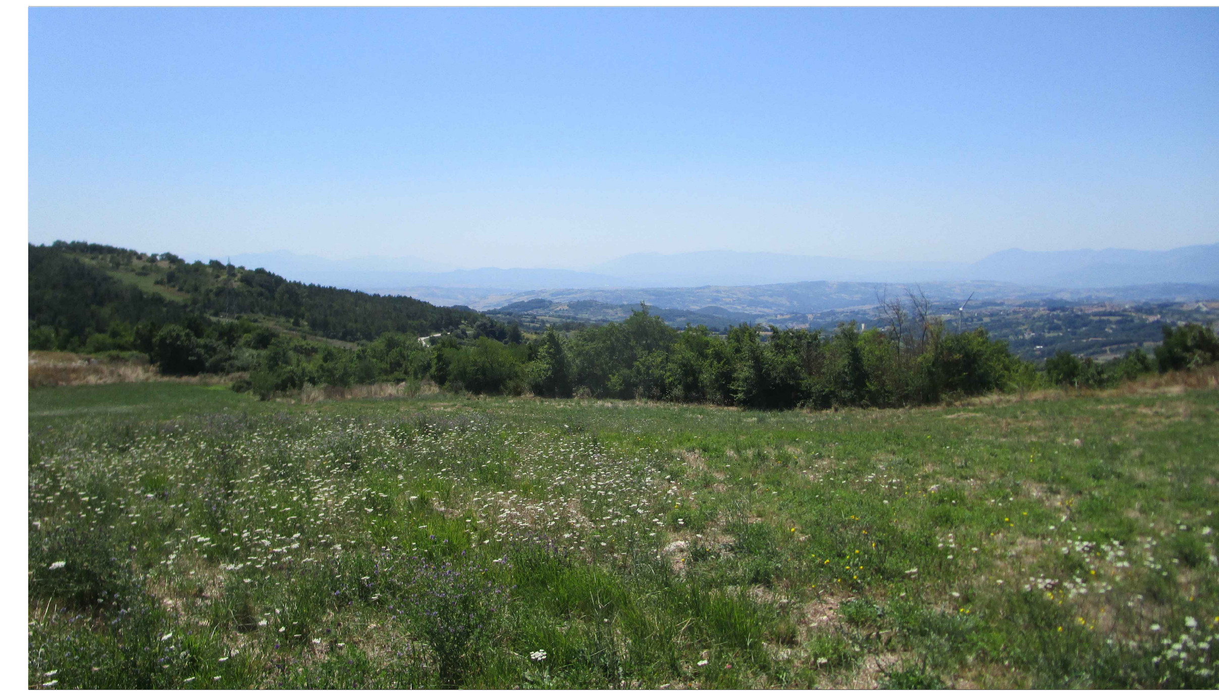
SCATTO FOTOGRAFICO N.4