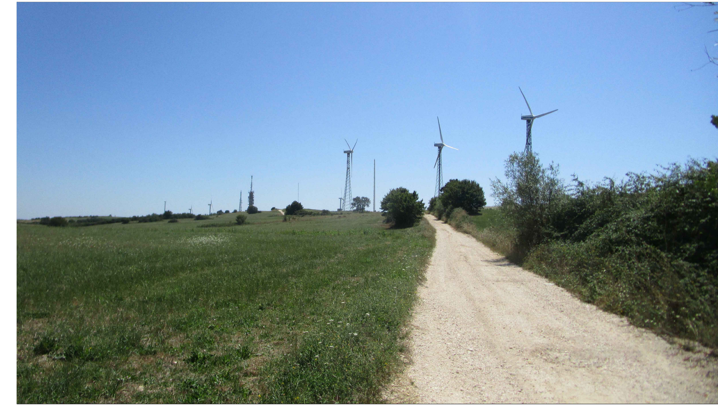
SCATTO FOTOGRAFICO N.6