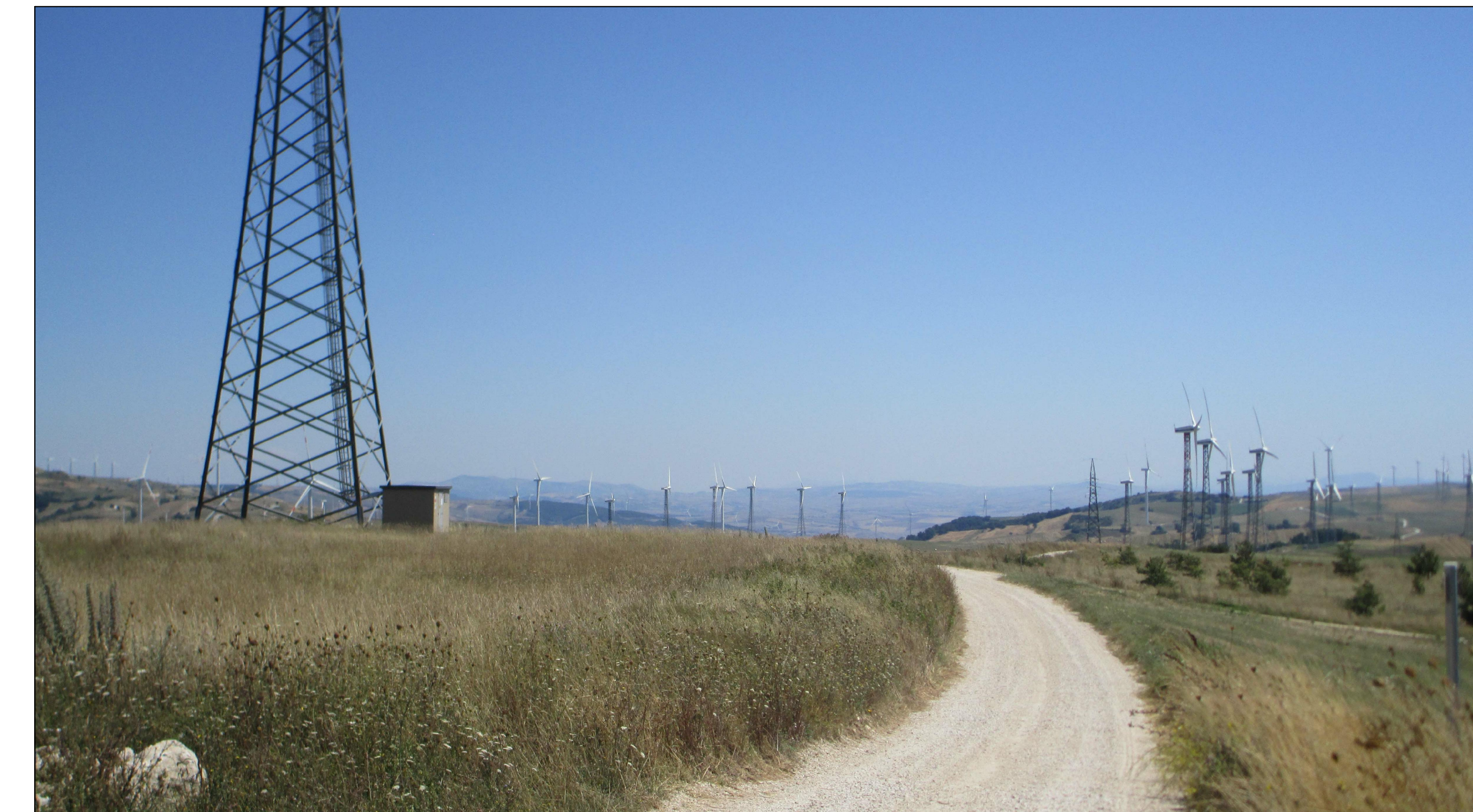
SCATTO FOTOGRAFICO N.8