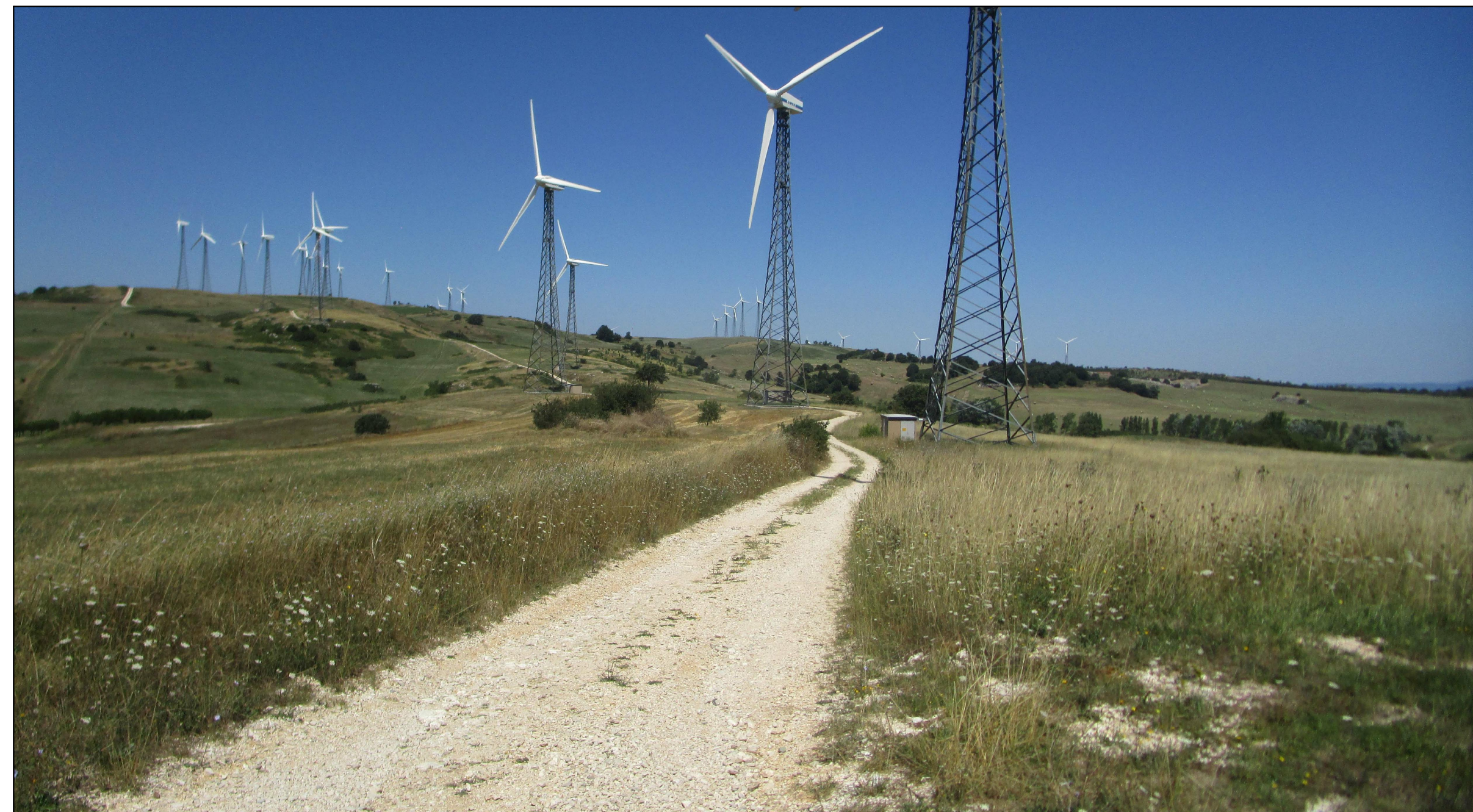
SCATTO FOTOGRAFICO N.1