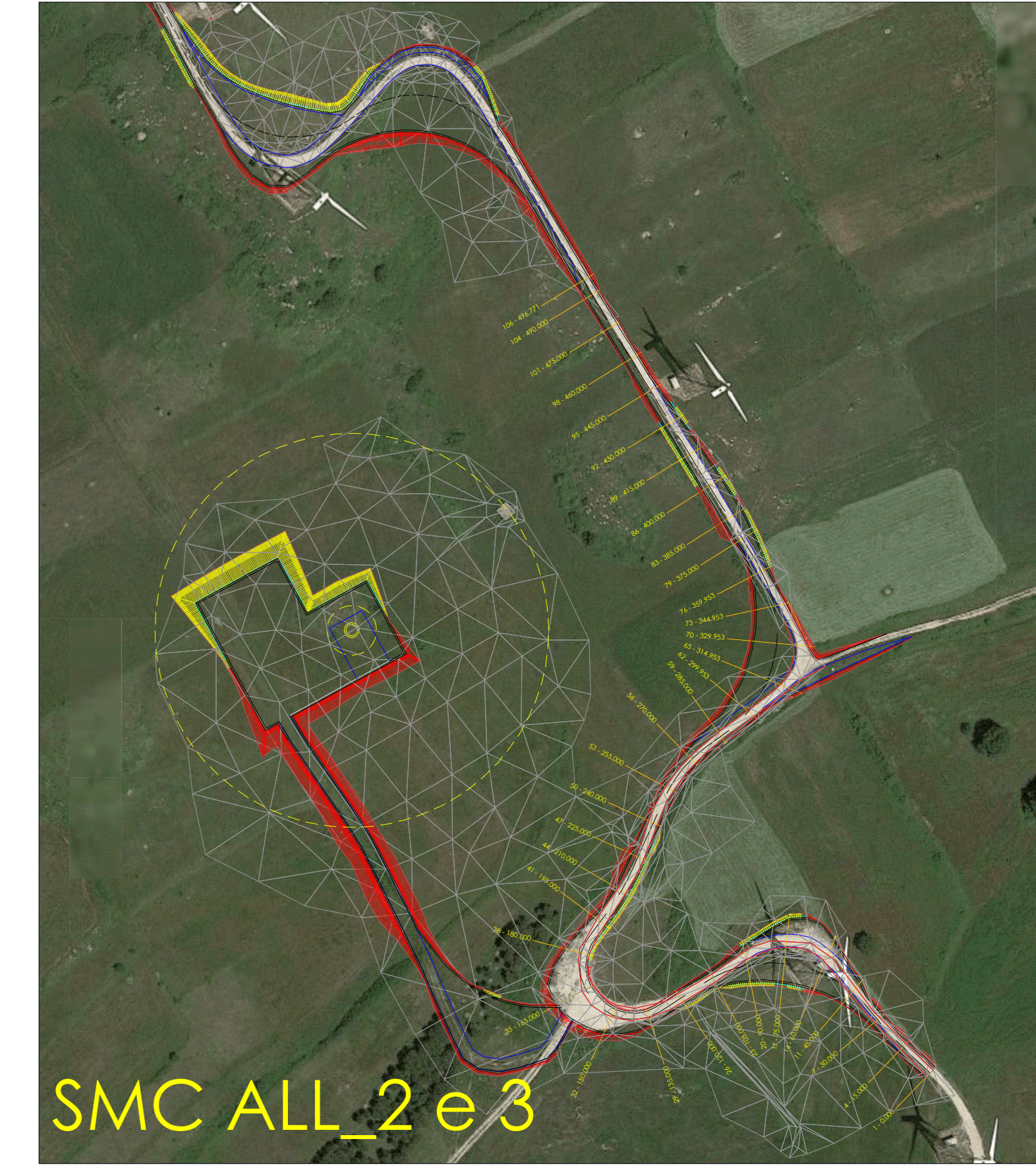
SMC ALL_2 e 3