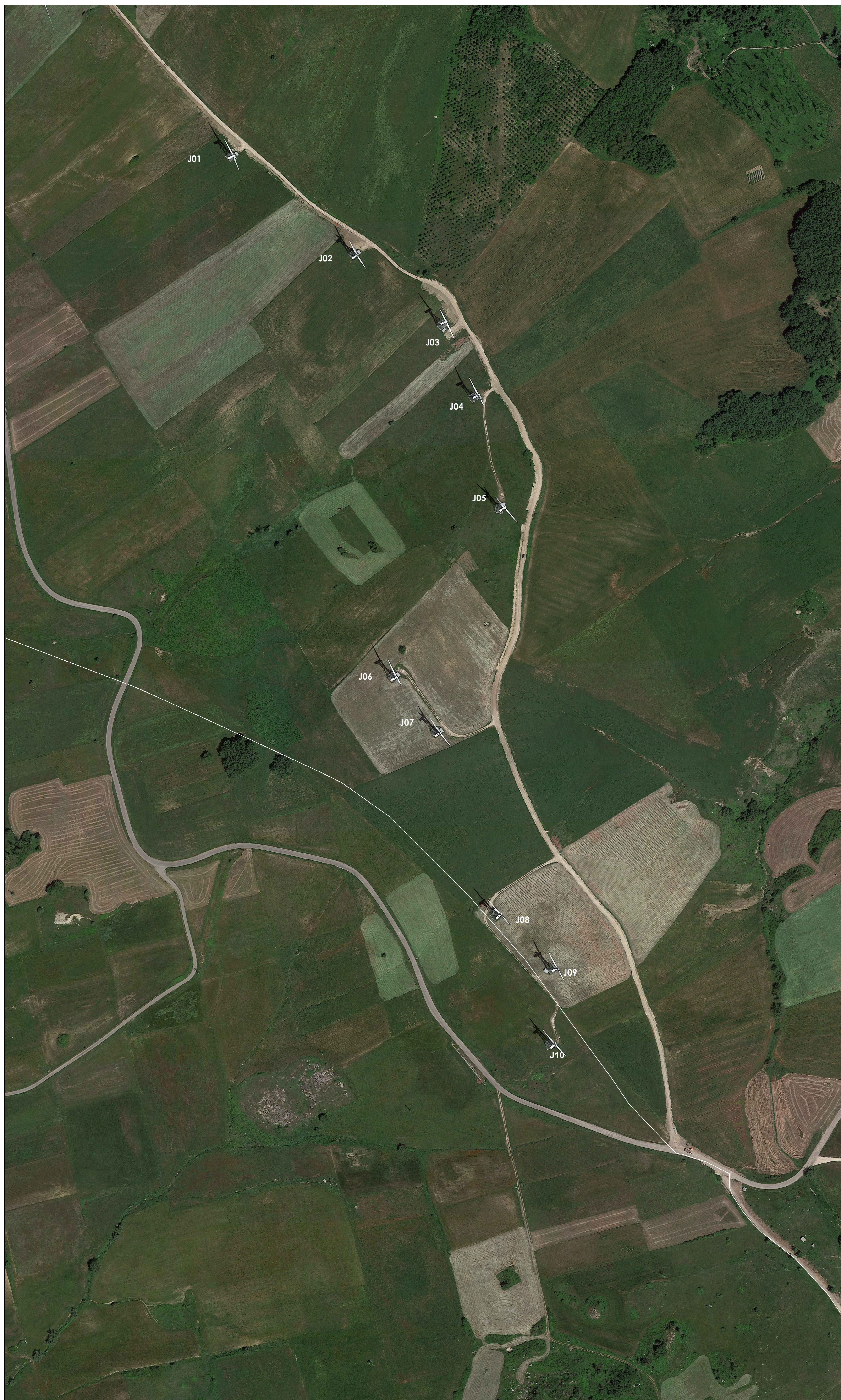
STATO DI FATTO - LAYOUT IMPIANTO ESISTENTE DA DISMETTERE