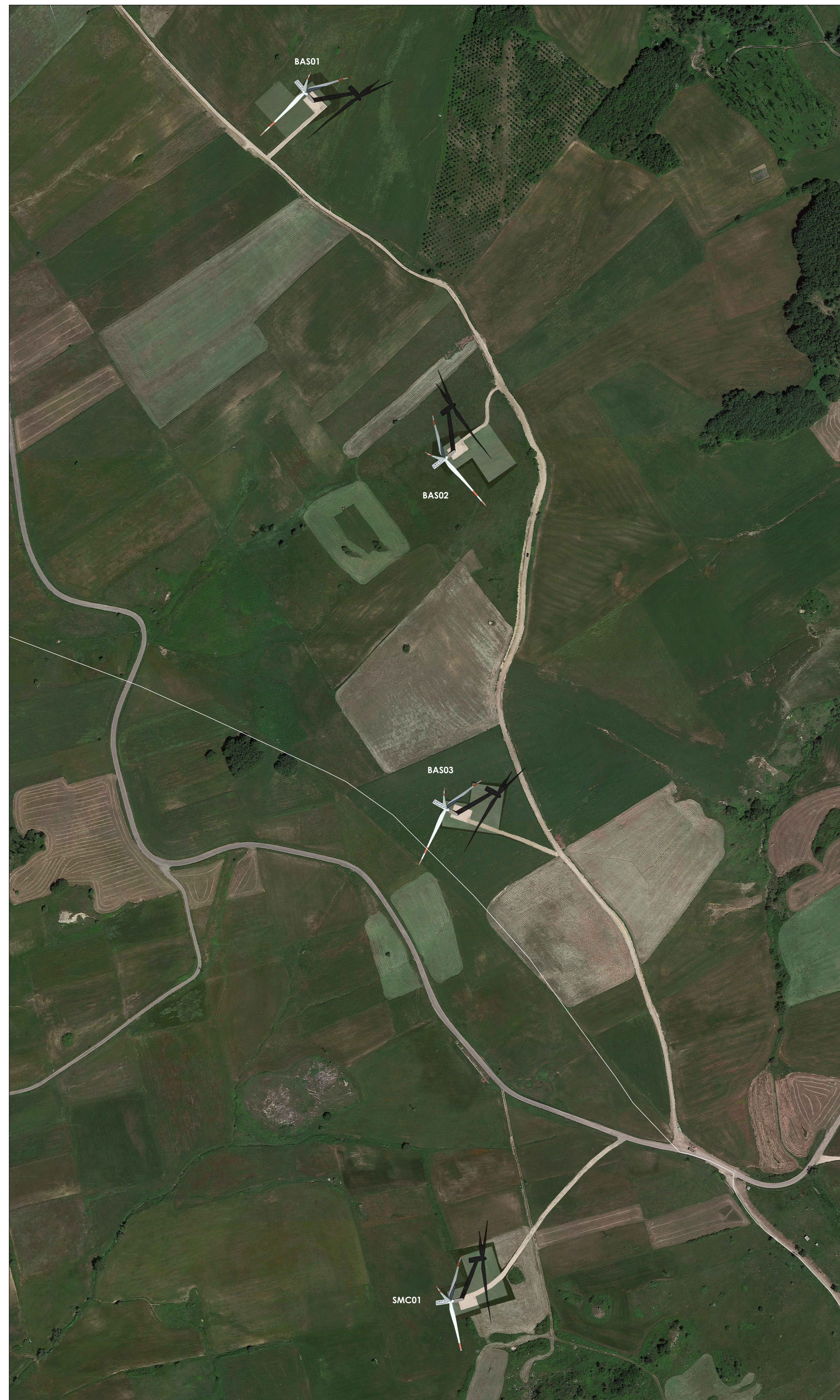
STATO DI PROGETTO - SIMULAZIONE D'INSERIMENTO LAYOUT DI PROGETTO