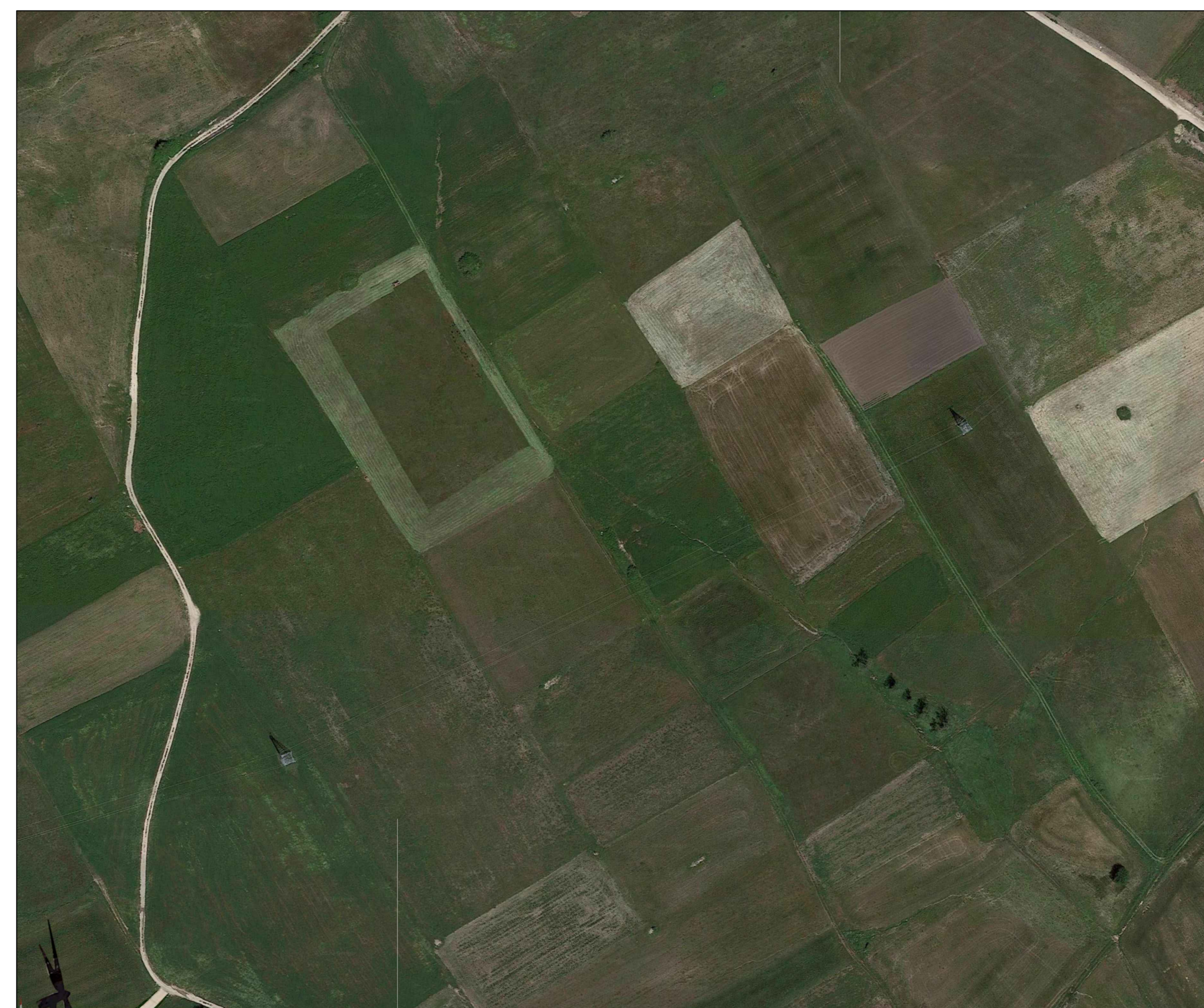
Post Operam - Simulazione di ripristino delle aree interessate ad una condizione ante operam, ovvero restituite agli usi naturali, prevalentemente agricoli.