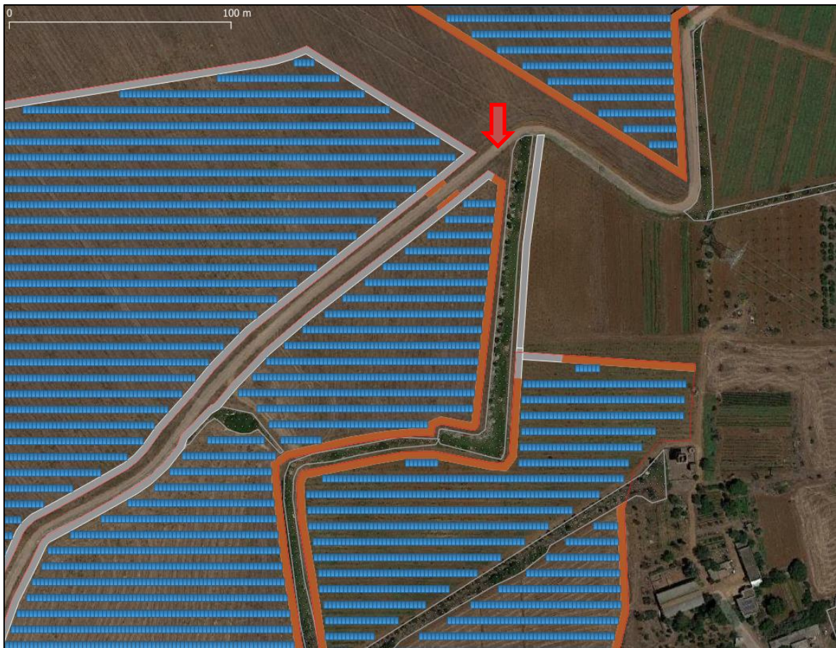
Stralcio di planimetria di impianto con indicazione dei muretti a secco e delle recinzioni ed evidenza del punto di ripresa della fotografia in calce

Anche laddove i muretti non sono più leggibili infatti, si è evitato di interessare l'area dei muretti a secco con le opere di impianto. Di seguito si riporta un esempio fotografico di questo criterio, che è stato rispettato in tutto l'impianto.