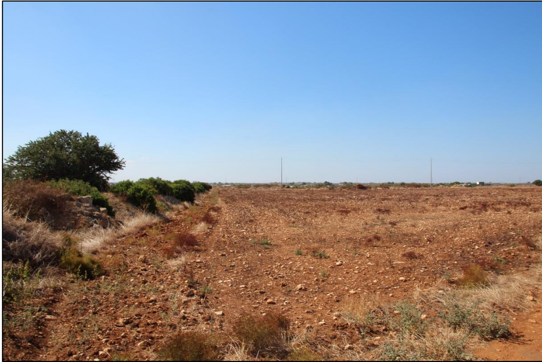
Muretto a secco ormai divelto con vegetazione spontanea in area di impianto