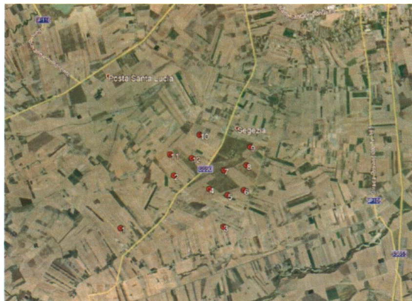
Fig. 1: Inquadramento territoriale degli aerogeneratori

rotore fino a 170 metri, altezza torre fino a 115 metri ed un'altezza totale di 200 metri, di potenza unitaria pari a 6,6 MW, per una potenza totale d'impianto pari a 79,2 MW, con relative opere di connessione alla rete. La connessione alla RTN sarà assicurata dalla Stazione Elettrica sita nel comune di Troia (FG).