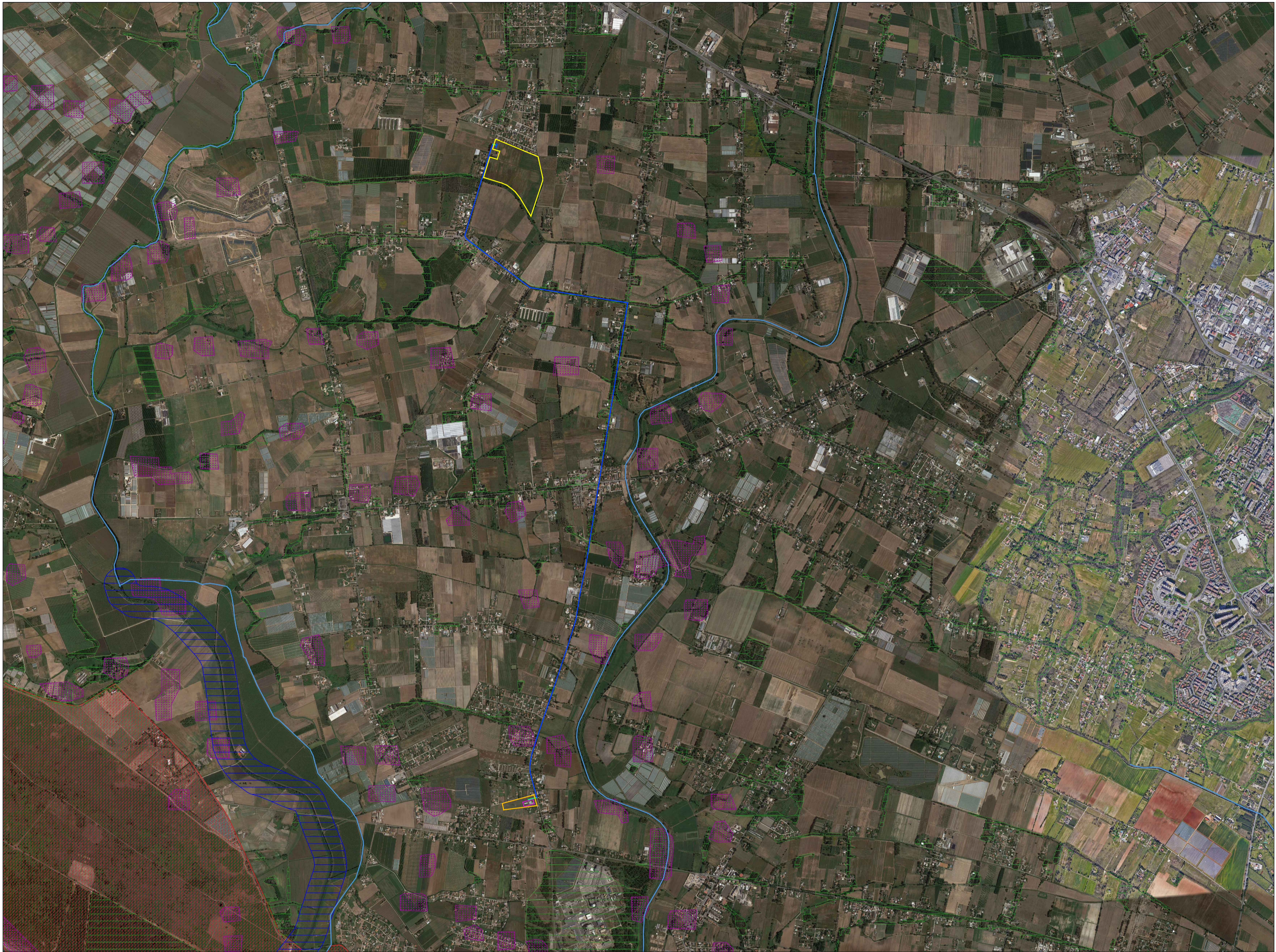
INQUADRAMENTO ELETTRODOTTO DI VETTORIAMENTO IN M.T. SU CARTOGRAFIA PPTR