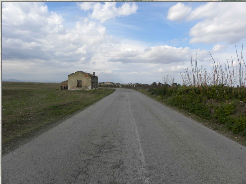
10. Vista da strada SP 18 Ofantina (6,0 Km dalla nuova stazione SE)