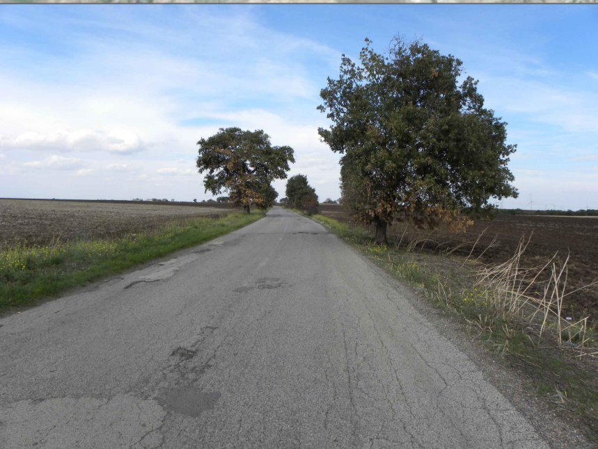
12. Vista da strada SP 18 Ofantina (4,2 Km dalla nuova stazione SE)