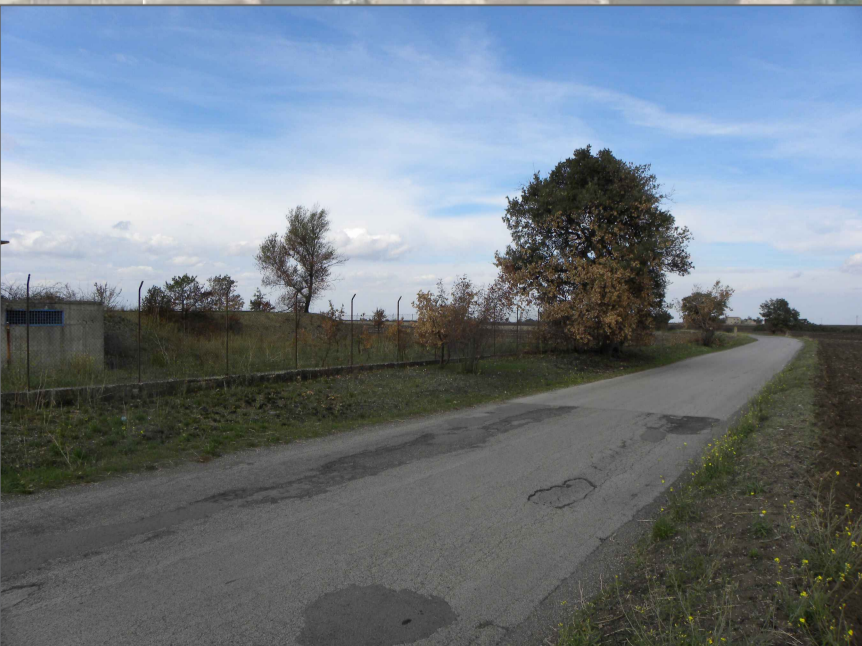
11. Vista dal limite dei 500m dal Vallone Fara-Valle dei Briganti