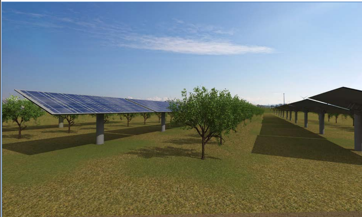
Vista 4_Post Operam