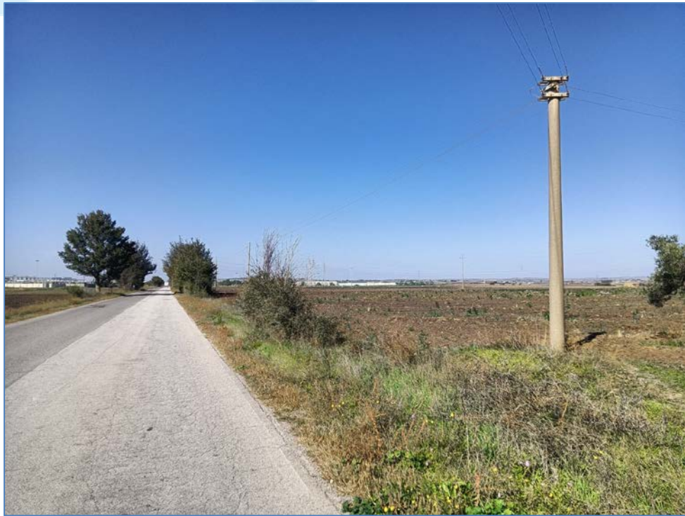
Vista 6_Ante Operam