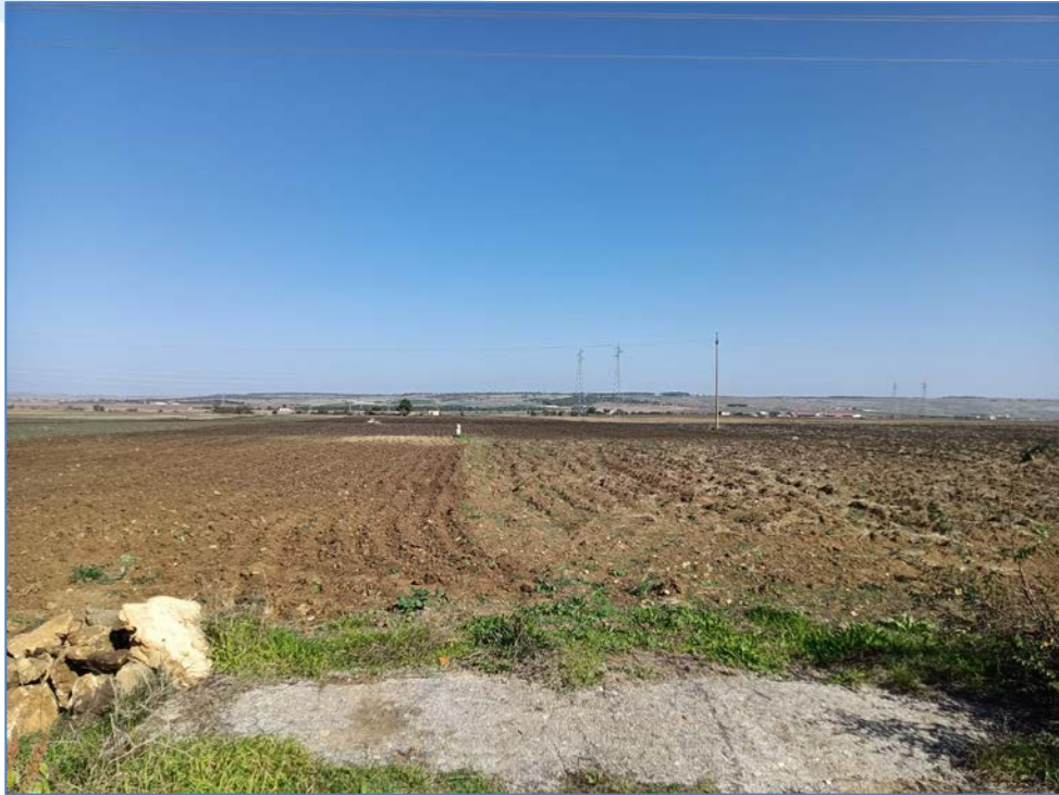
Vista 5_Ante Operam