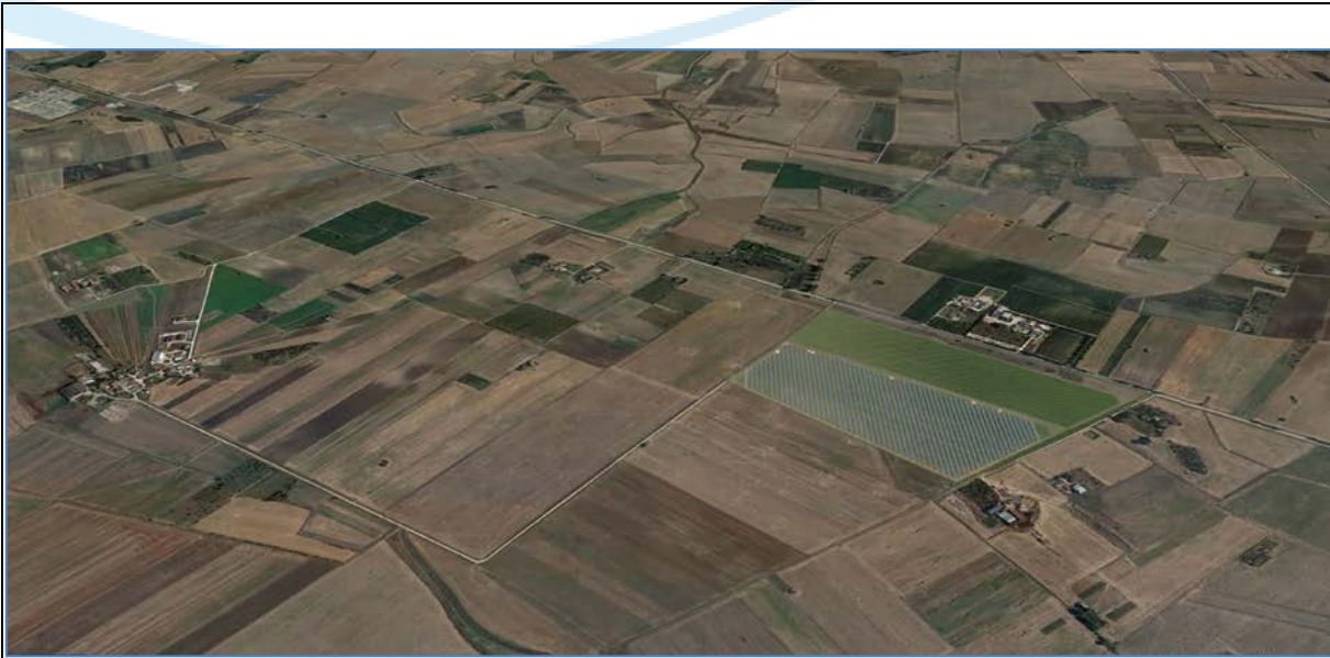
Vista Nord_Post Operam