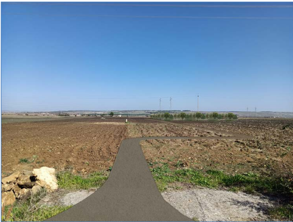
Vista 5_Post Operam