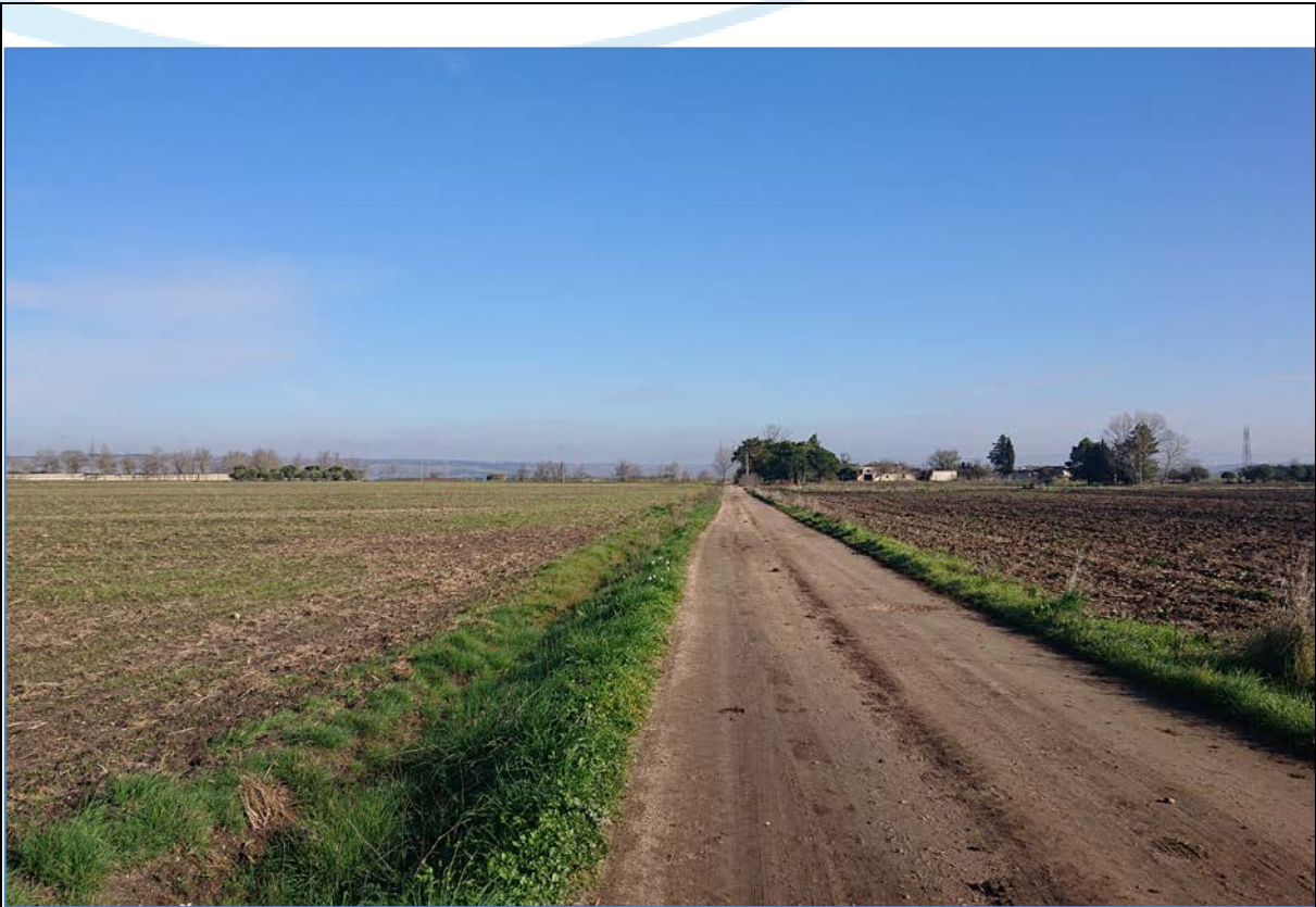
Vista 3_Ante Operam