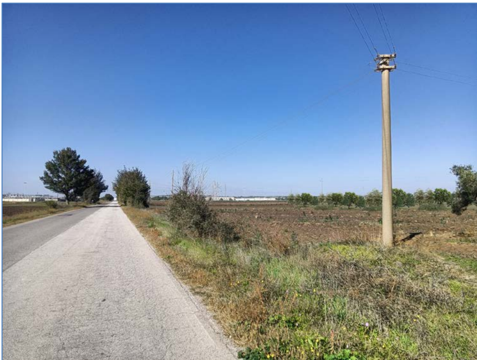
Vista 6_Post Operam