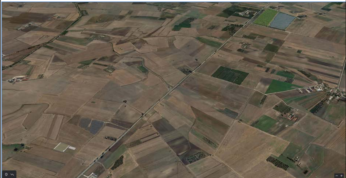
Vista Ovest_Post Operam