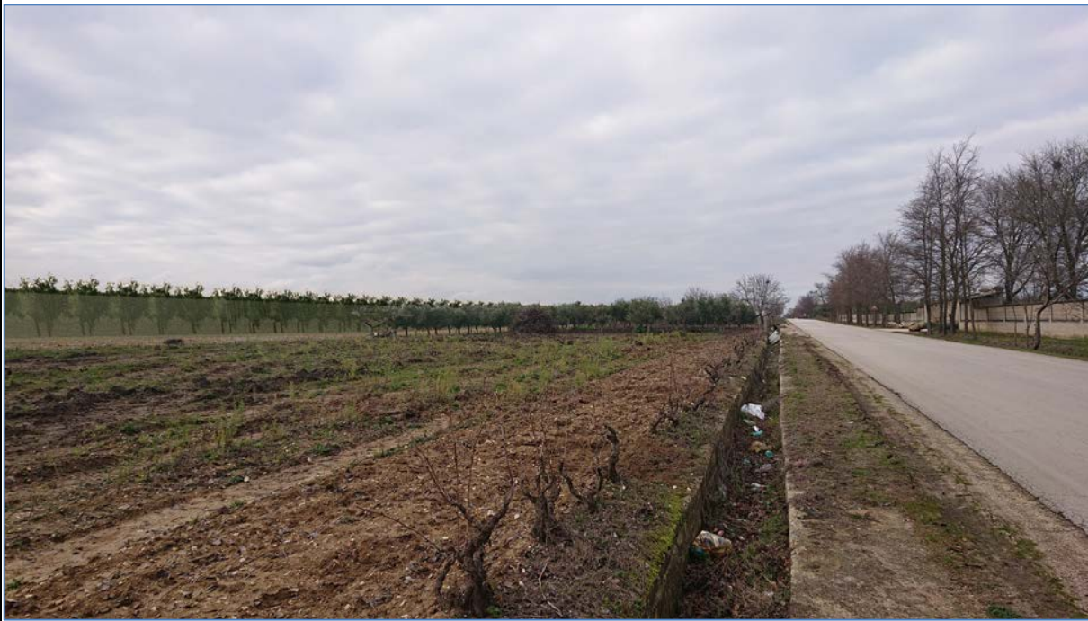
Vista 1_Post Operam