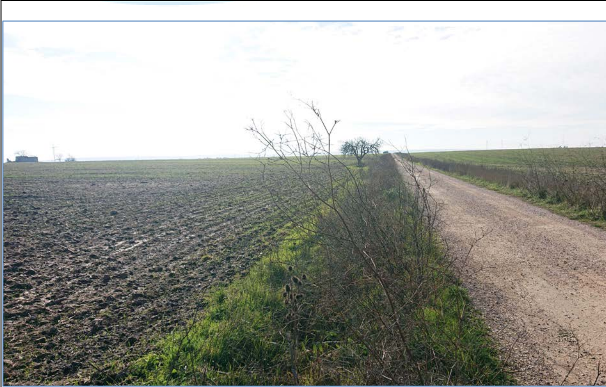
Vista 2_Ante Operam