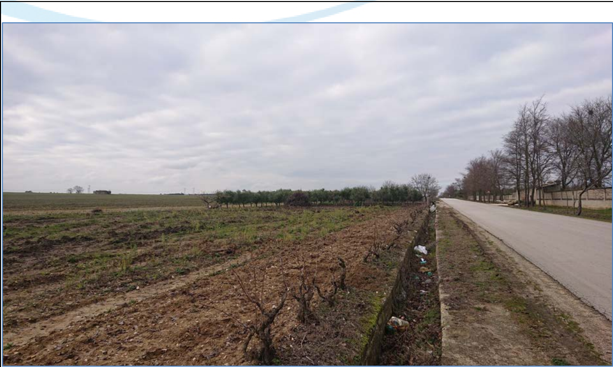
Vista 1_Ante Operam