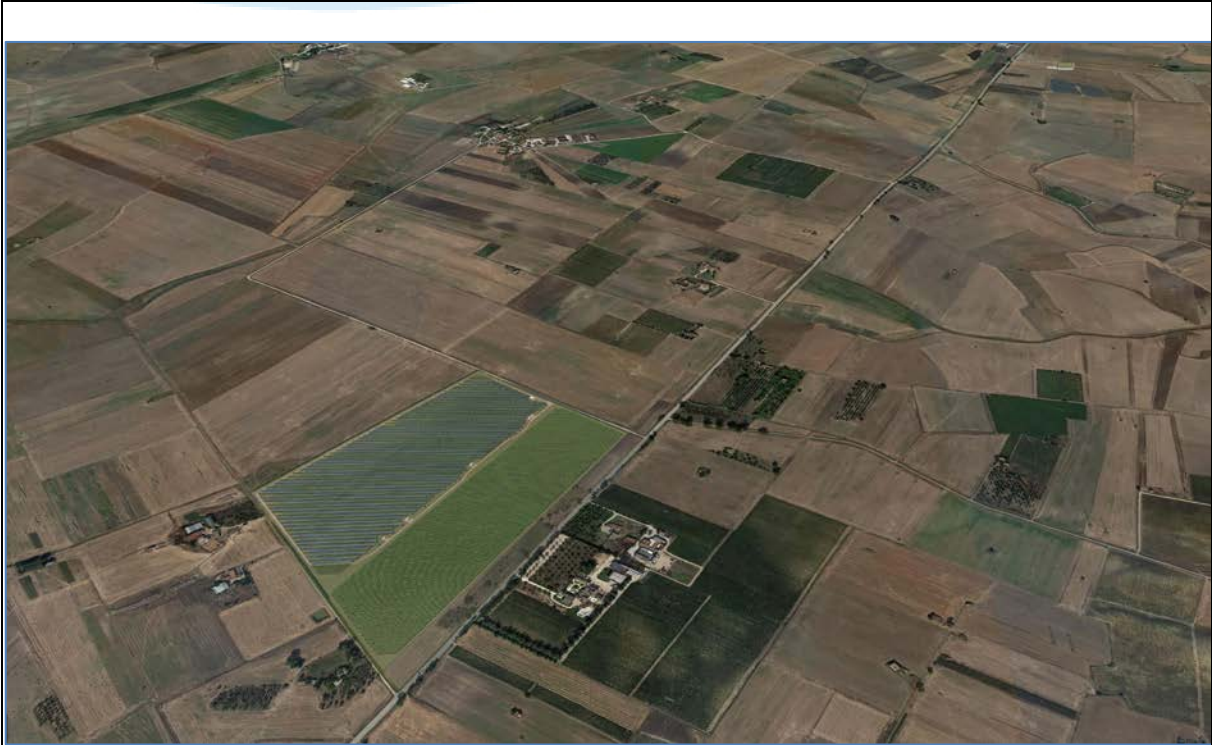
Vista Est_Post Operam