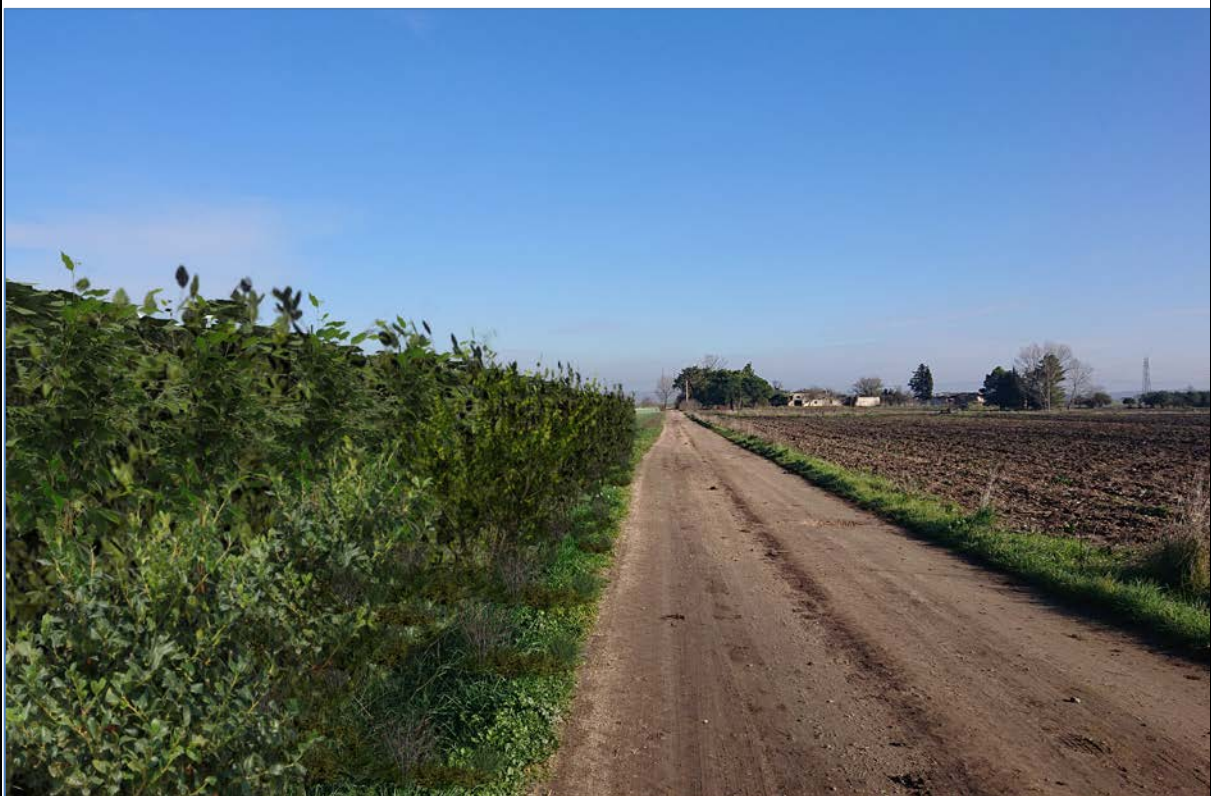
Vista 3_Post Operam