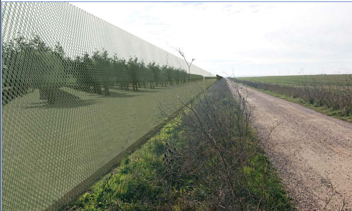
Vista 2_Post Operam