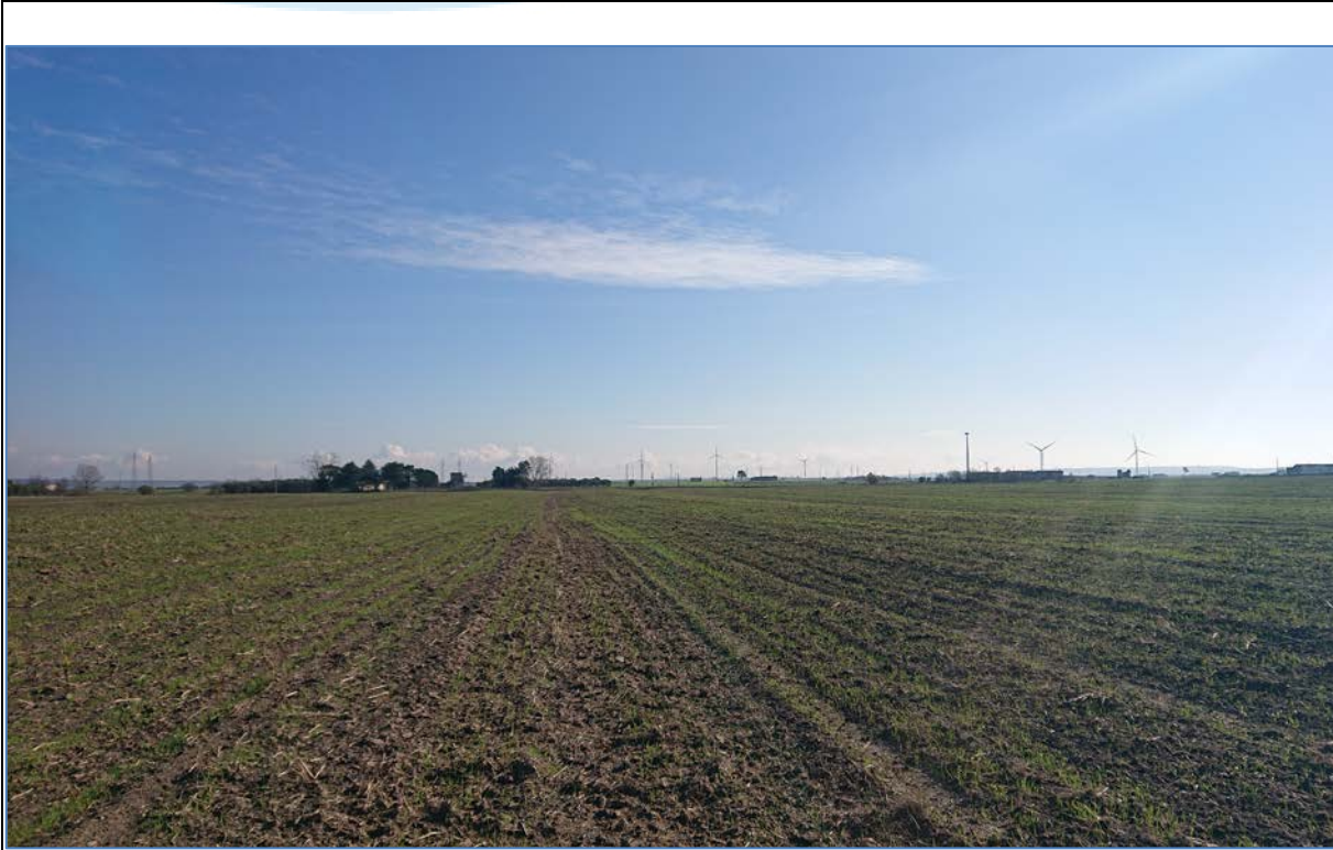
Vista 4_Ante Operam