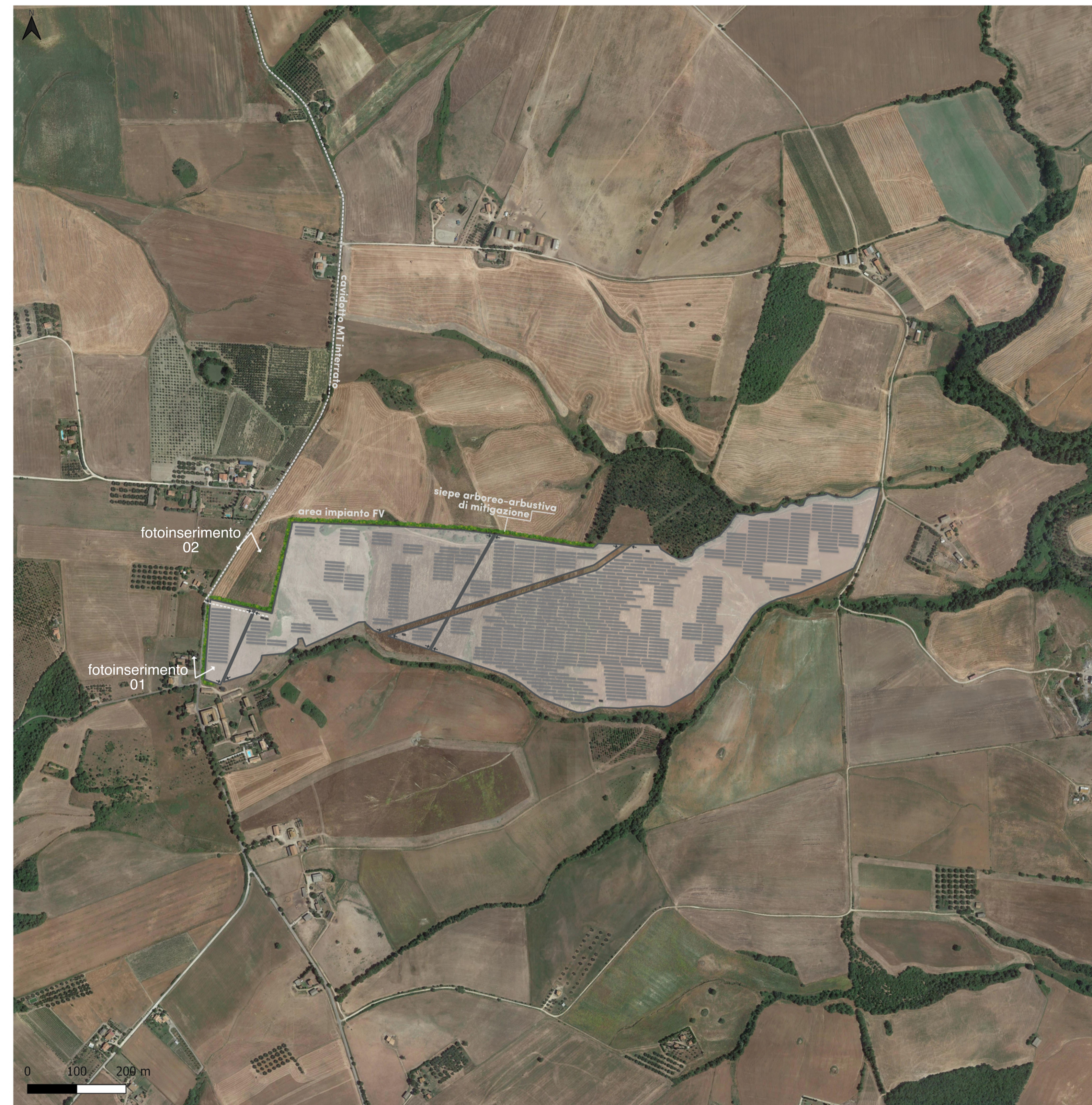
area di impianto, cavidotto, SSEU e opere di rete keymap