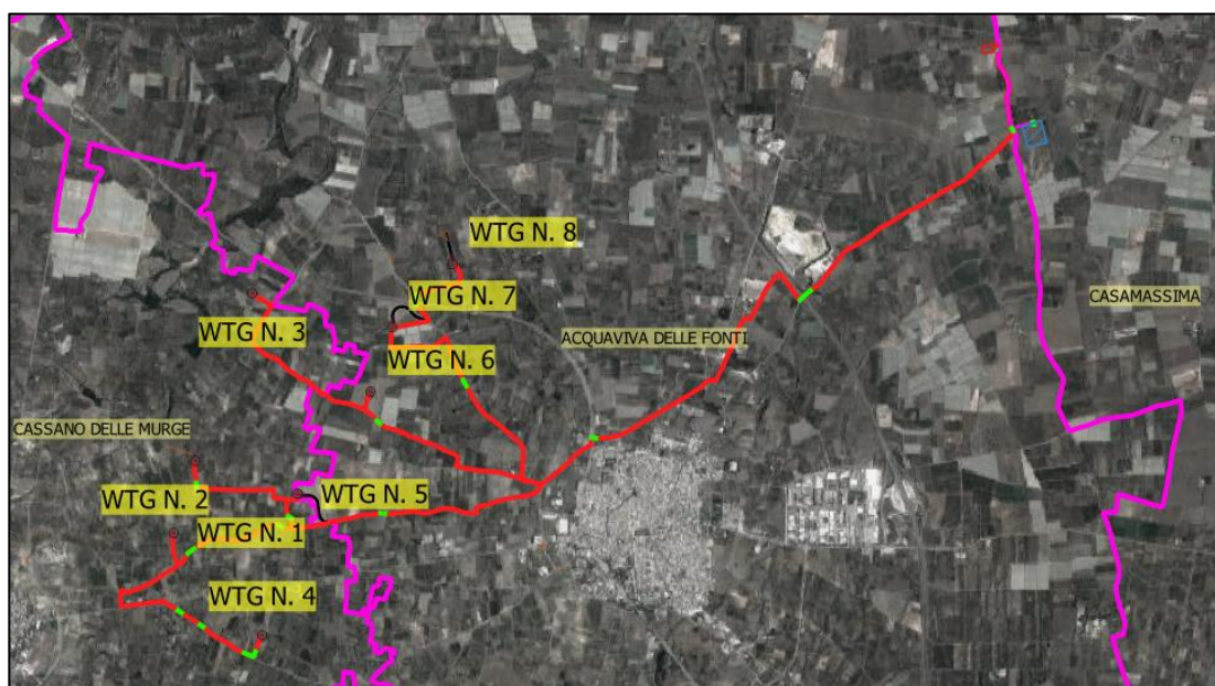
Fig. - Layout impianto su Ortofoto

Di seguito alla stessa il layout d'impianto in scala più ristretta.