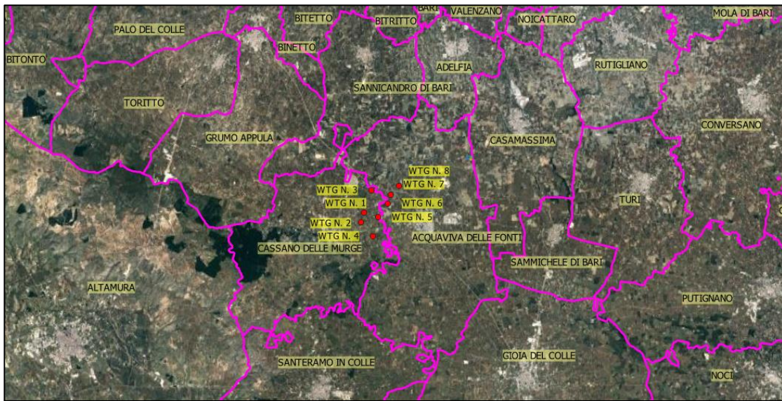
Fig. - Inquadramento Impianto su scala ampia

L'impianto in scala ampia è posizionato come indicato nella seguente ortofoto.