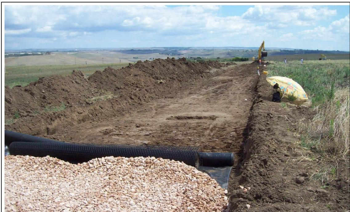
Viabilità brecciata di nuova realizzazione – Fase di scavo superficiale (scotico) si nota il terreno vegetale posizionato a bordo scavo

Anche per la realizzazione delle piazzole, il terreno vegetale rimosso sarà depositato a bordo scavo, in attesa di esser riutilizzato in sito, per il ripristino dopo lo smantellamento della piazzola temporanea