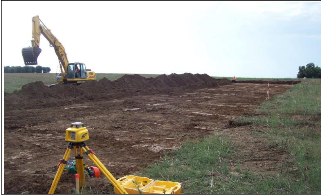
Scavo di sbancamento per la realizzazione di una nuova piazzola - si nota il terreno vegetale posizionato a bordo scavo

Durante la realizzazione dei cavidotti la gestione del terreno vegetale seguirà la stessa logica, con la differenza che in quel caso il rinterro sarà immediato al termine dello scavo.