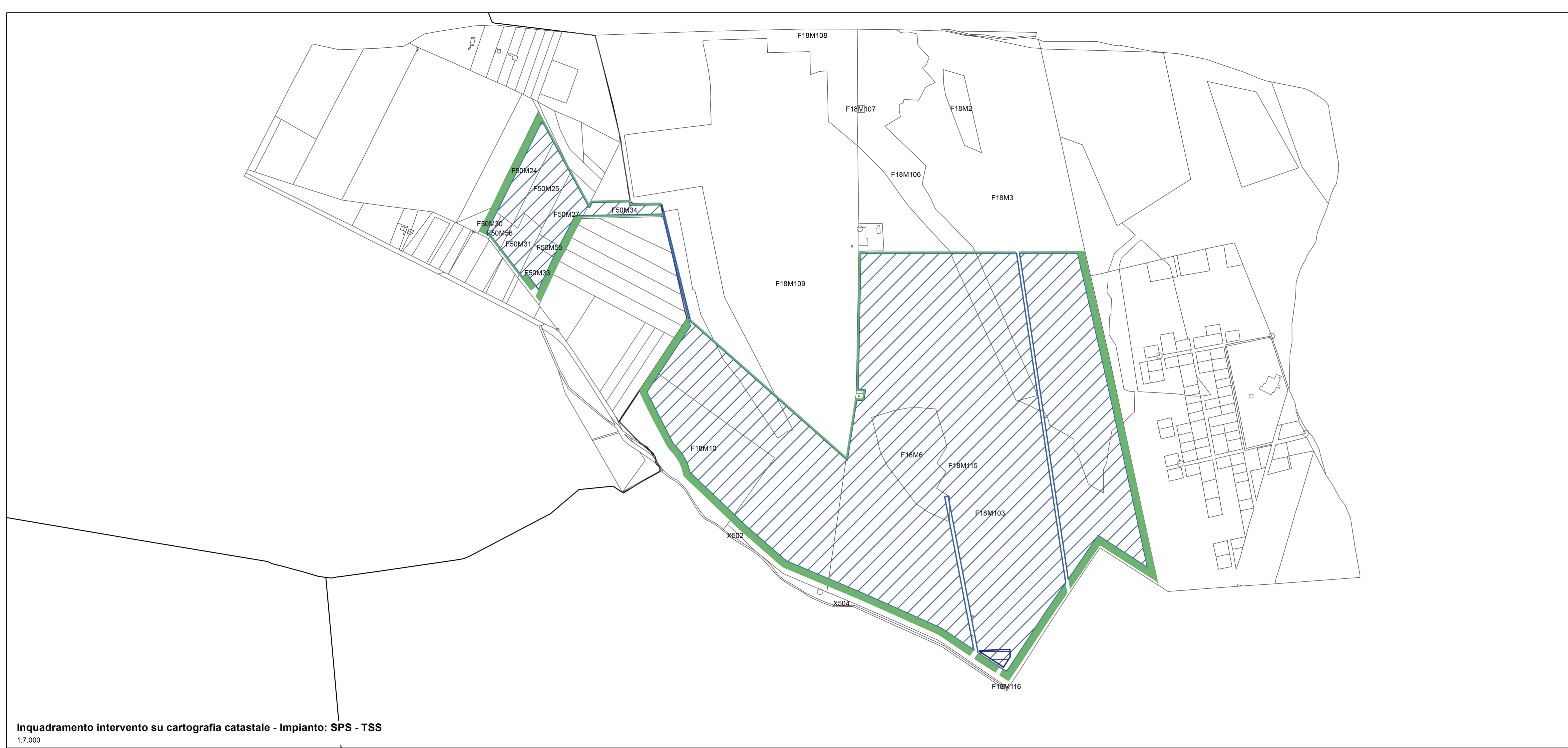
Inquadramento intervento su cartografia catastale - Impianto: SPS - TSS