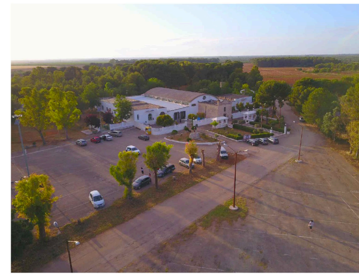
Sito: Santuario di S. Antonio Vista 1