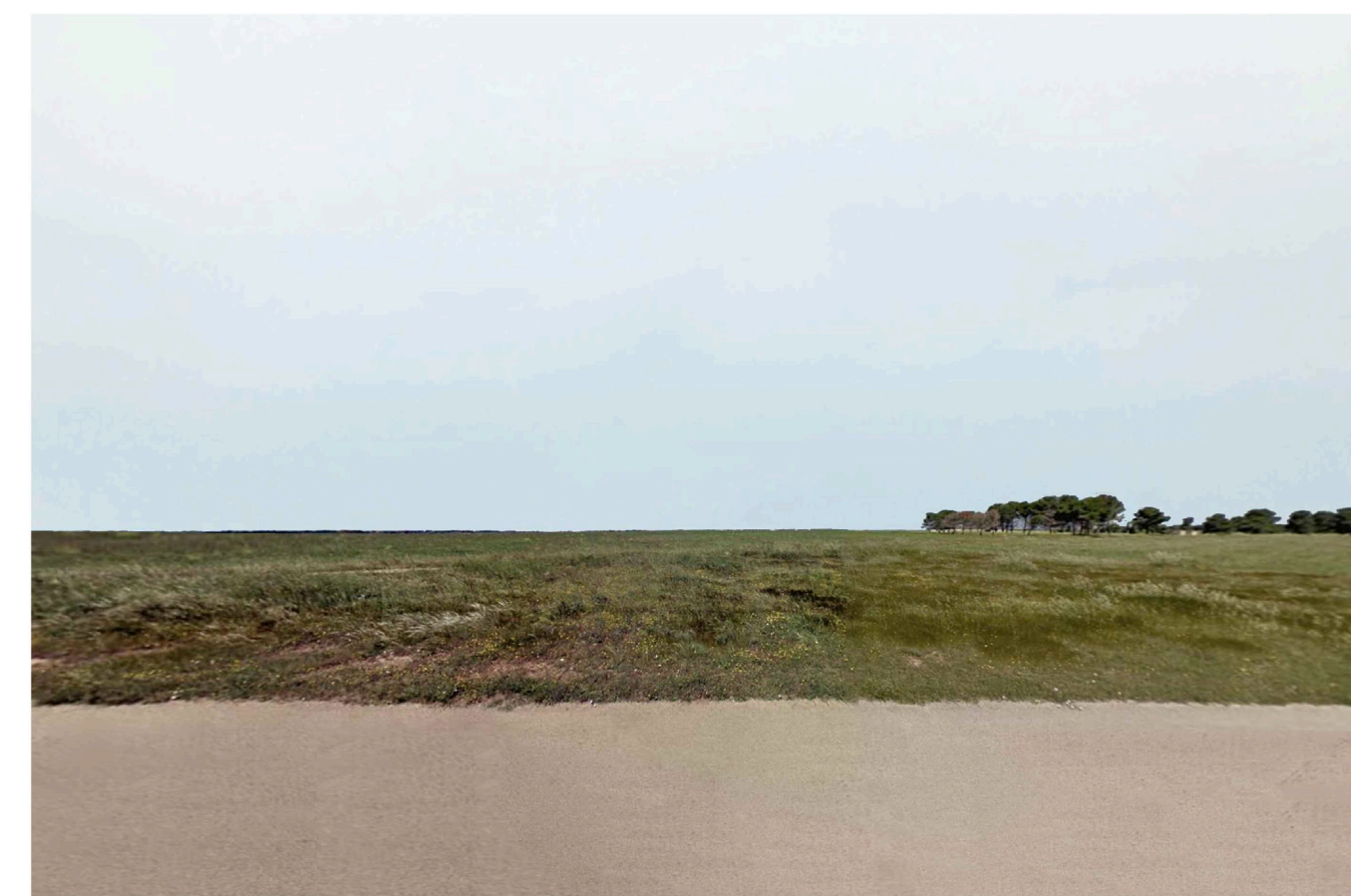
Sito 2: Bosco. Stato di Fatto