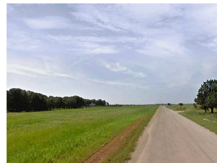
Sito 2: Bosco Vista 3