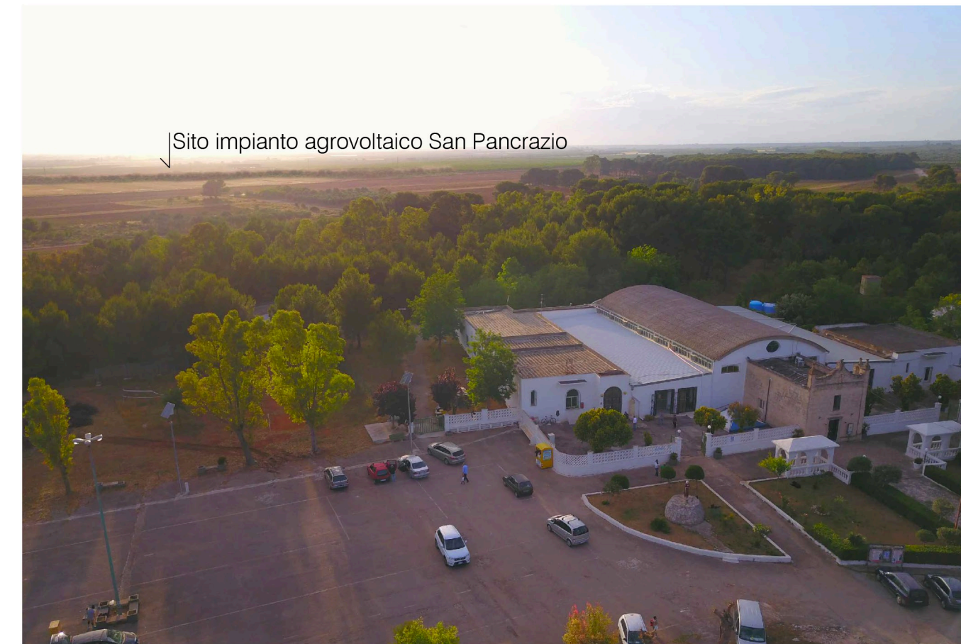
Sito: Santuario di S. Antonio. Stato di Progetto