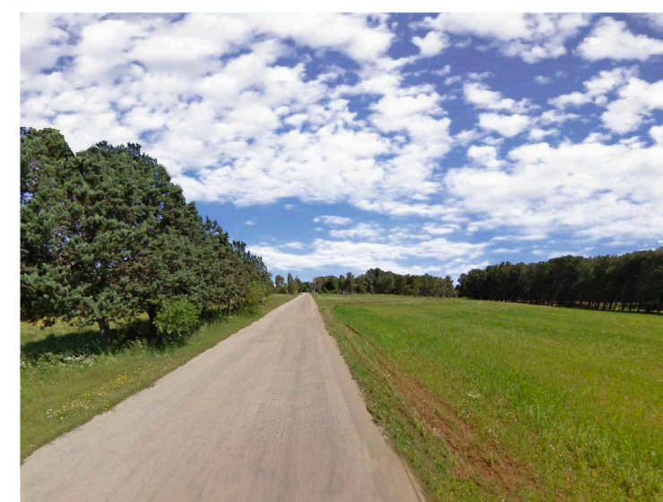
Sito 2: Bosco Vista 1