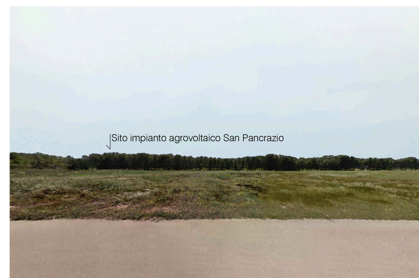
Sito 2: Bosco. Stato di Progetto