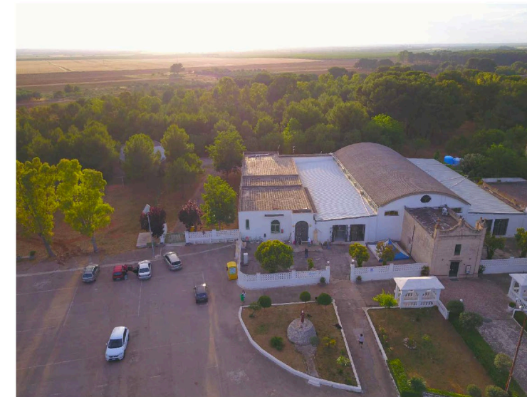
Sito: Santuario di S. Antonio Vista 3