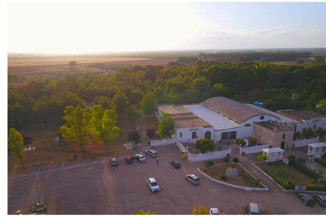
Sito: Santuario di S. Antonio. Stato di Fatto