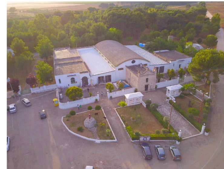
Sito: Santuario di S. Antonio Vista 2