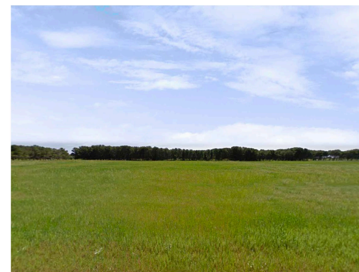
Sito 2: Bosco Vista 2