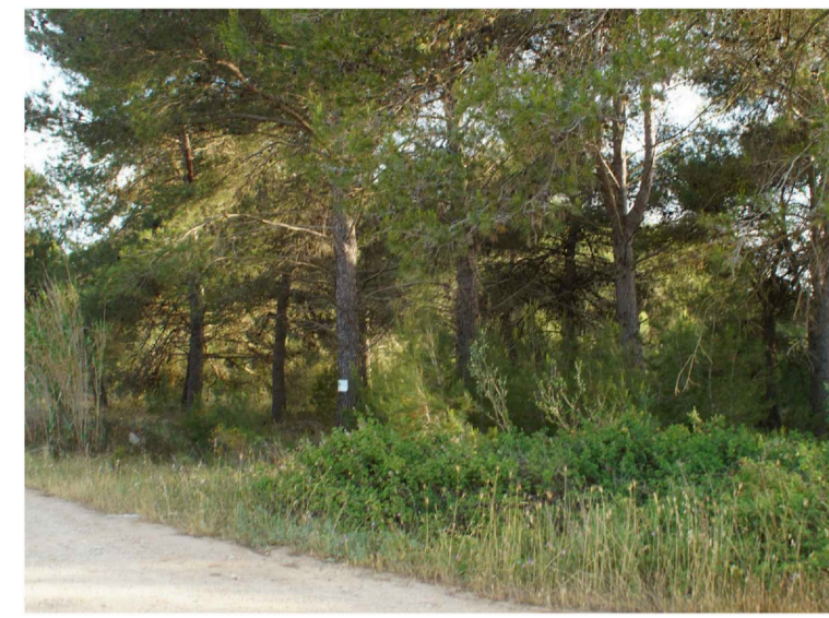
Sito: Bosco Vista 1