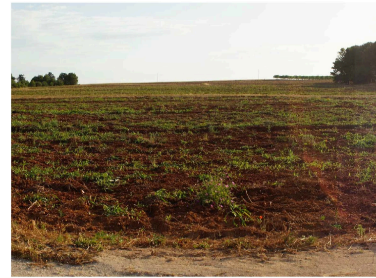
Sito: Bosco Vista 3