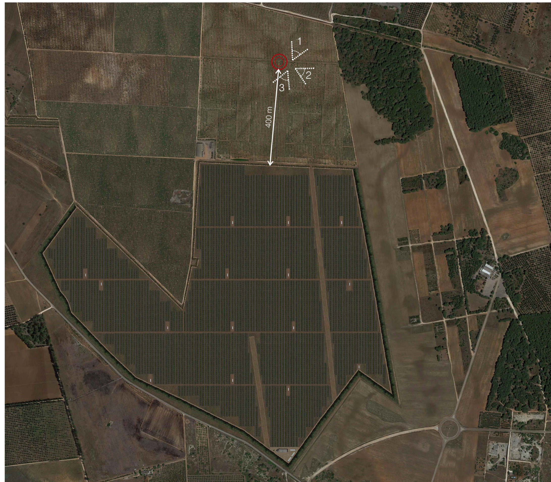
Ortofoto Sito 4: Dolina e mandorleto