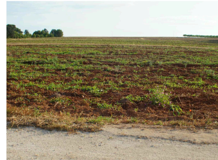
Sito: Bosco Vista 2