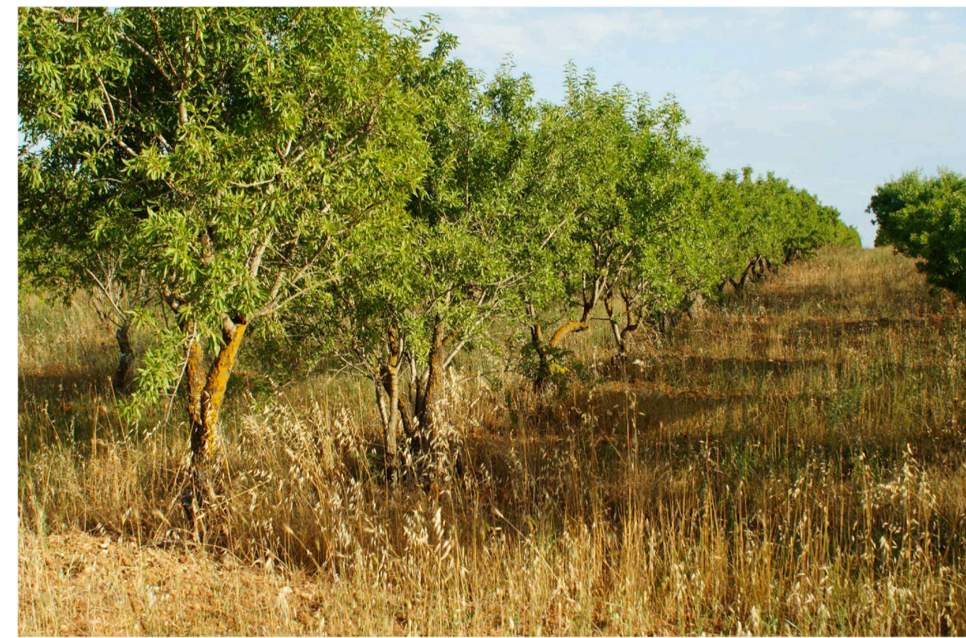
Sito 4: Dolina e mandorleto. Stato di Fatto