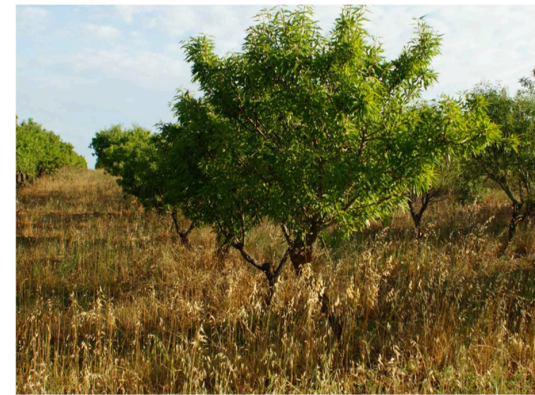
Sito 4: Dolina e mandorleto Vista 2