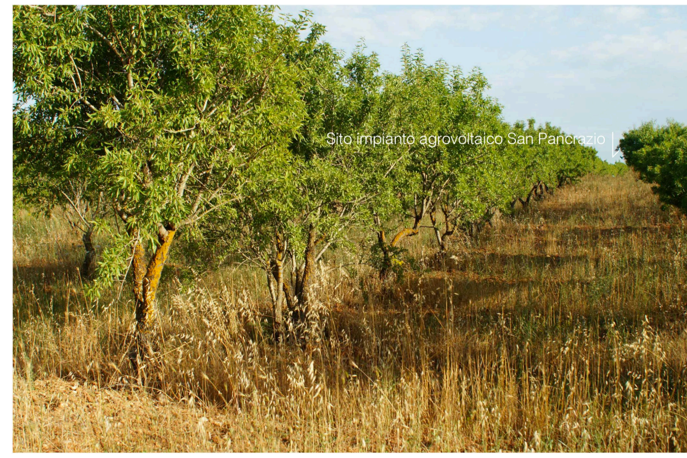
Sito 4: Dolina e mandorleto Stato di Progetto