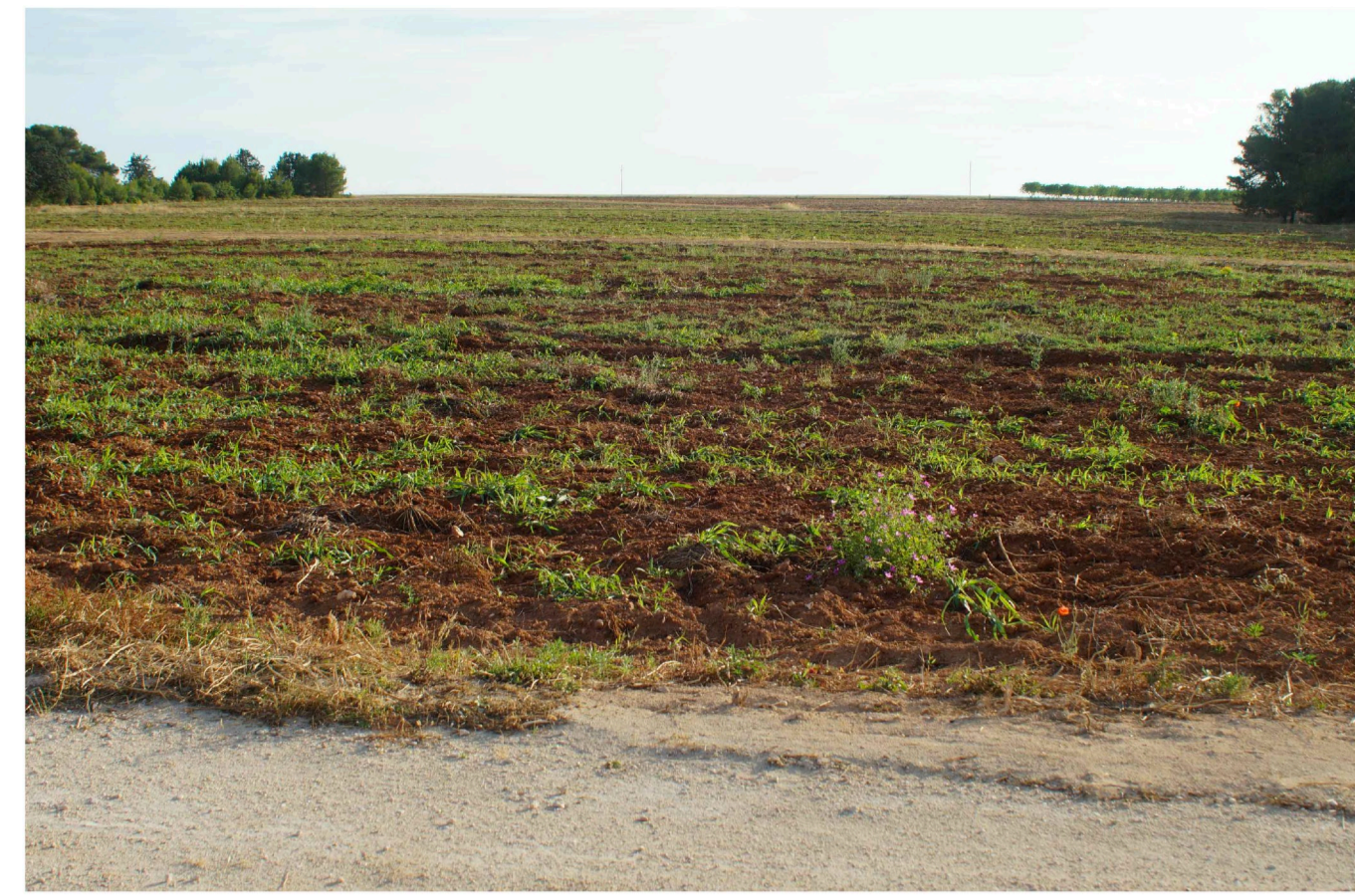
Sito: Bosco. Stato di Fatto