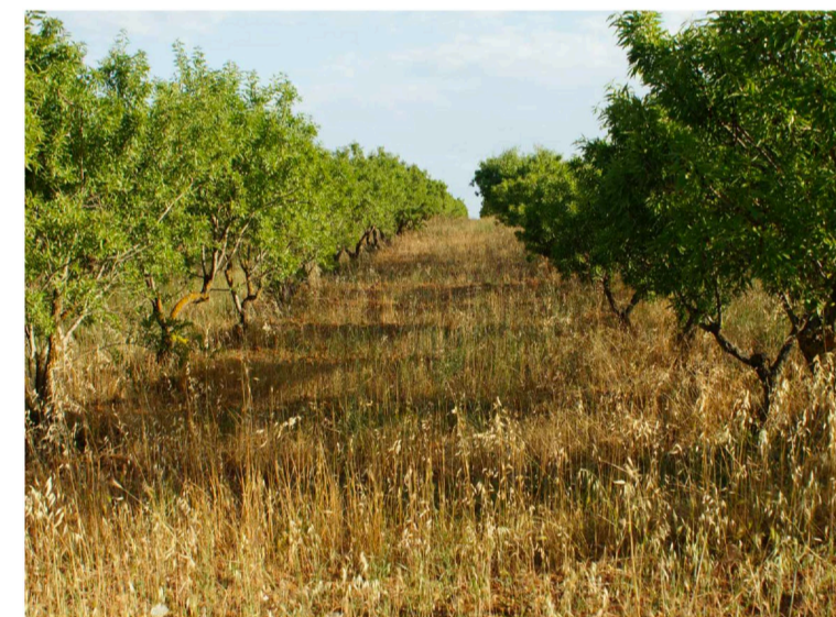
Sito 4: Dolina e mandorleto Vista 1