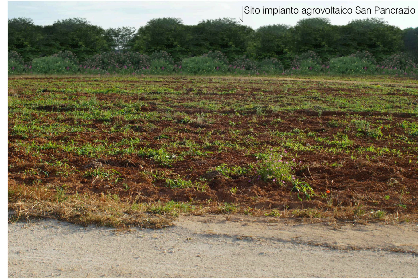
Sito: Bosco Stato di Progetto