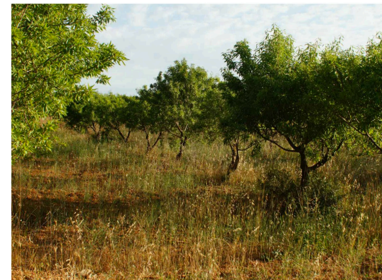
Sito 4: Dolina e mandorleto Vista 3