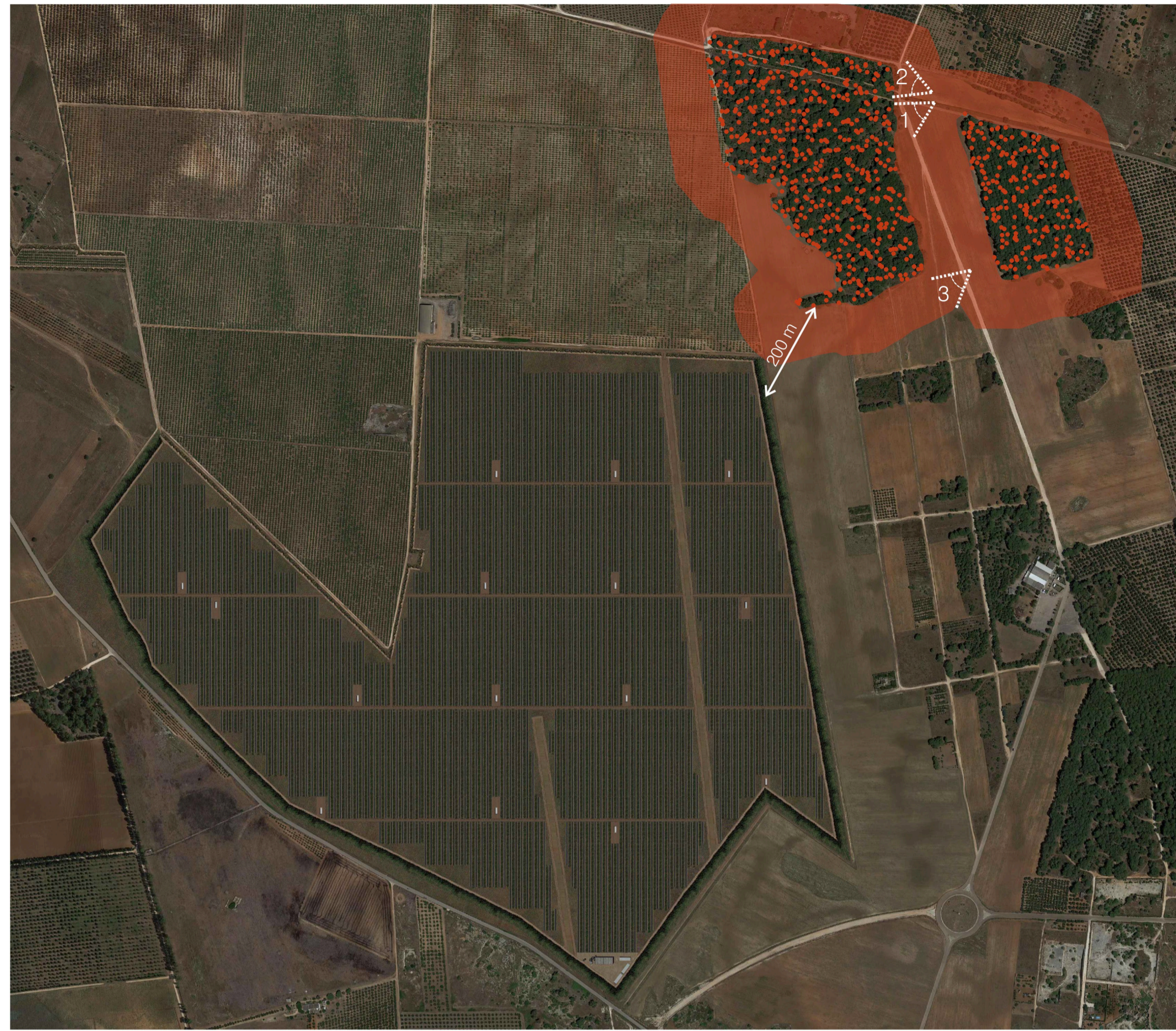
Ortofoto Sito: Bosco