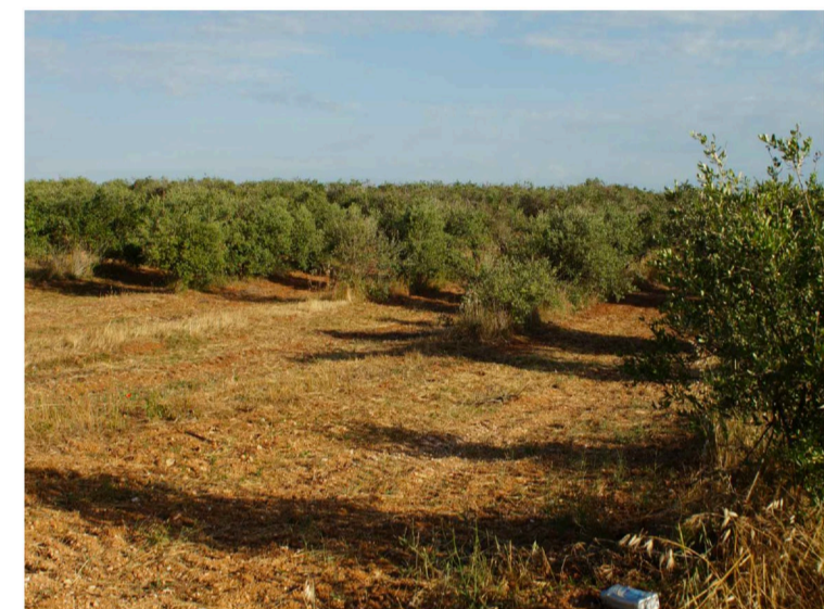
Sito: Dolina e uliveto Vista 3