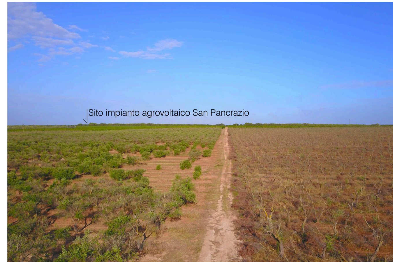
Sito: Dolina e uliveto. Stato di Progetto