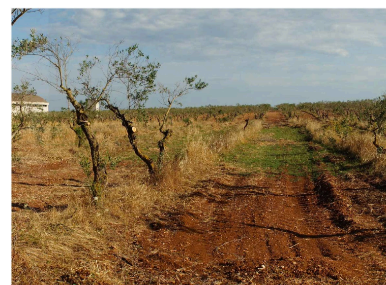
Sito 6: Dolina e uliveto Vista 3