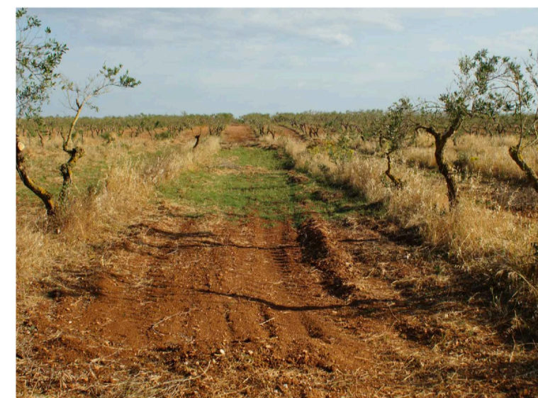
Sito 6: Dolina e uliveto Vista 2