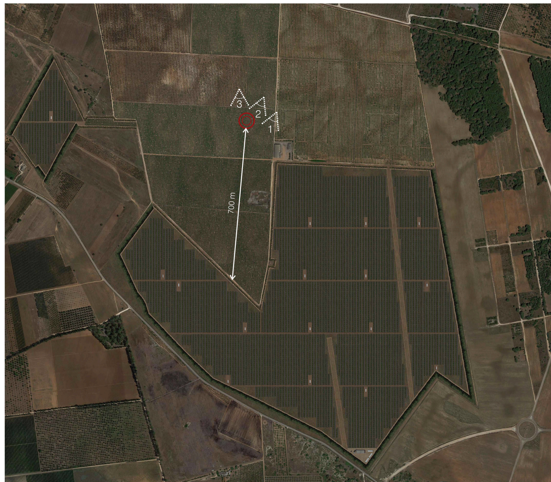
Ortofoto Sito 6: Dolina e uliveto