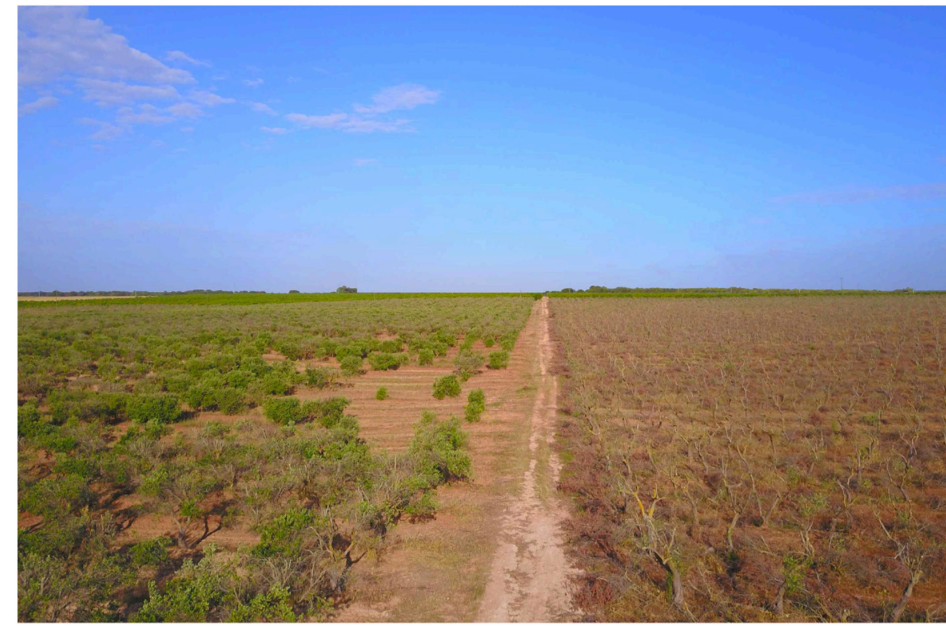
Sito: Dolina e uliveto. Stato di Fatto