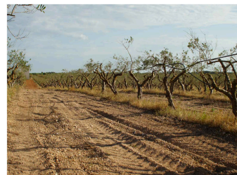
Sito 6: Dolina e uliveto Vista 1