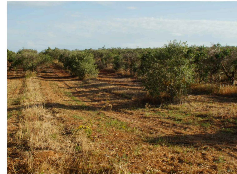
Sito: Dolina e uliveto Vista 2