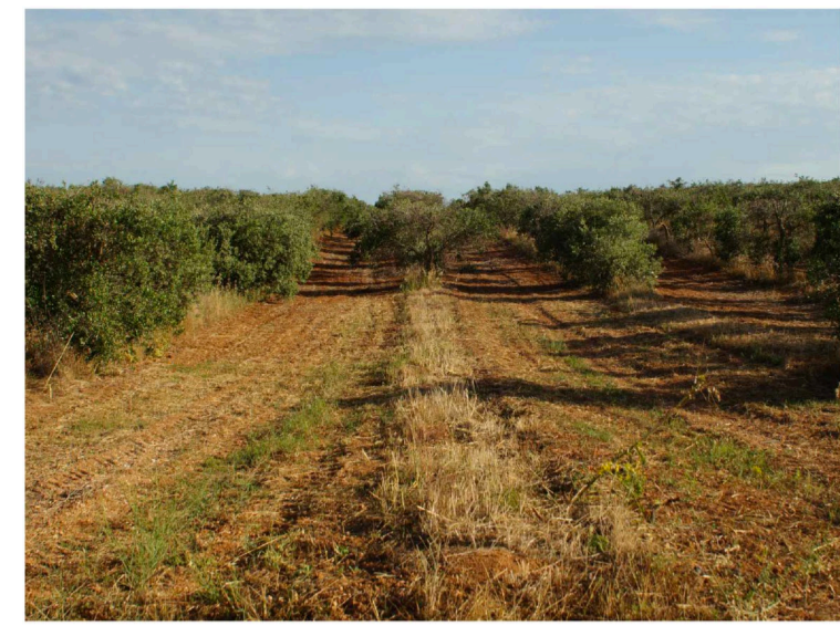
Sito: Dolina e uliveto Vista 1