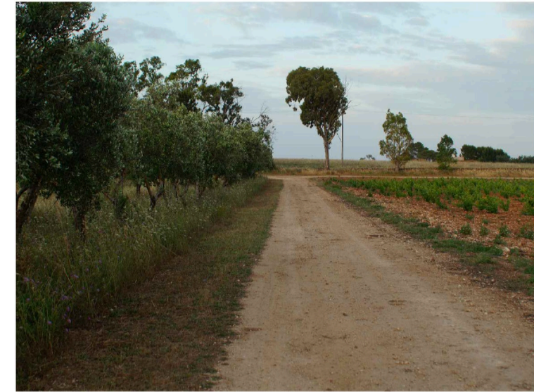
Sito: Grotte Vista 2