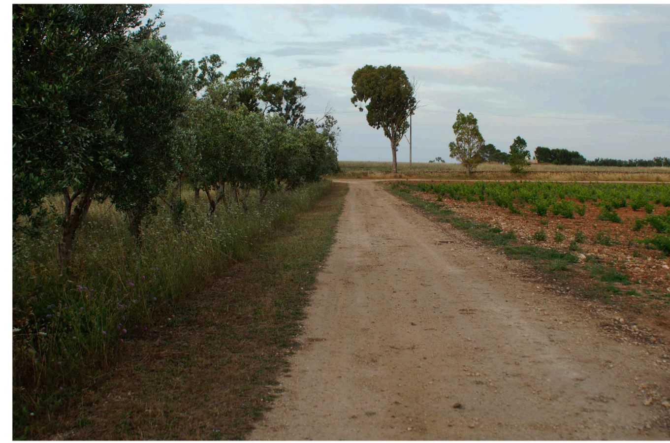
Sito: Grotte. Stato di Fatto