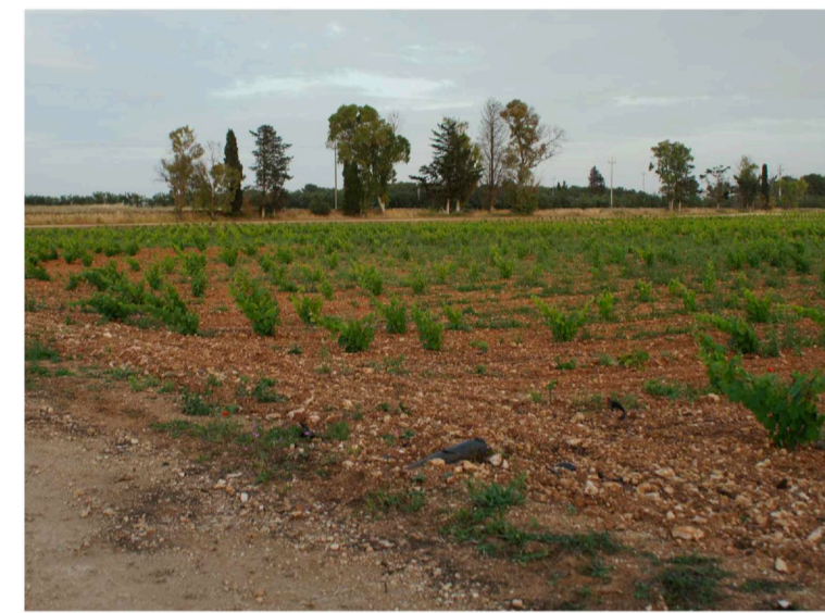
Sito: Grotte Vista 3