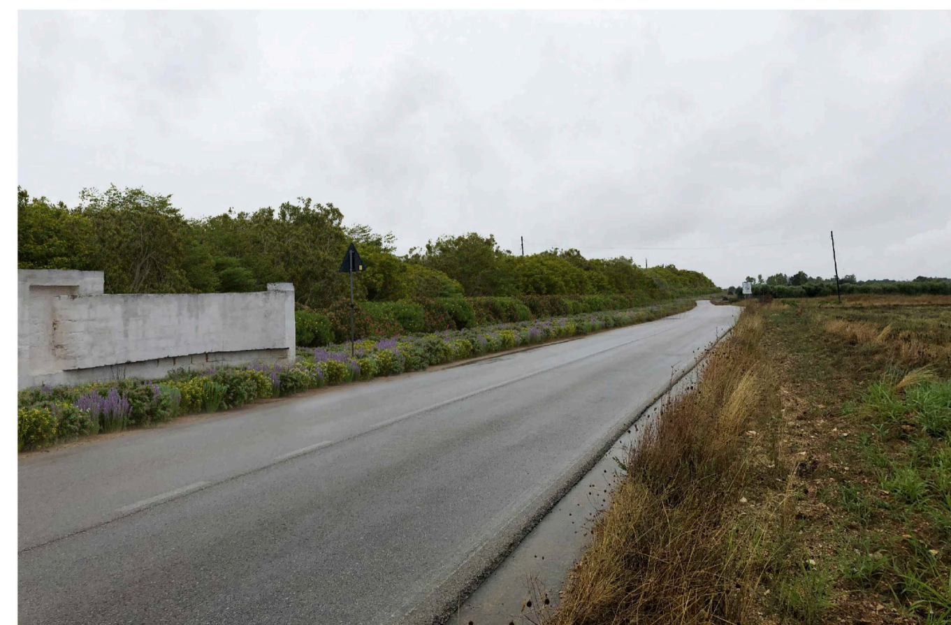
Sito: Grotte. Stato di Progetto