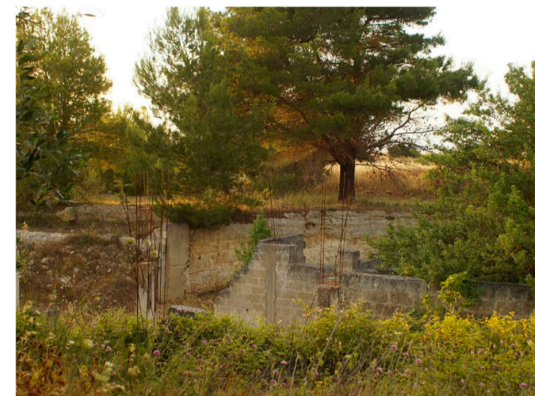
Sito: Grotte Vista 2