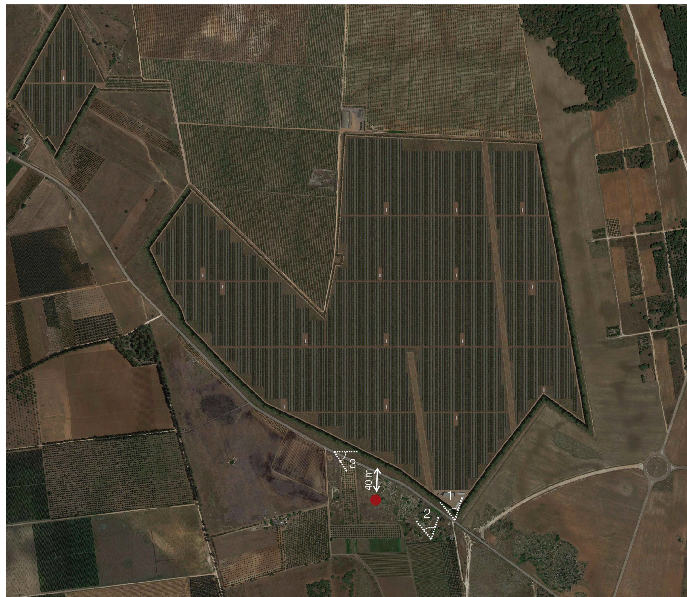
Ortofoto Sito: Grotte