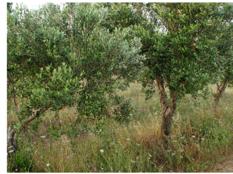
Sito: Grotte Vista 1