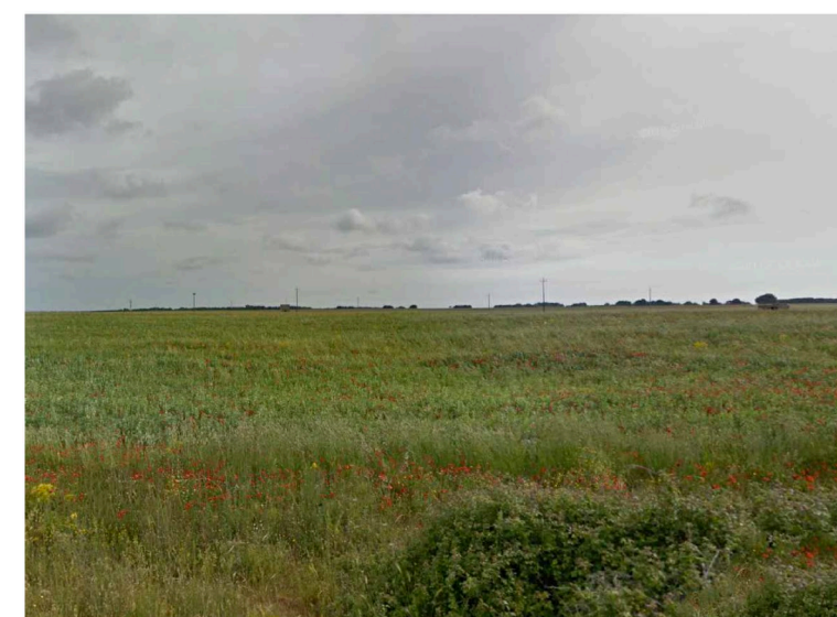
Sito: Grotte Vista 3