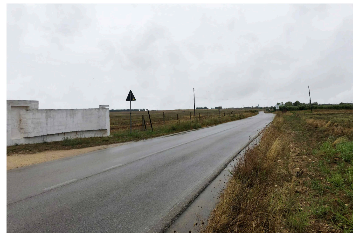
Sito: Grotte. Stato di Fatto