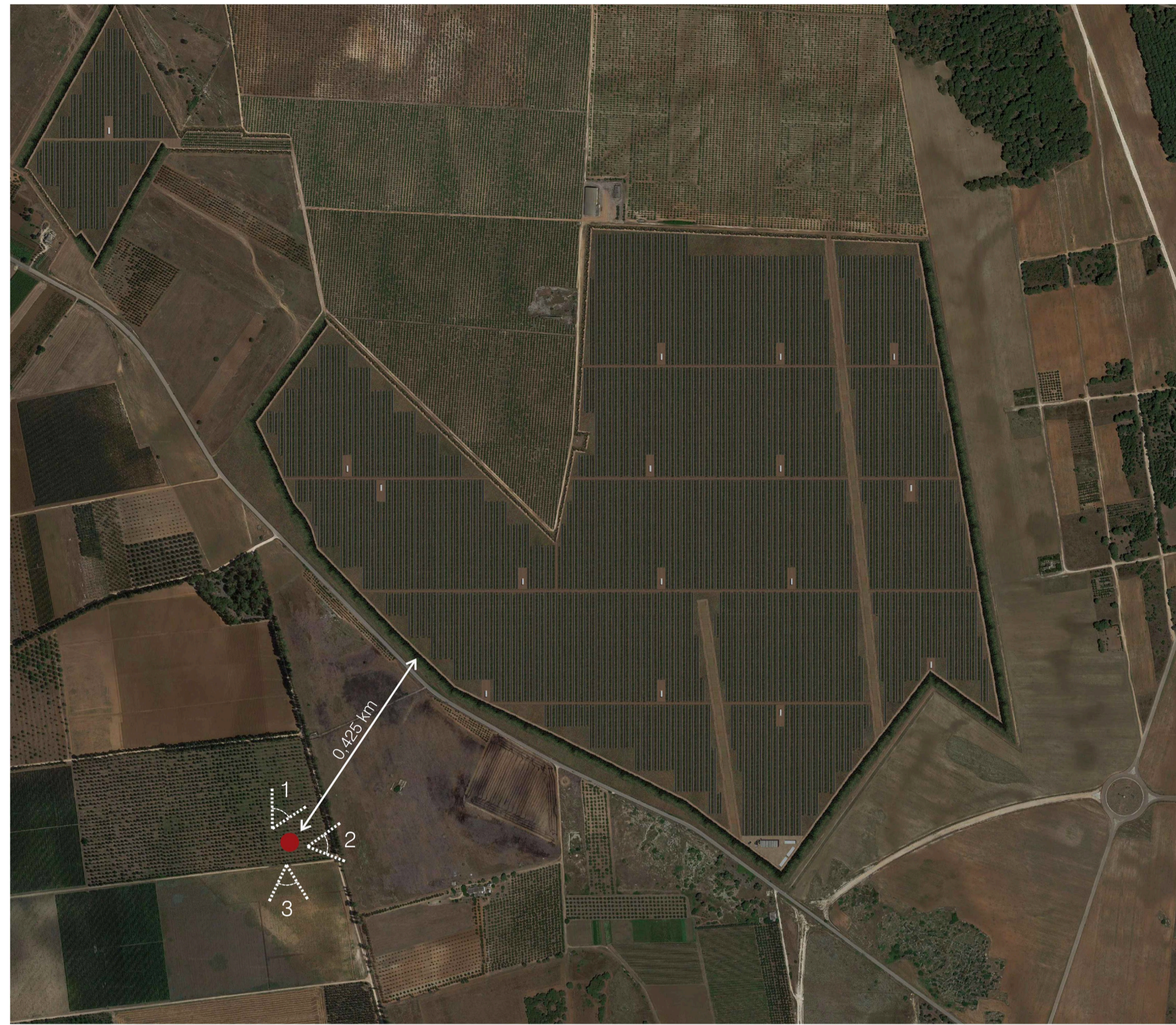
Ortofoto Sito: Grotte