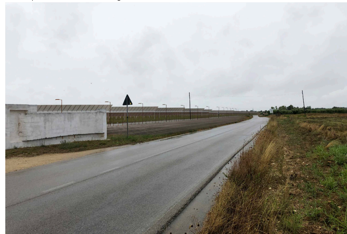
Inquadratura 3 - Stato di progetto. Vista impianto senza fascia di mitigazione.