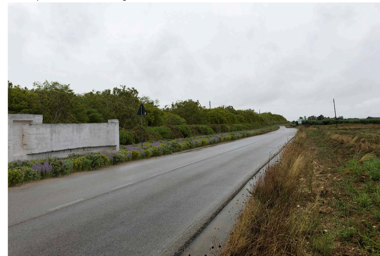
Inquadratura 3 - Stato di progetto. Vista impianto con fascia di mitigazione.