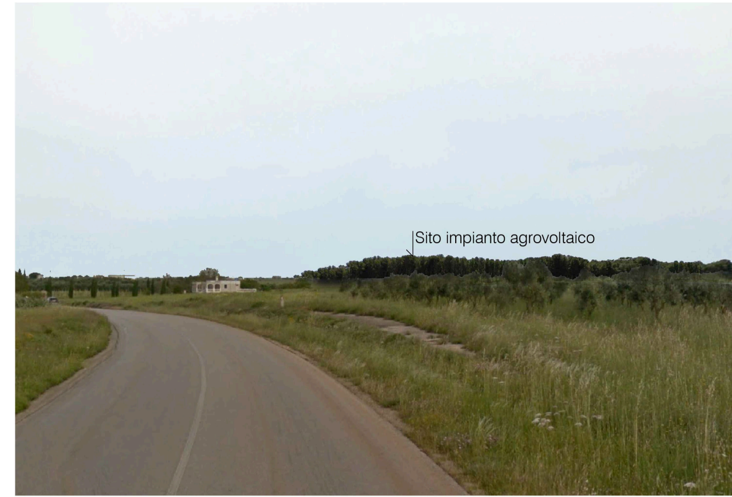
Inquadratura 1 - Stato di progetto. Vista impianto con fascia di mitigazione.