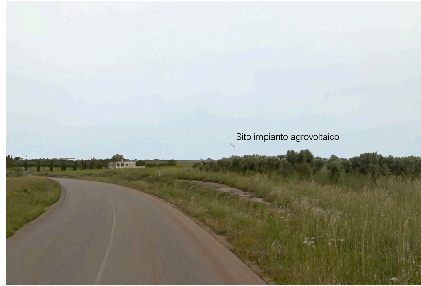
Inquadratura 1 - Stato di progetto. Vista impianto senza fascia di mitigazione.