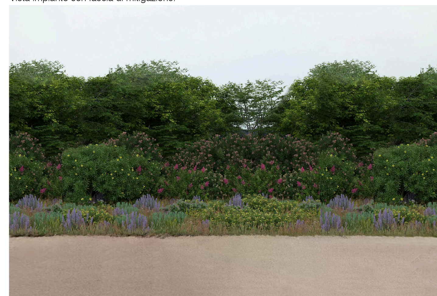
Inquadratura 4 - Stato di progetto. Vista impianto con fascia di mitigazione.