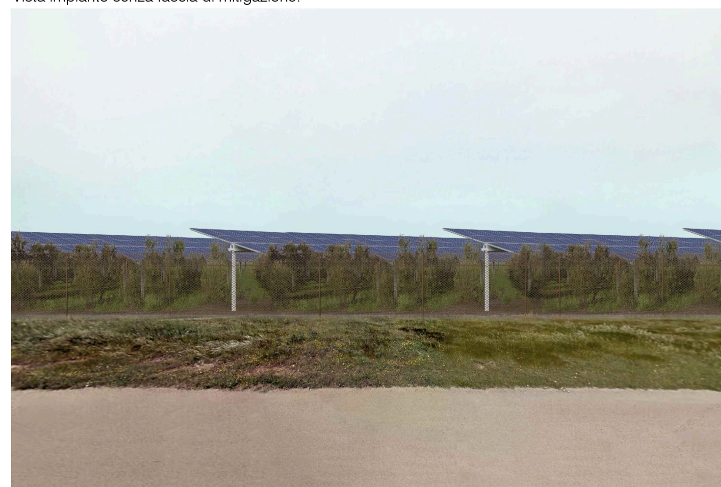
Inquadratura 4 - Stato di progetto. Vista impianto senza fascia di mitigazione.