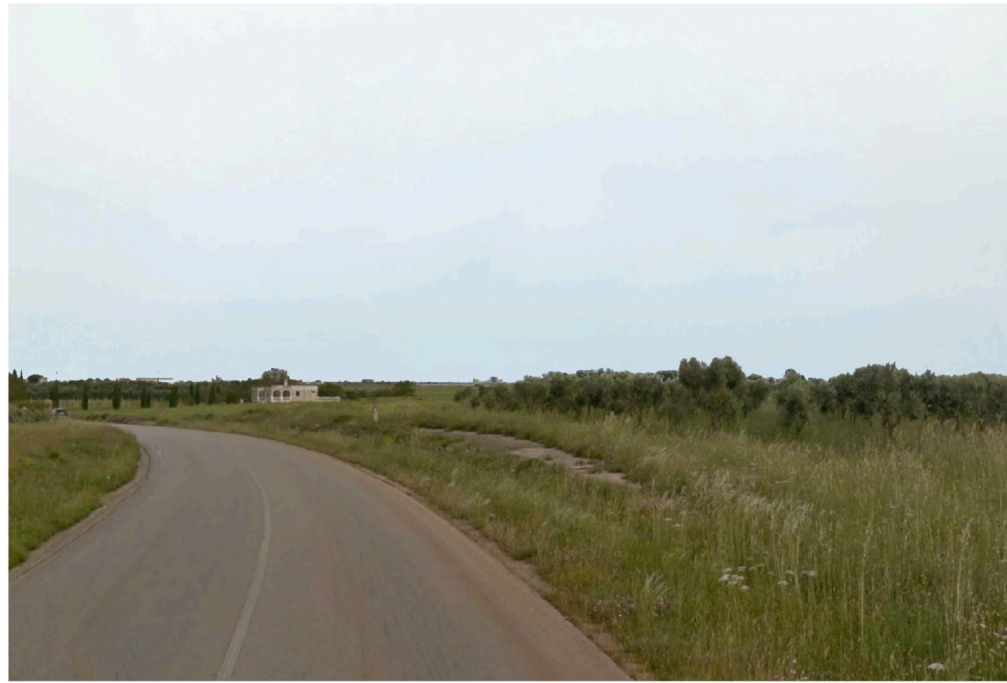
Inquadratura 1 - Stato di fatto.