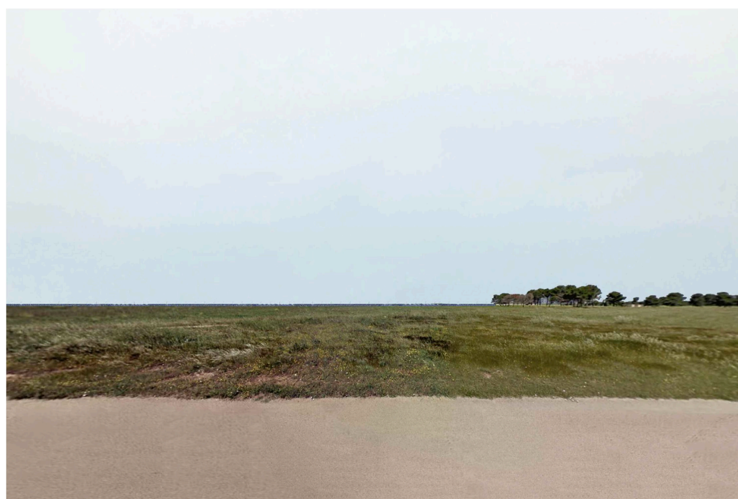
Inquadratura 4 - Stato di fatto.