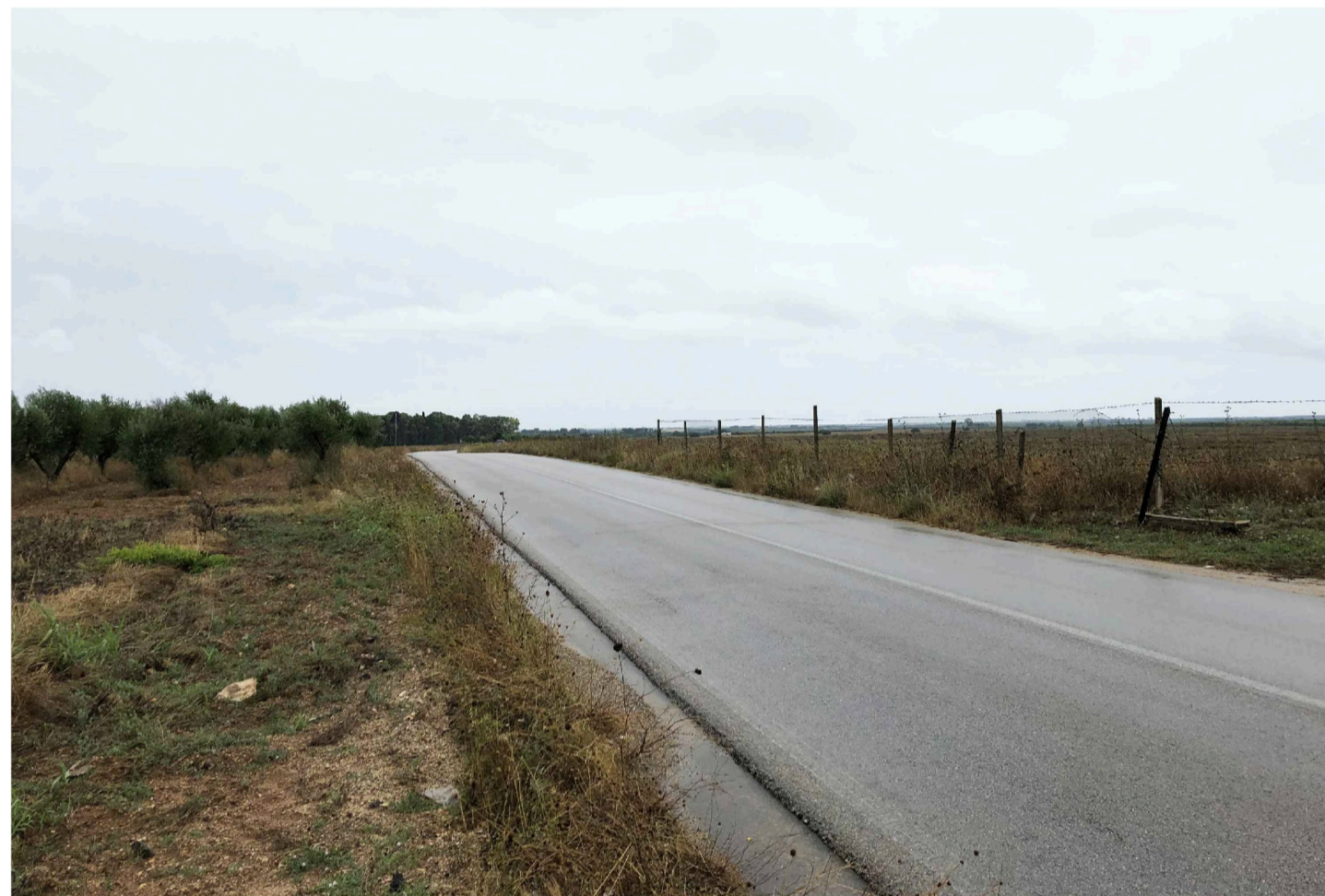
Inquadratura 2 - Stato di fatto.