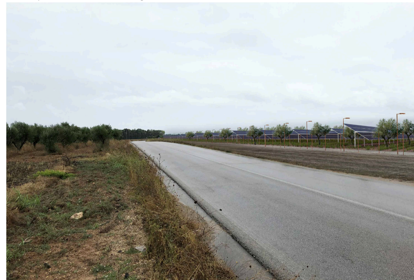
Inquadratura 2 - Stato di progetto. Vista impianto senza fascia di mitigazione.