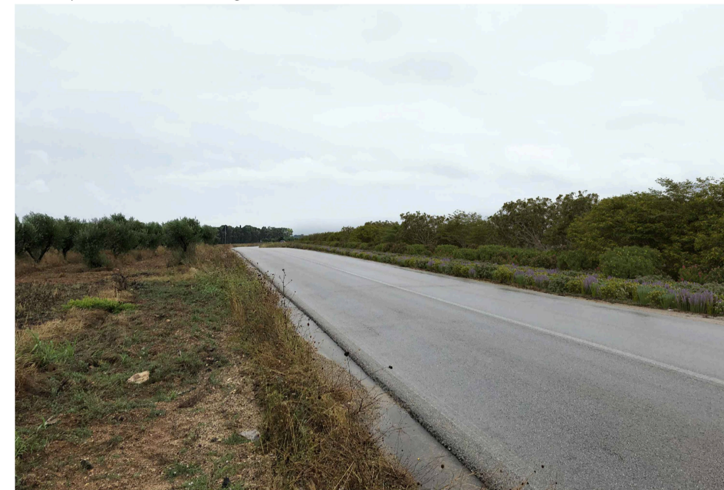
Inquadratura 2 - Stato di progetto. Vista impianto con fascia di mitigazione.