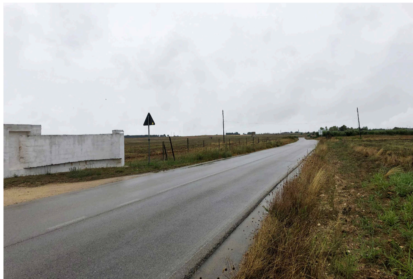
Inquadratura 3 - Stato di fatto.