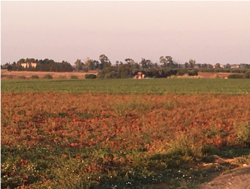
Figura 1 Terreno coltivato e sottoposto ad arature frequenti

La società Marseglia ha inteso favorire la riqualificazione ecologica dei suddetti terreni, ricompresi nella RNS di Torre Guaceto, finanziando un importante intervento di ripristino ambientale. Tale ripristino si inquadra quale opera