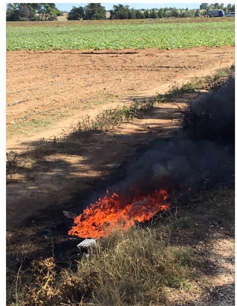
Figura 2-3 Rifiuti provenienti dall'agricoltura