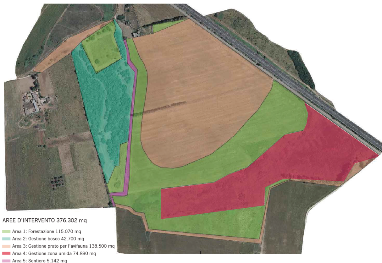
Figura 5 Perimetri aree di intervento

Come si evince dalla Tabella 1, le aree di intervento ricadono nella ZSC (Zona Speciale di Conservazione) Torre Guaceto e Macchia S. Giovanni (IT9140005). Inoltre, secondo Piano di gestione della riserva (approvato con Decreto 28 gennaio 2013, n. 107), le aree di intervento sono classificate come zona C ovvero "aree di protezione" nelle quali, in armonia con le finalità istitutive e in conformità ai criteri generali fissati dall'Ente gestore, possono continuare, secondo gli usi tradizionali ovvero secondo metodi di agricoltura biologica, le attività agro-silvo-pastorali nonché la raccolta dei prodotti naturali, ed è incoraggiata anche la produzione artigianale di qualità, secondo la normativa nazionale. Nel caso specifico il Piano di gestione della riserva, prevede come obiettivo di gestione per le zone C il ripristino della naturalità.