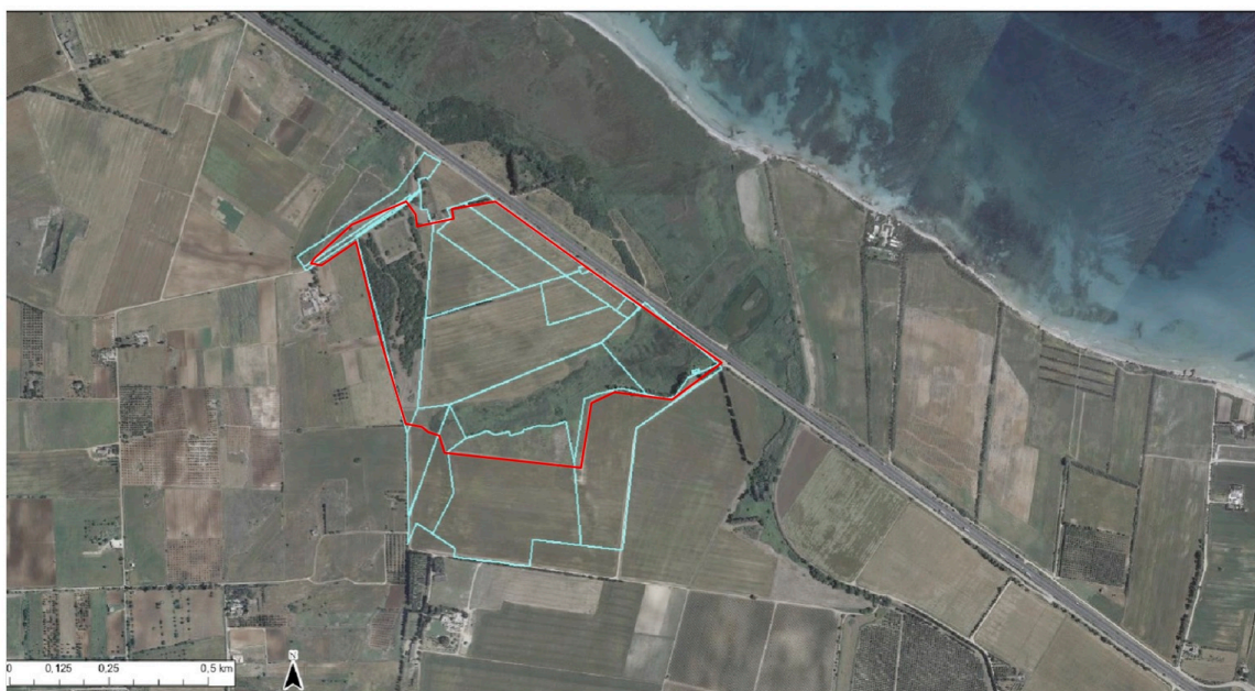
fonte: webgis del PPTR, sovrapposizione ortofoto dell'area di intervento alle particelle catastali

Si rende noto che trattandosi di una stima correlata ad uno studio di fattibilità, i dati relativi alle superfici da espropriare richiedono obbligatoriamente verifica a seguito di un frazionamento durante la fase del progetto esecutivo.