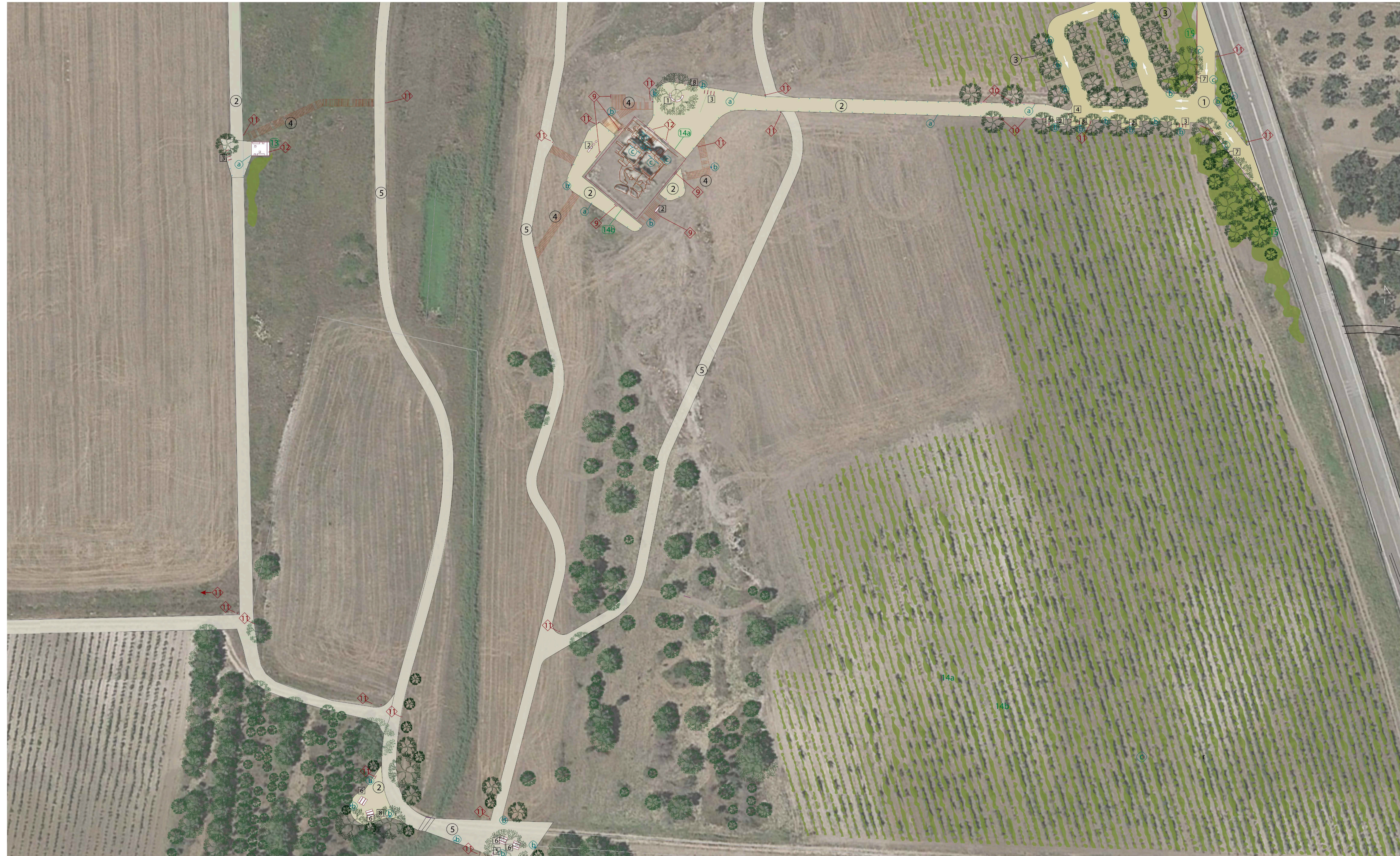
Dettaglio planimetria ortofoto - Terme Romane di Malvindi Stato di fatto