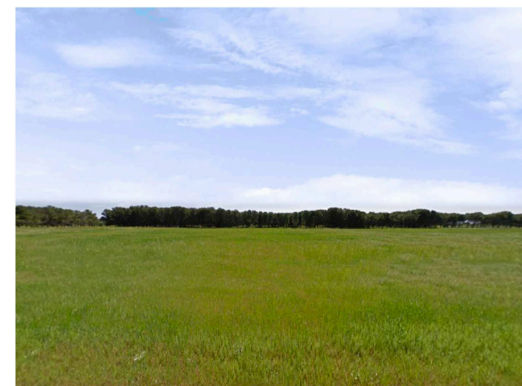
Sito 2: Bosco Vista 2