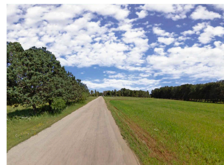
Sito 2: Bosco Vista 1