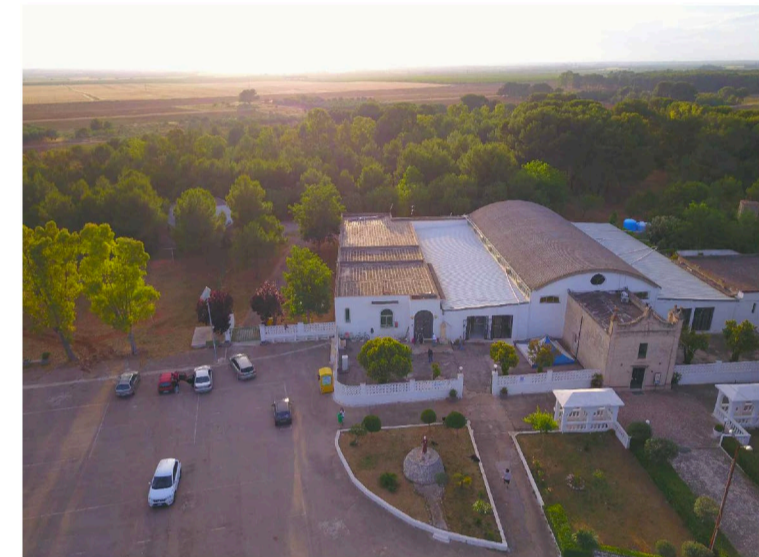
Sito: Santuario di S. Antonio Vista 3