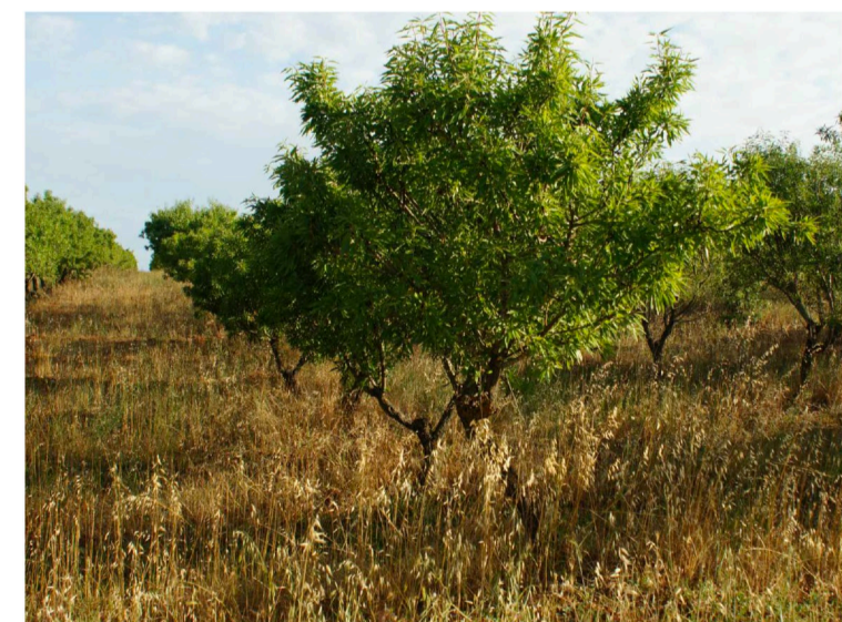
Sito 4: Dolina e mandorleto Vista 2