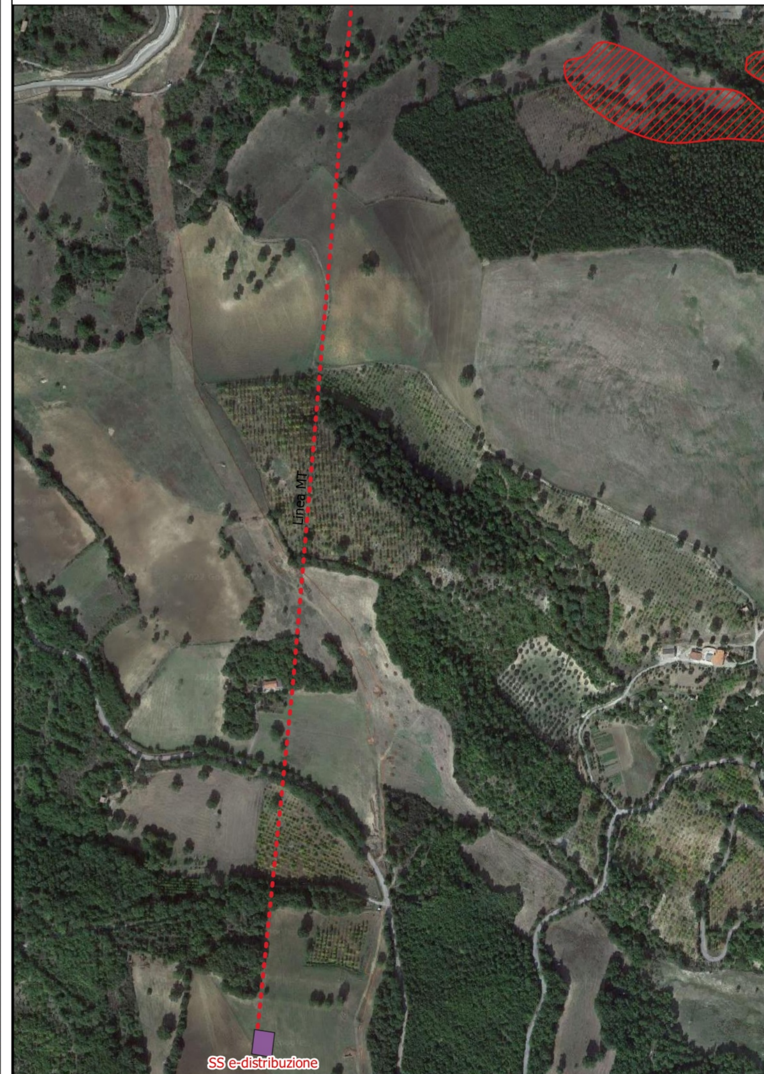
Particolare Linea MT di connessione 2 - 1:5000