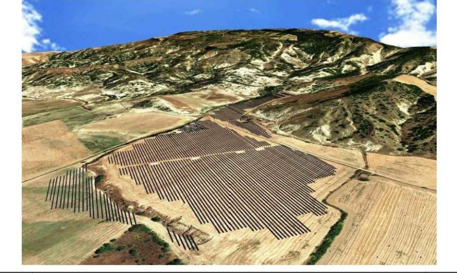
Tavola: A.12.a.19.b Elaborato: Piano particolare di esproprio grafico Scala: 1:2.000

Progetto integrato agrivoltaico denominato "MASSERIA GLIONNA": riattivazione di una azienda zootecnica dismessa e realizzazione di una centrale fotovoltaica di potenza nominale pari a 19,9980 MW con le relative opere connesse ed infrastrutture indispensabili