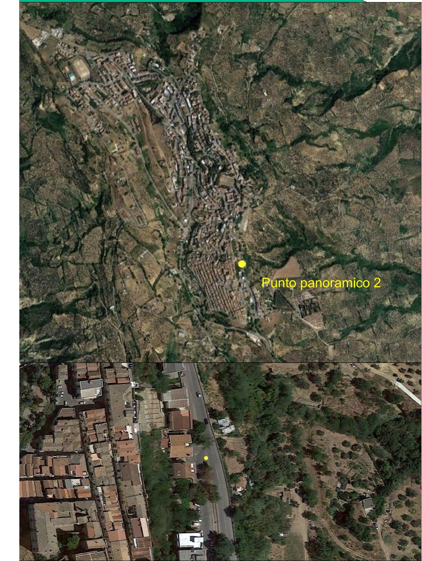
Foto inserimento Ante operam