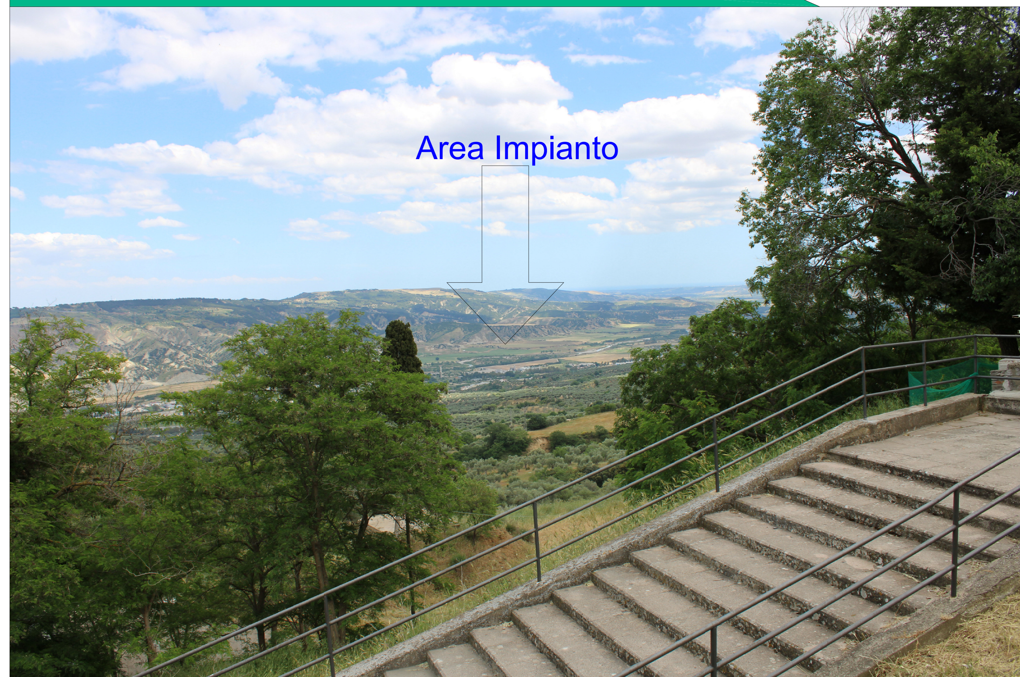
Foto inserimento Post operam