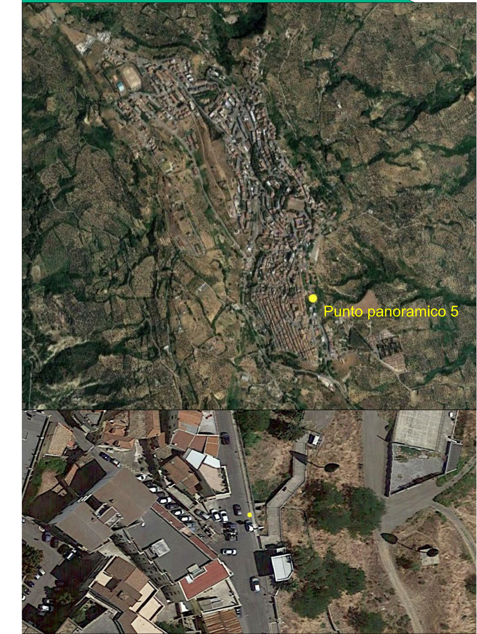
Foto inserimento Ante operam