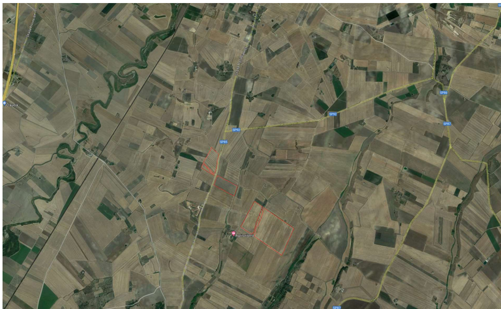
Figura 1: inquadramento su ortofoto

Le visure catastali a corredo confermano pienamente tale indicazione così come lo stato di fatto.