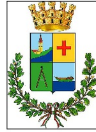
Comune di Musile di Piave