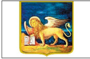
Regione del Veneto