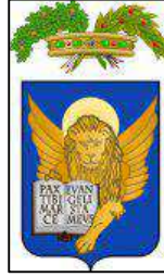
Città metropolitana di Venezia