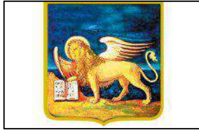
Regione del Veneto