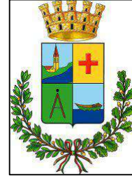
Comune di Musile di Piave