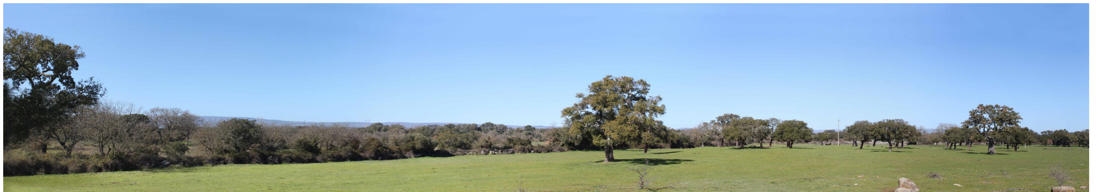
Figura 6: Vista panoramica dell'area dal PF24