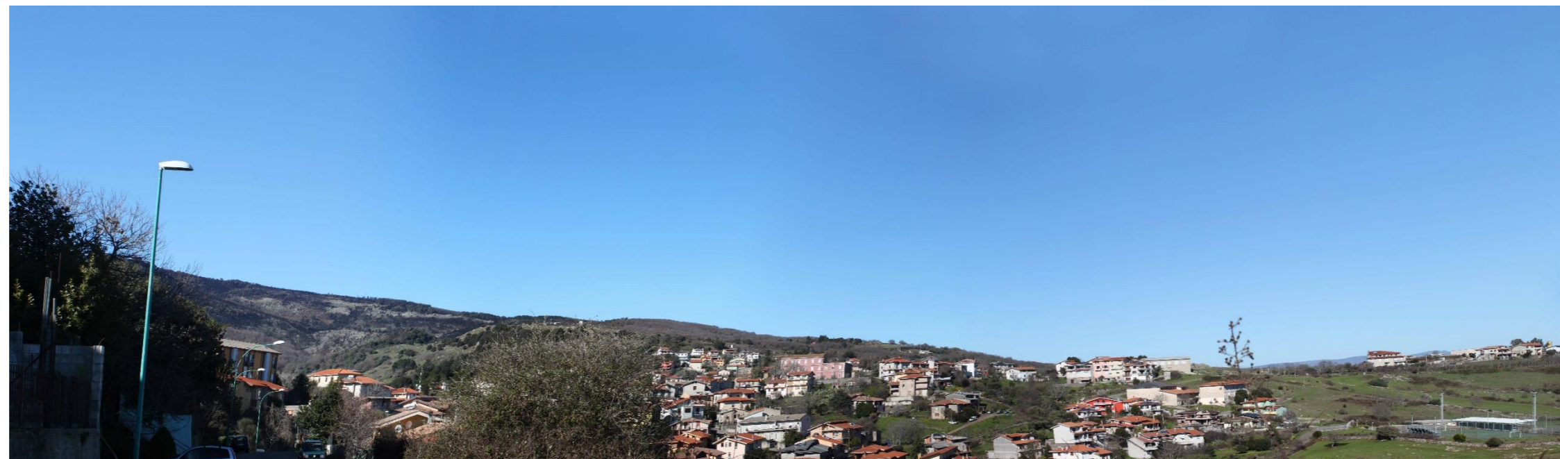
Figura 3: Vista panoramica dell'area dal PF08