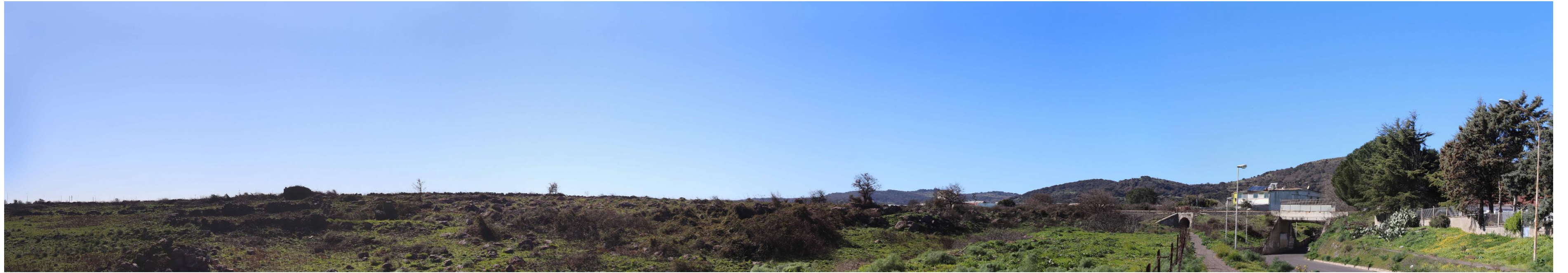
Figura 2: Vista panoramica dell'area dal PF06