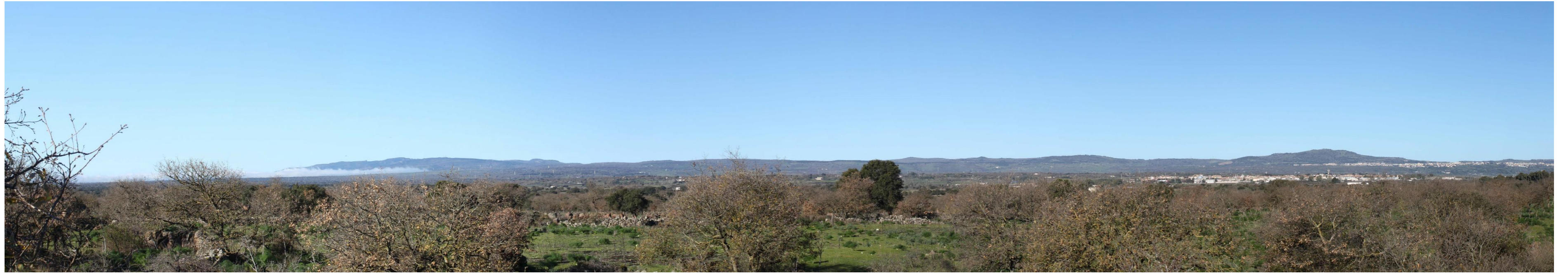
Figura 4: Vista panoramica dell'area dal PF19