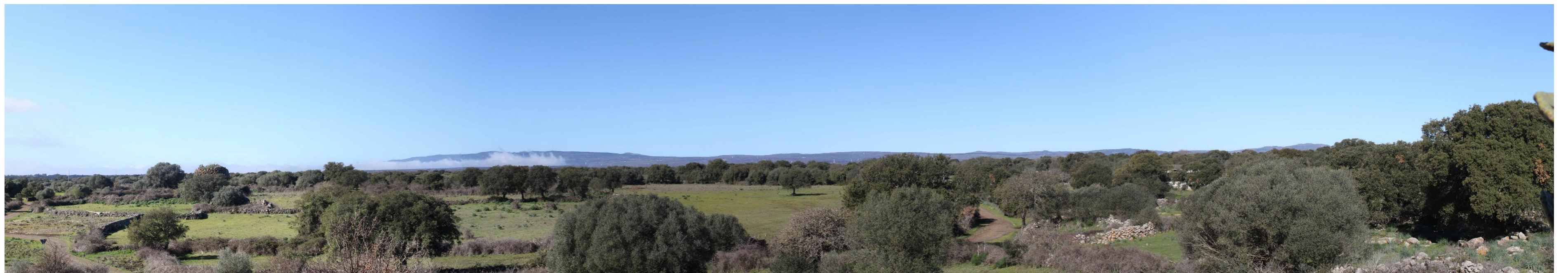
Figura 5: Vista panoramica dell'area dal PF22