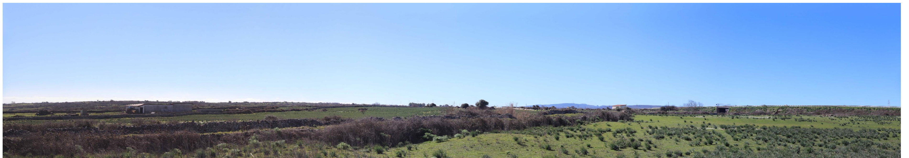
Figura 4: Vista panoramica dell'area dal PF13