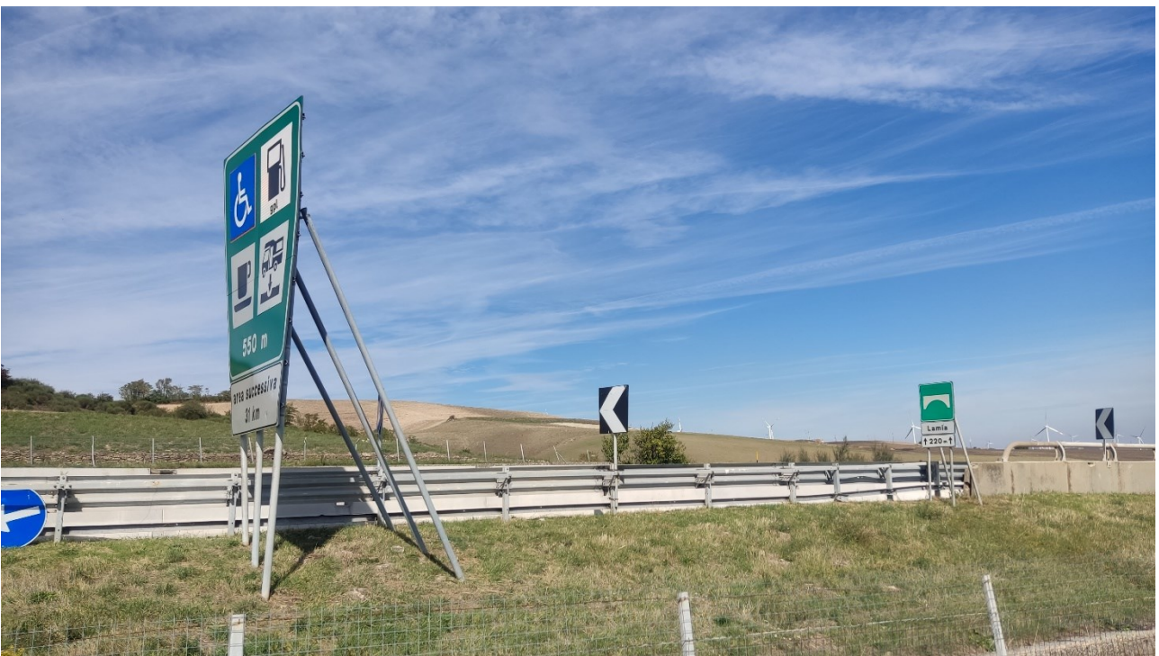
Punto di presa n° 22 - Stato di Fatto