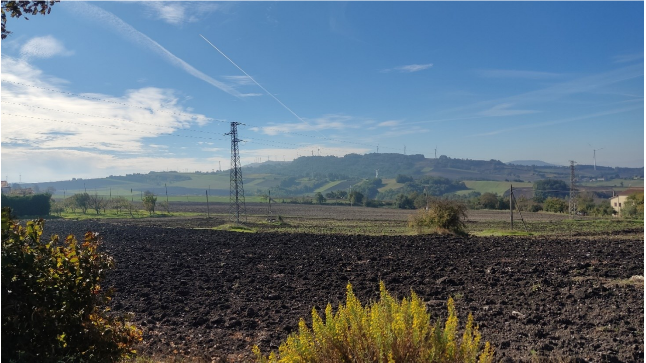
Punto di presa n° 11 - Stato di Fatto