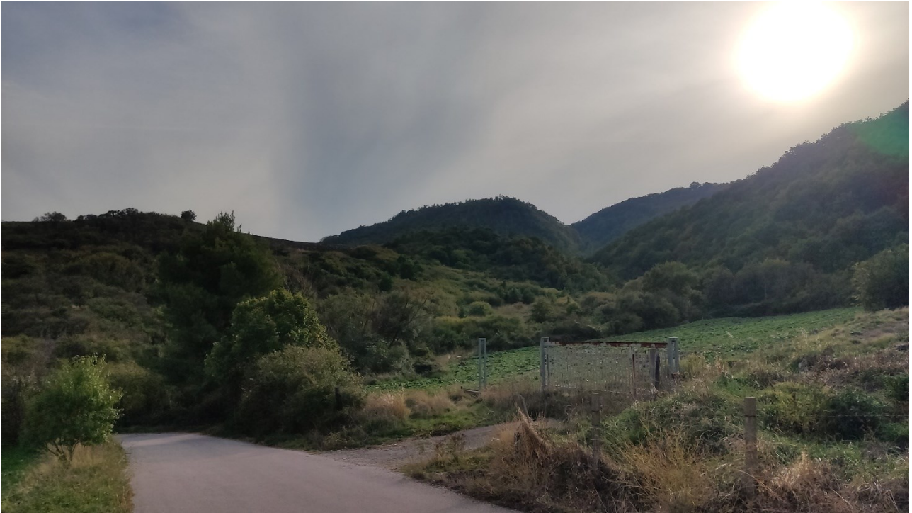
Punto di presa n° 25 - Stato di Fatto