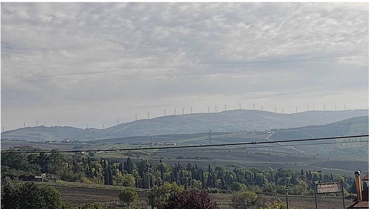
Punto di presa n° 38 - Stato di Fatto