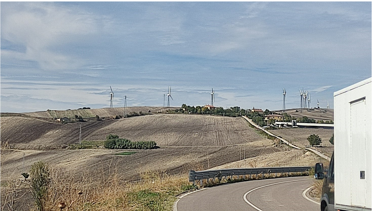
Punto di presa n° 28 - Stato di Fatto