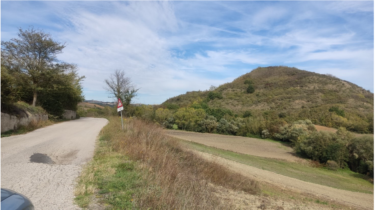
Punto di presa n° 42 - Stato di Fatto