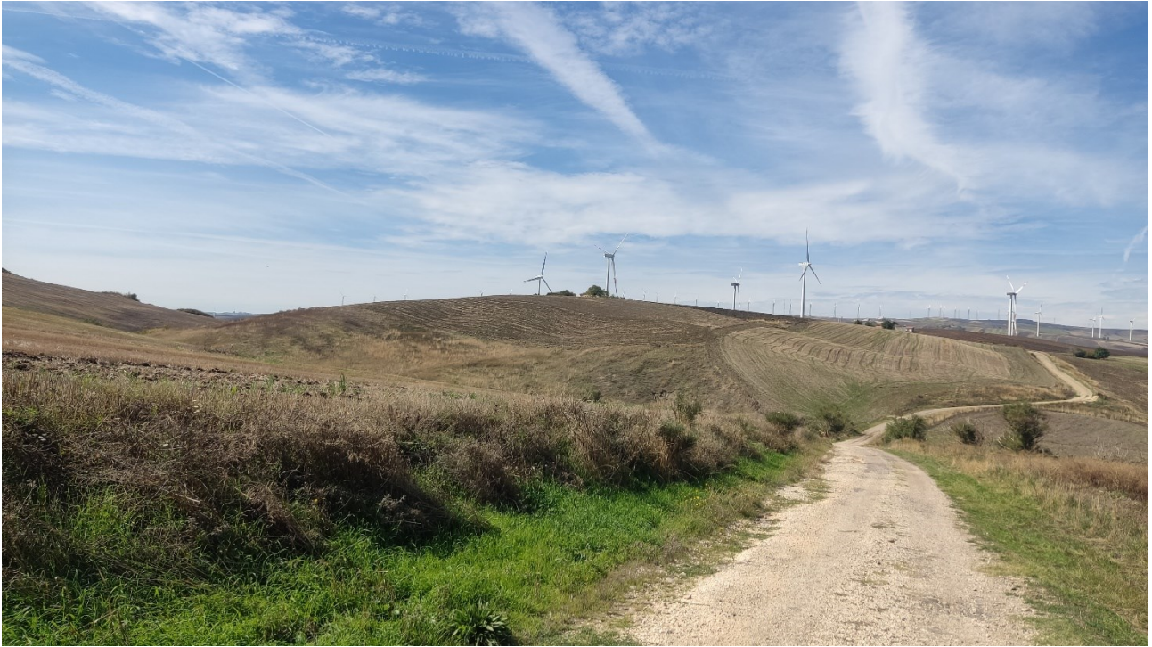
Punto di presa n° 31 - Stato di Fatto