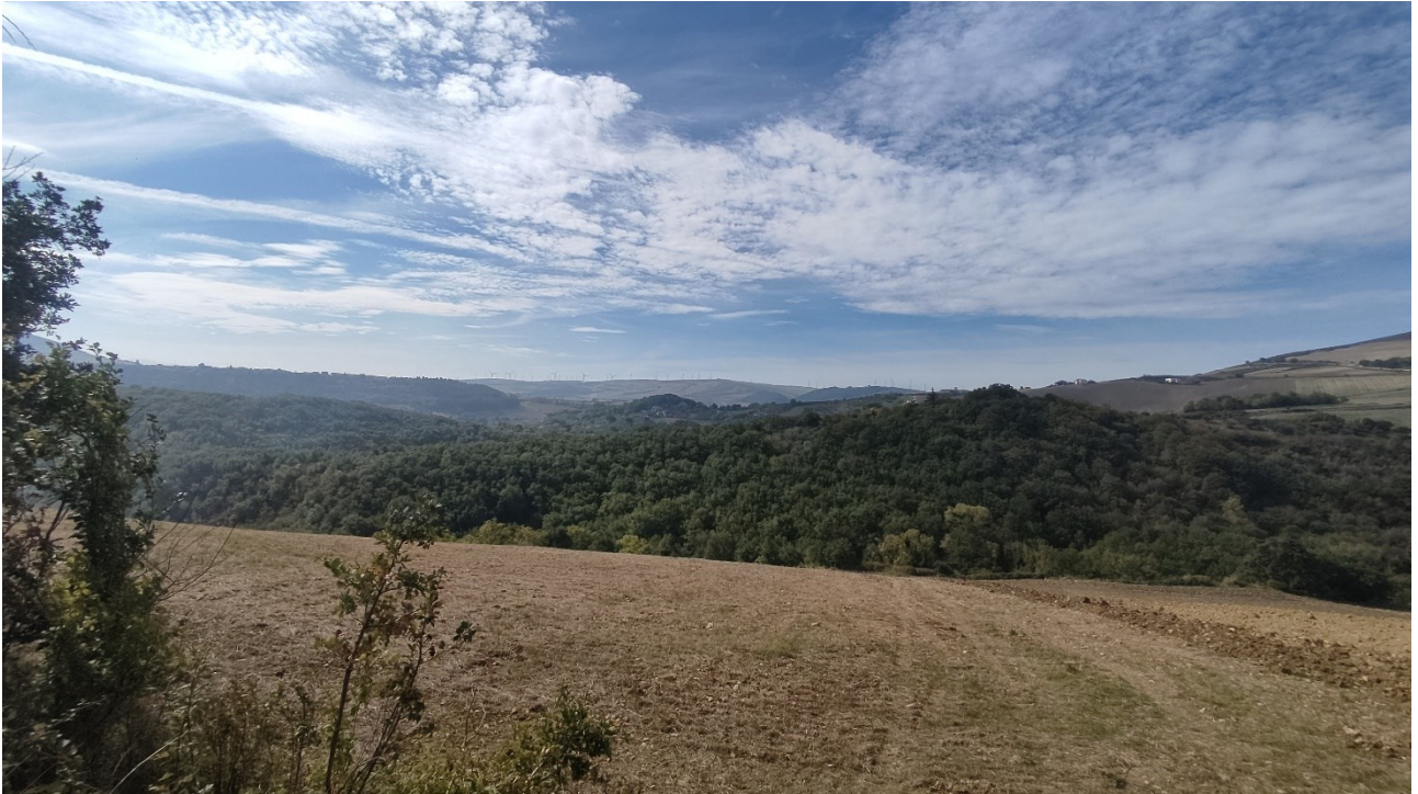
Punto di presa n° 35 - Stato di Fatto