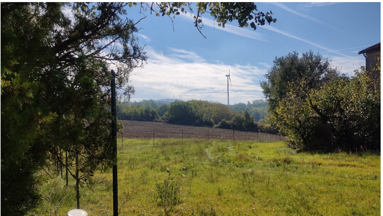
Punto di presa n° 36 - Stato di Fatto