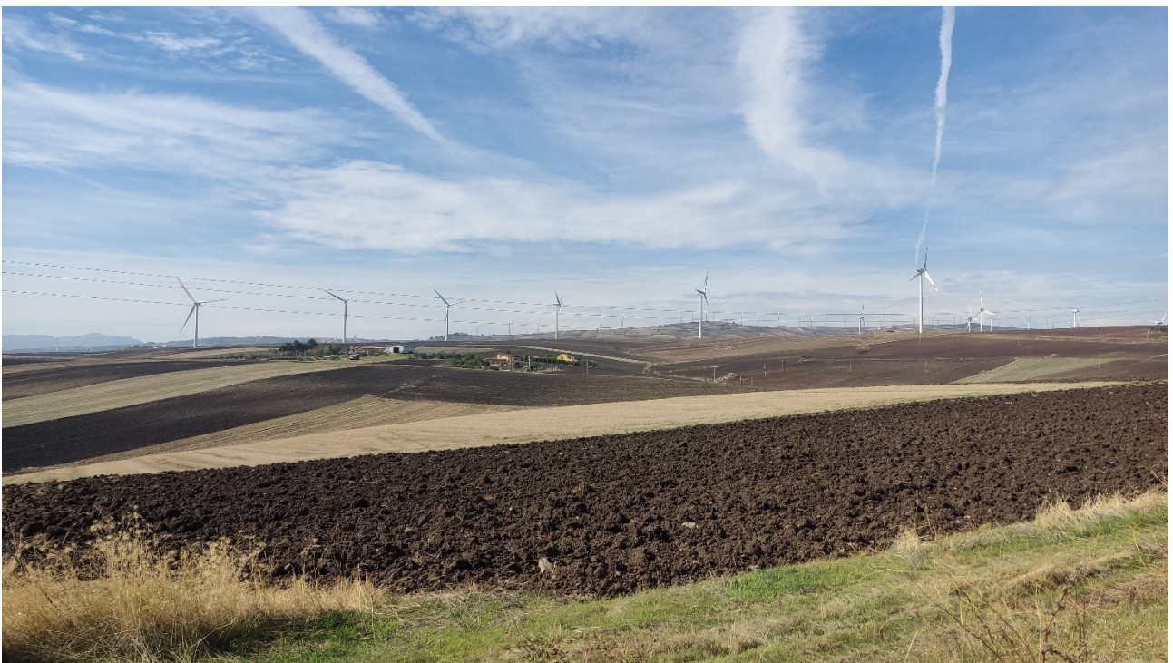
Punto di presa n° 32 - Stato di Fatto