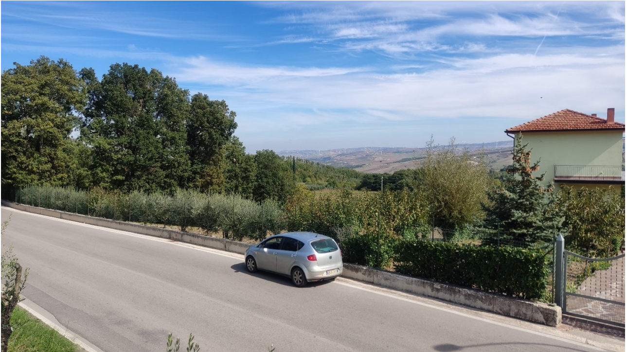
Punto di presa n° 5 - Stato di Fatto