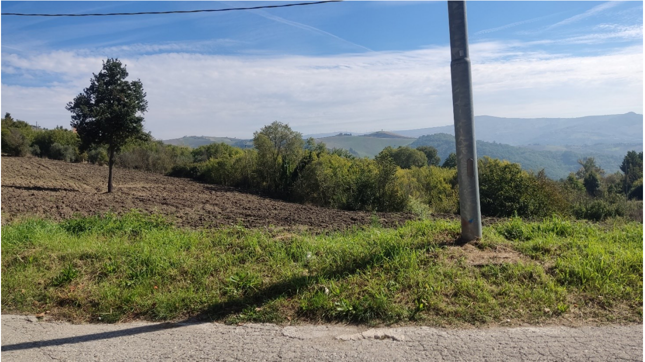
Punto di presa n° 9 - Stato di Fatto