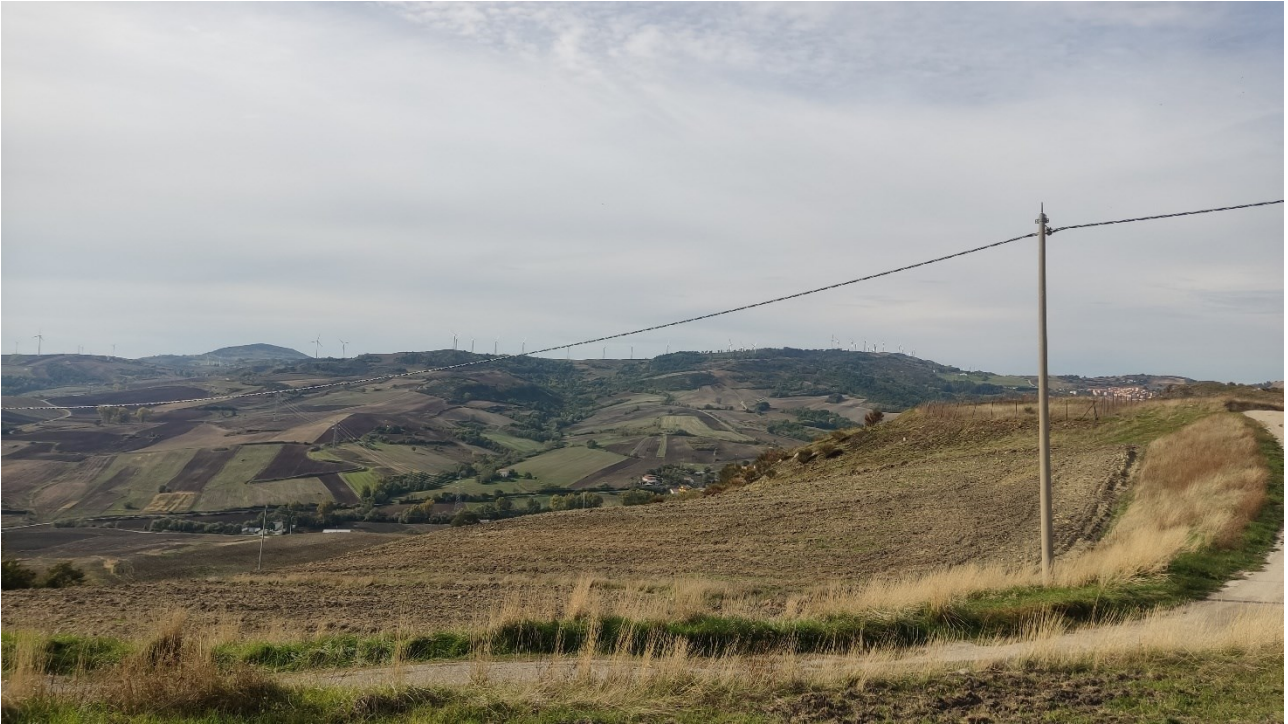
Punto di presa n° 19 - Stato di Fatto