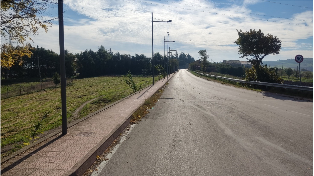
Punto di presa n° 17 - Stato di Fatto