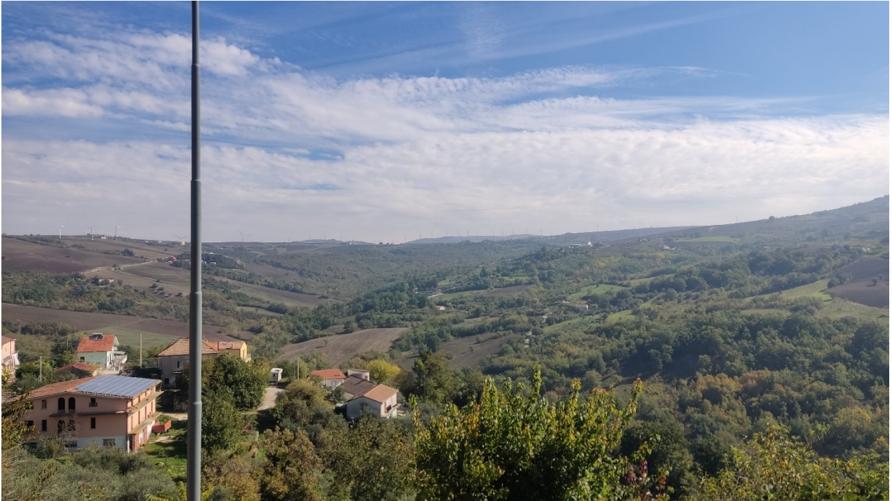
Punto di presa n° 37 - Stato di Fatto