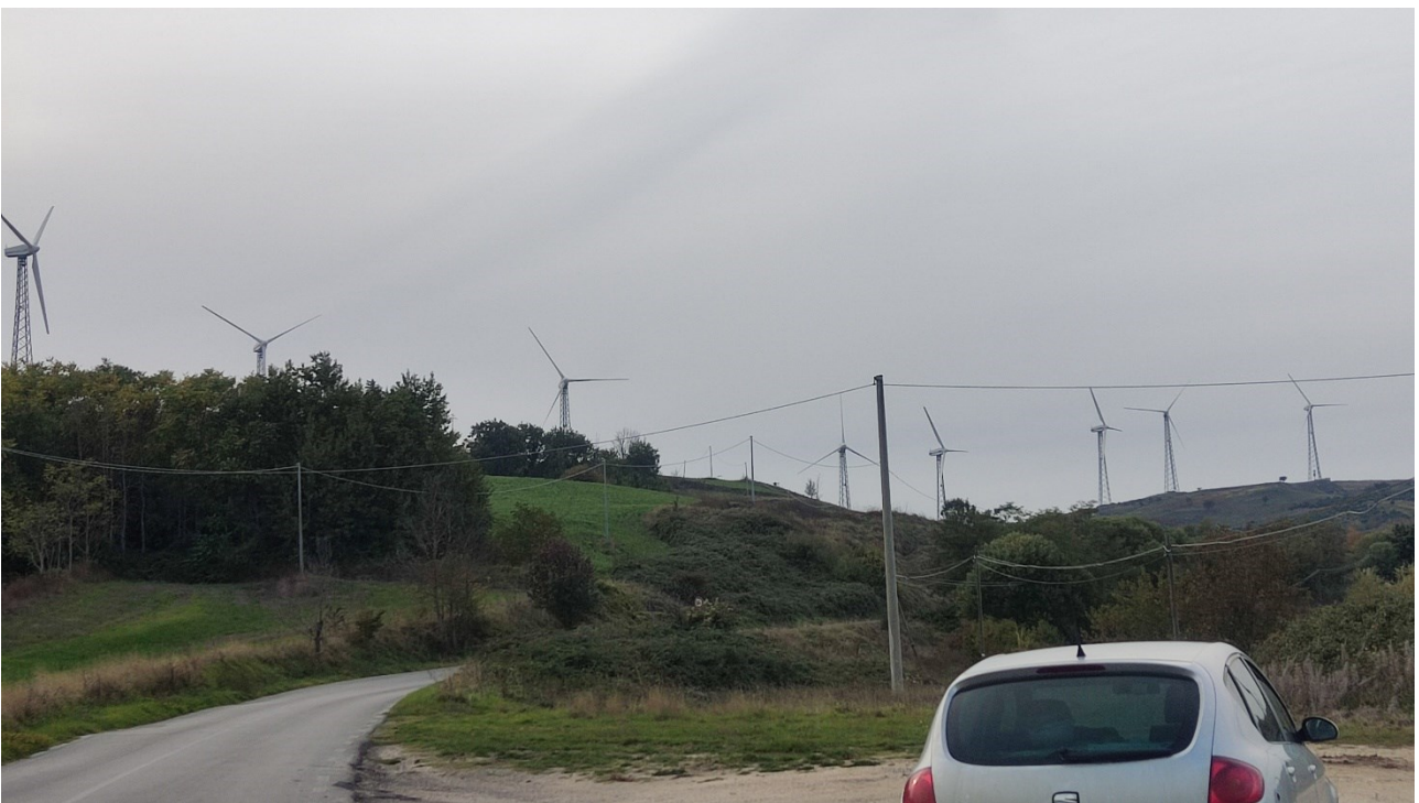
Punto di presa n° 14 - Stato di Fatto