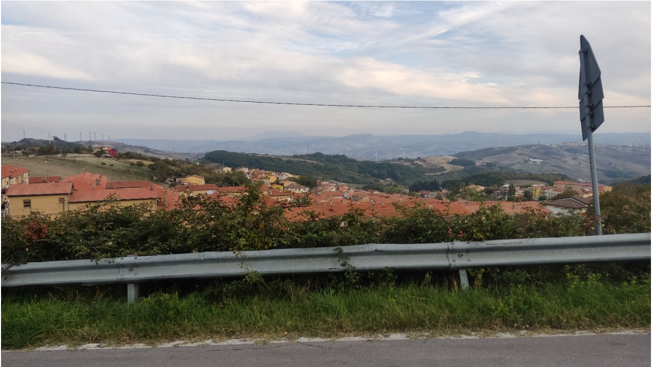
Punto di presa n° 15 - Stato di Fatto