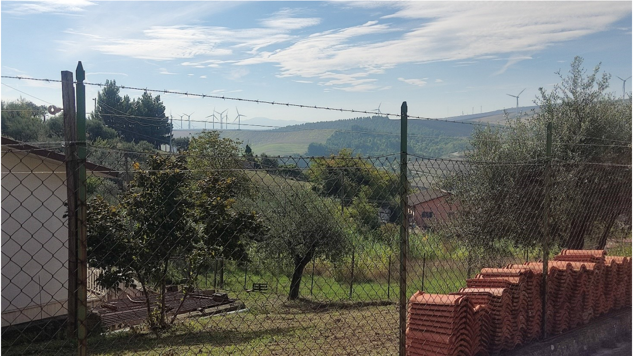
Punto di presa n° 3 - Stato di Fatto