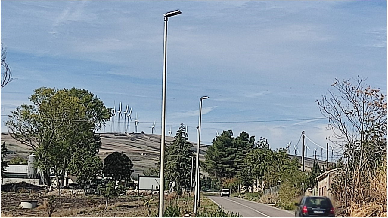
Punto di presa n° 29 - Stato di Fatto