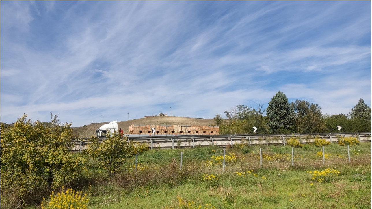
Punto di presa n° 39 - Stato di Fatto