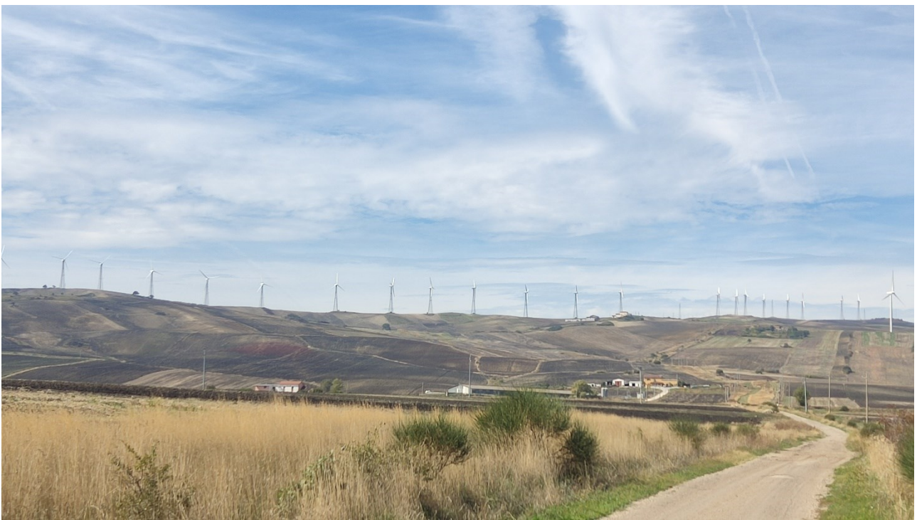
Punto di presa n°30 - Stato di Fatto