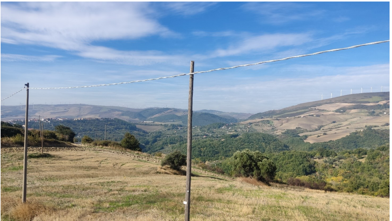
Punto di presa n° 34 - Stato di Fatto