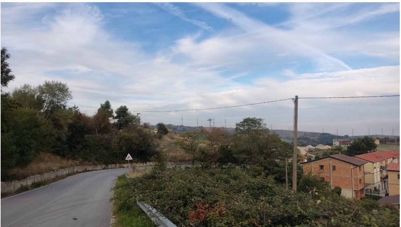
Punto di presa n° 16 - Stato di Fatto