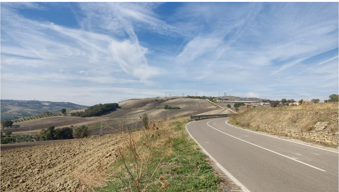
Punto di presa n° 40 - Stato di Fatto