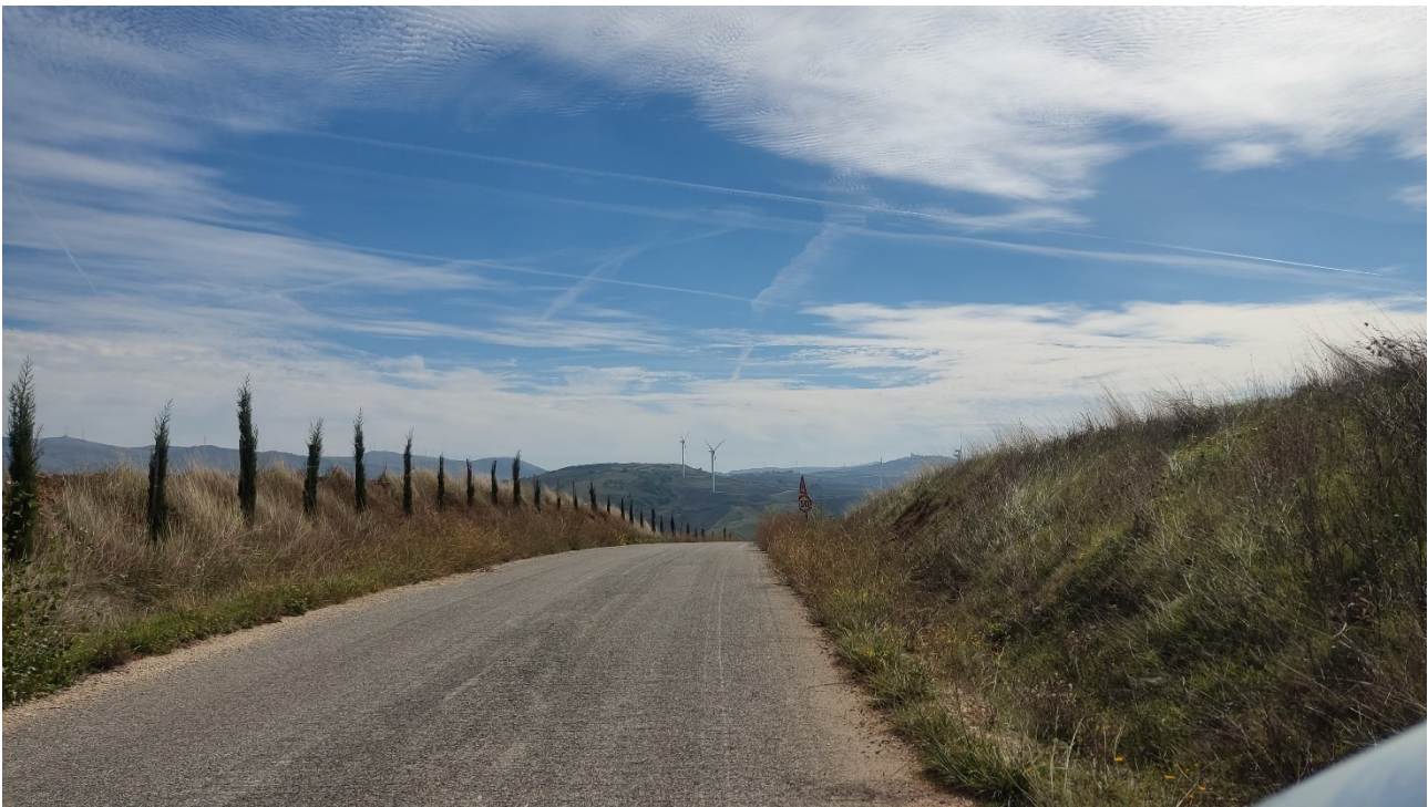
Punto di presa n° 12 - Stato di Fatto