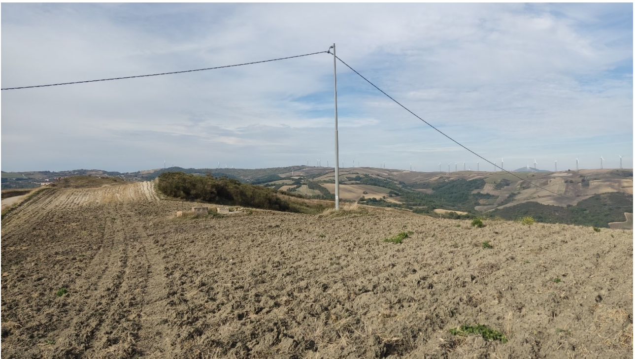
Punto di presa n° 18 - Stato di Fatto