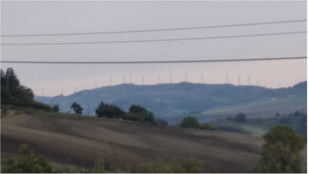
Punto di presa n° 27 - Stato di Fatto