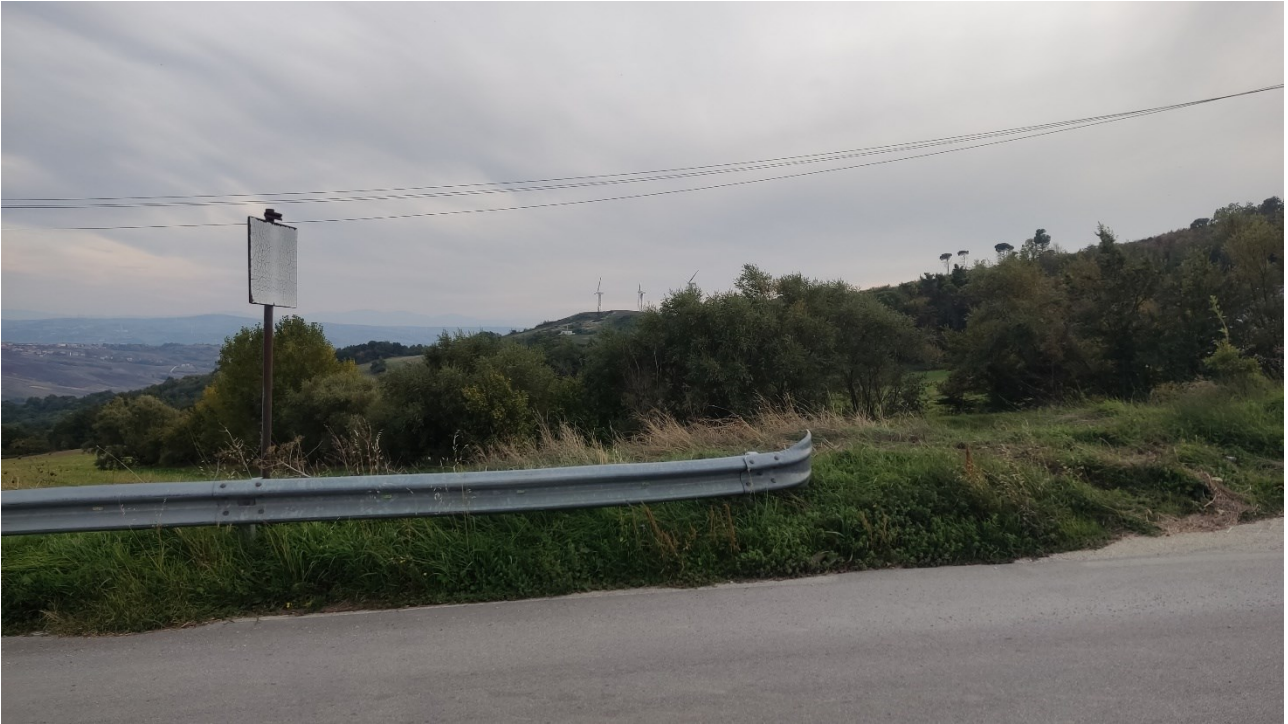
Punto di presa n° 13 - Stato di Fatto