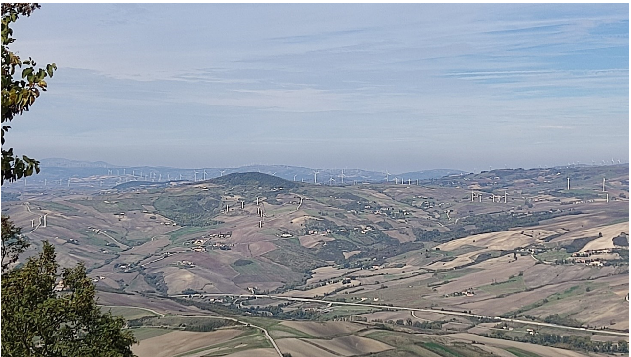
Punto di presa n° 6 - Stato di Fatto