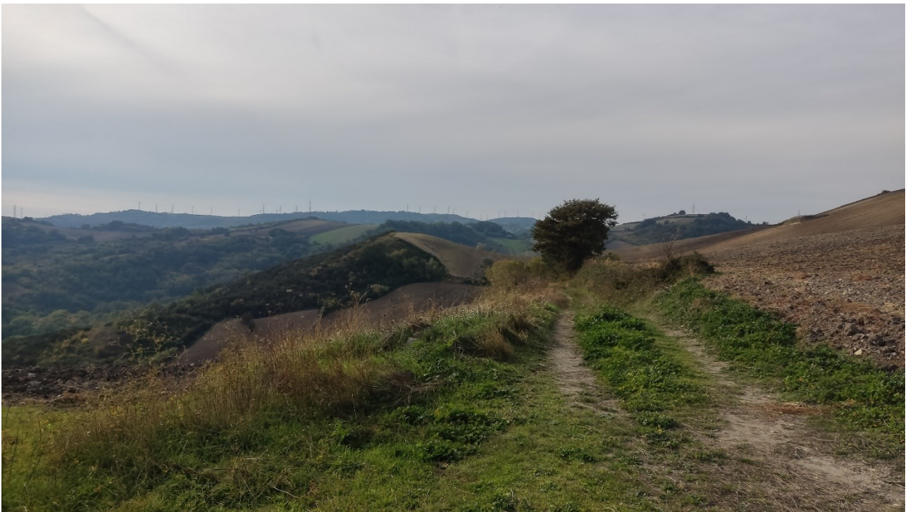
Punto di presa n° 24- Stato di Fatto