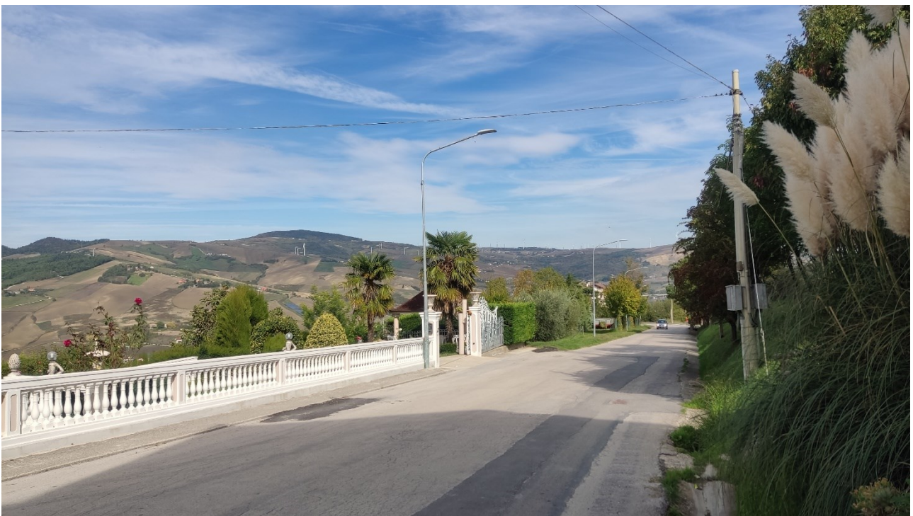
Punto di presa n° 8 - Stato di Fatto