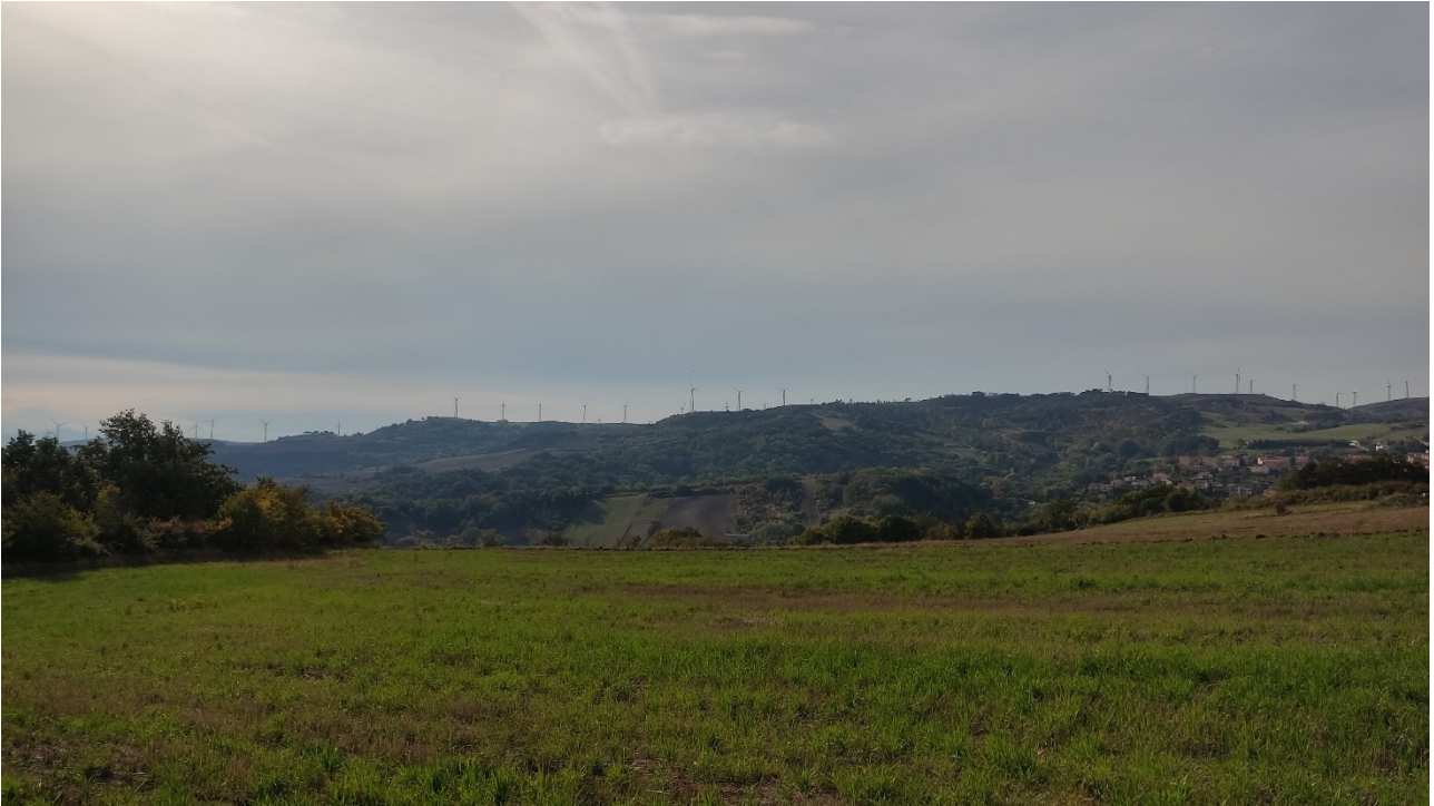
Punto di presa n° 21 - Stato di Fatto