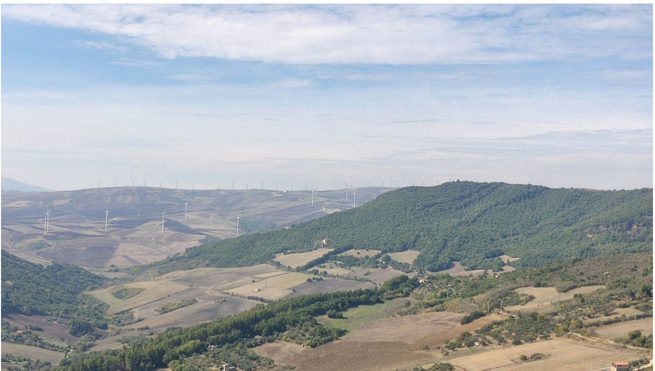
Punto di presa n° 4 - Stato di Fatto