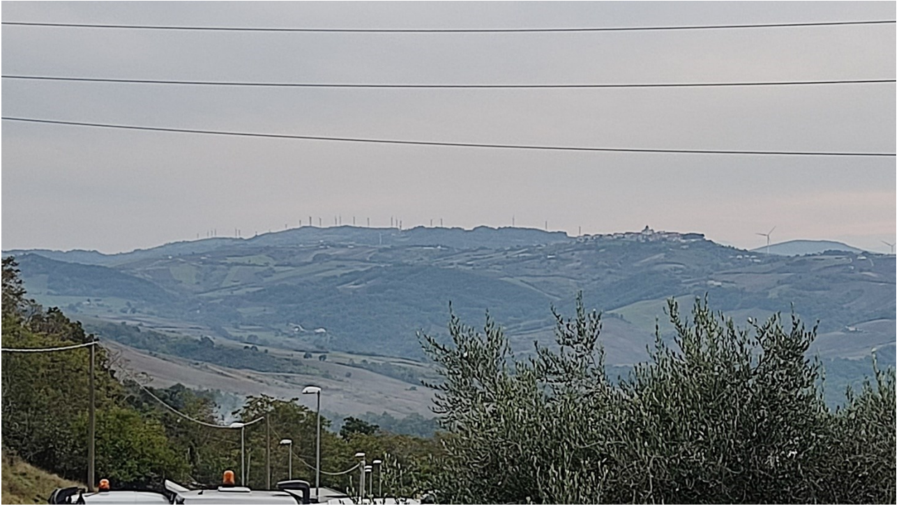
Punto di presa n° 1 - Stato di Fatto