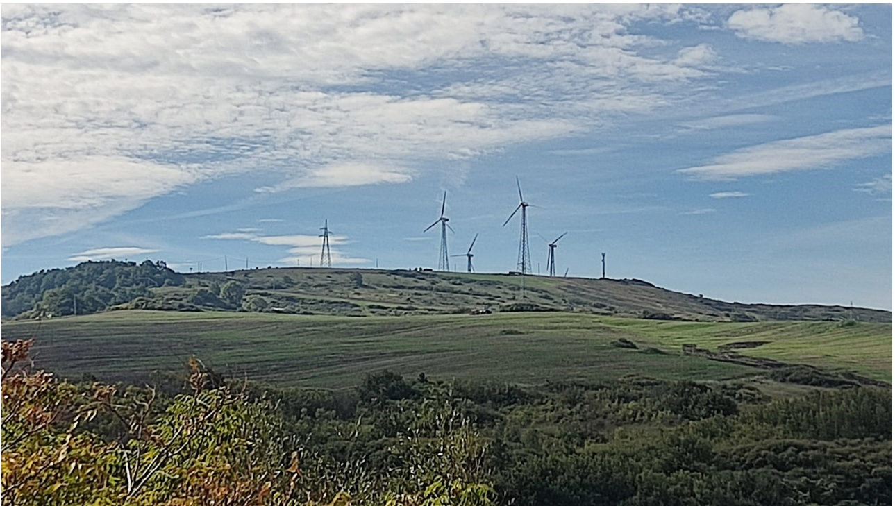
Punto di presa n° 2 - Stato di Fatto