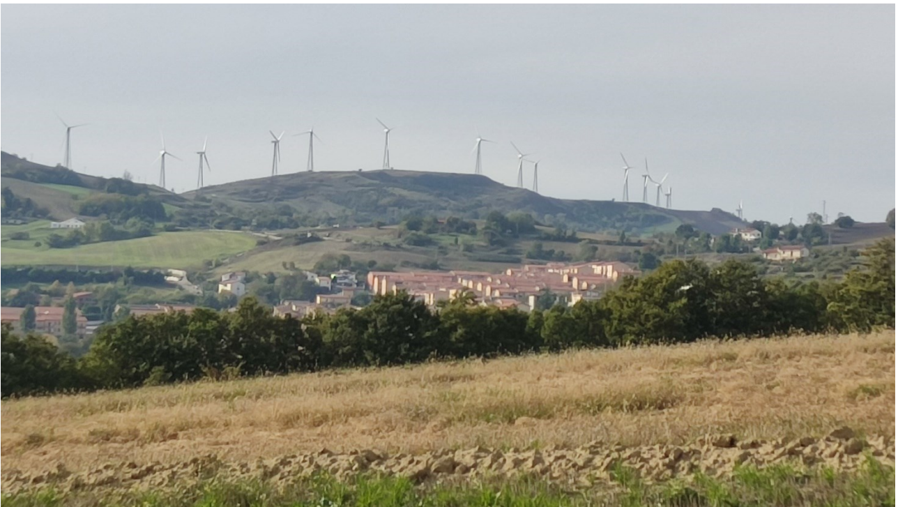
Punto di presa n° 20 - Stato di Fatto