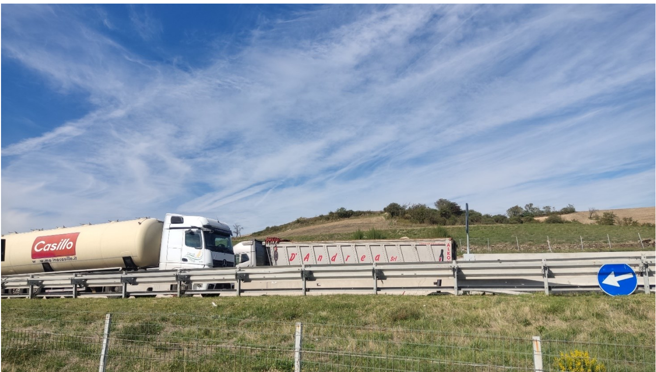
Punto di presa n° 43 - Stato di Fatto