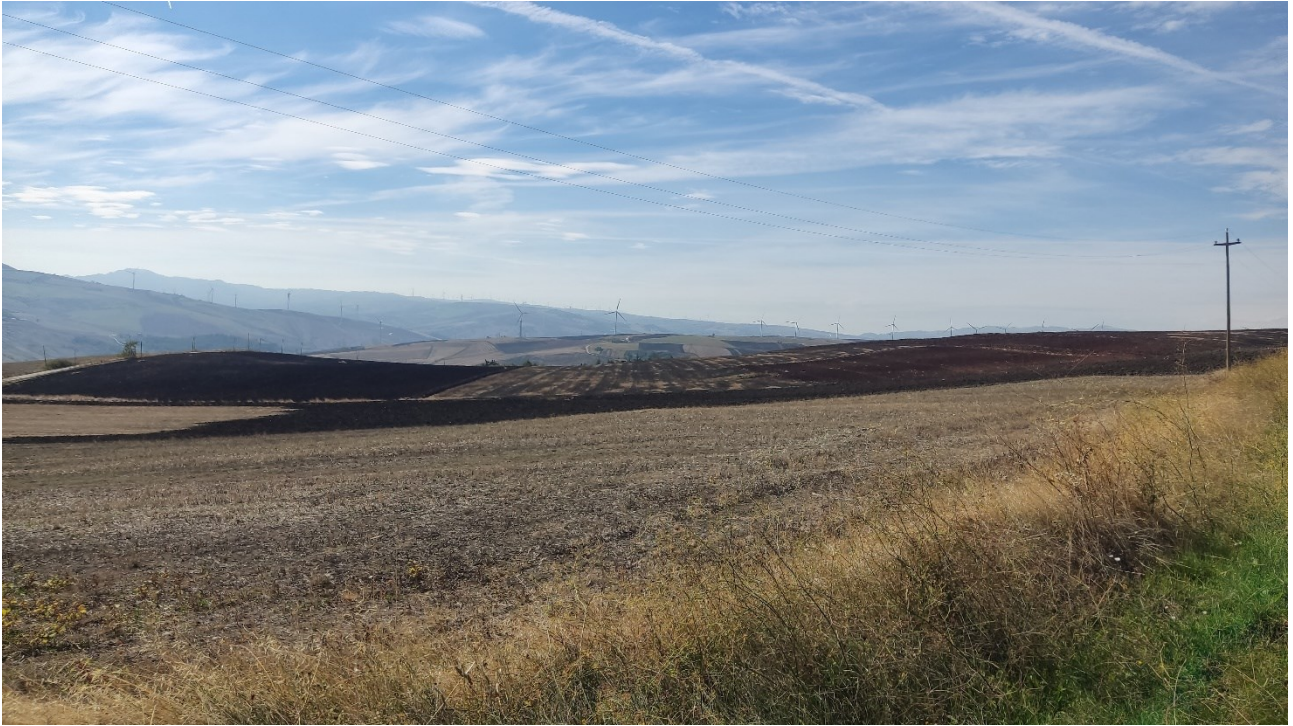
Punto di presa n° 33 - Stato di Fatto