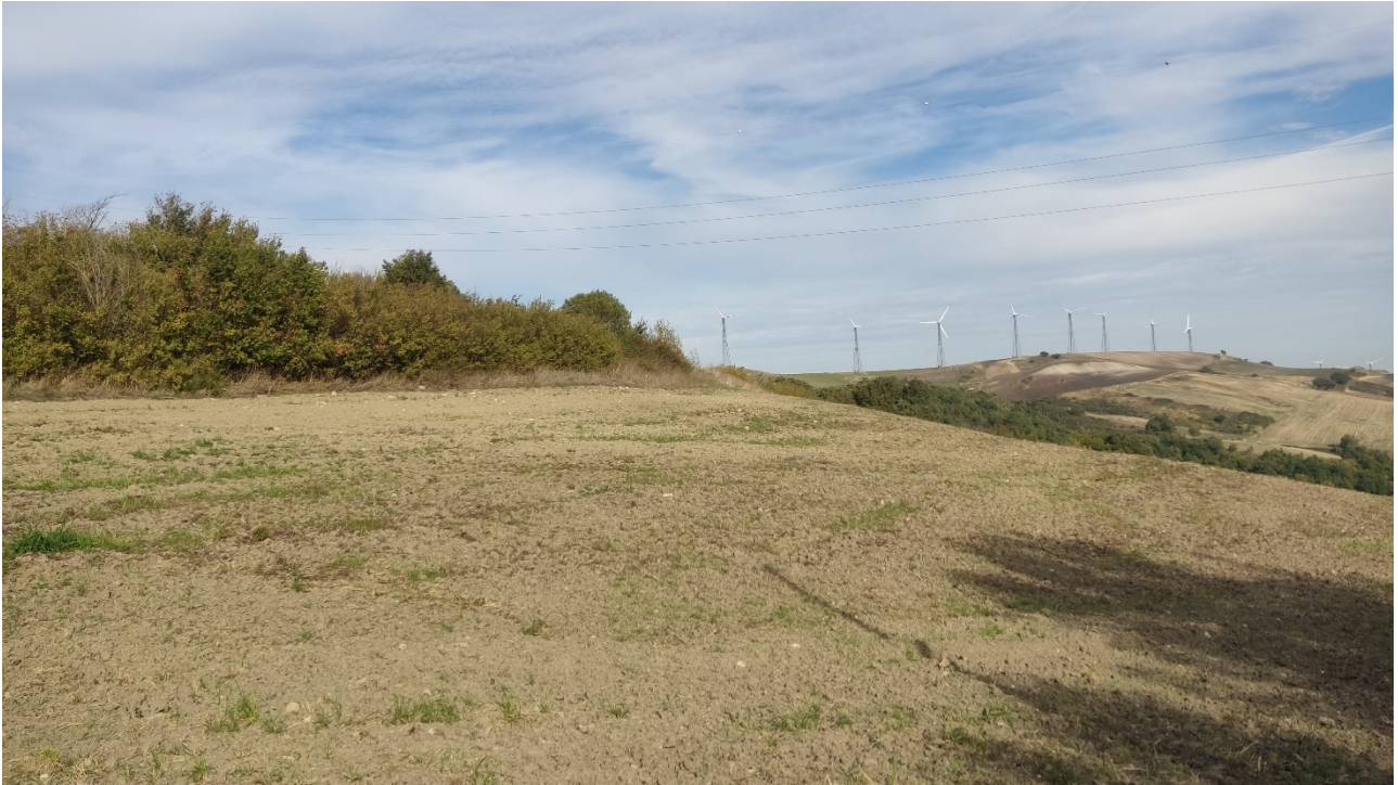
Punto di presa n° 23 - Stato di Fatto