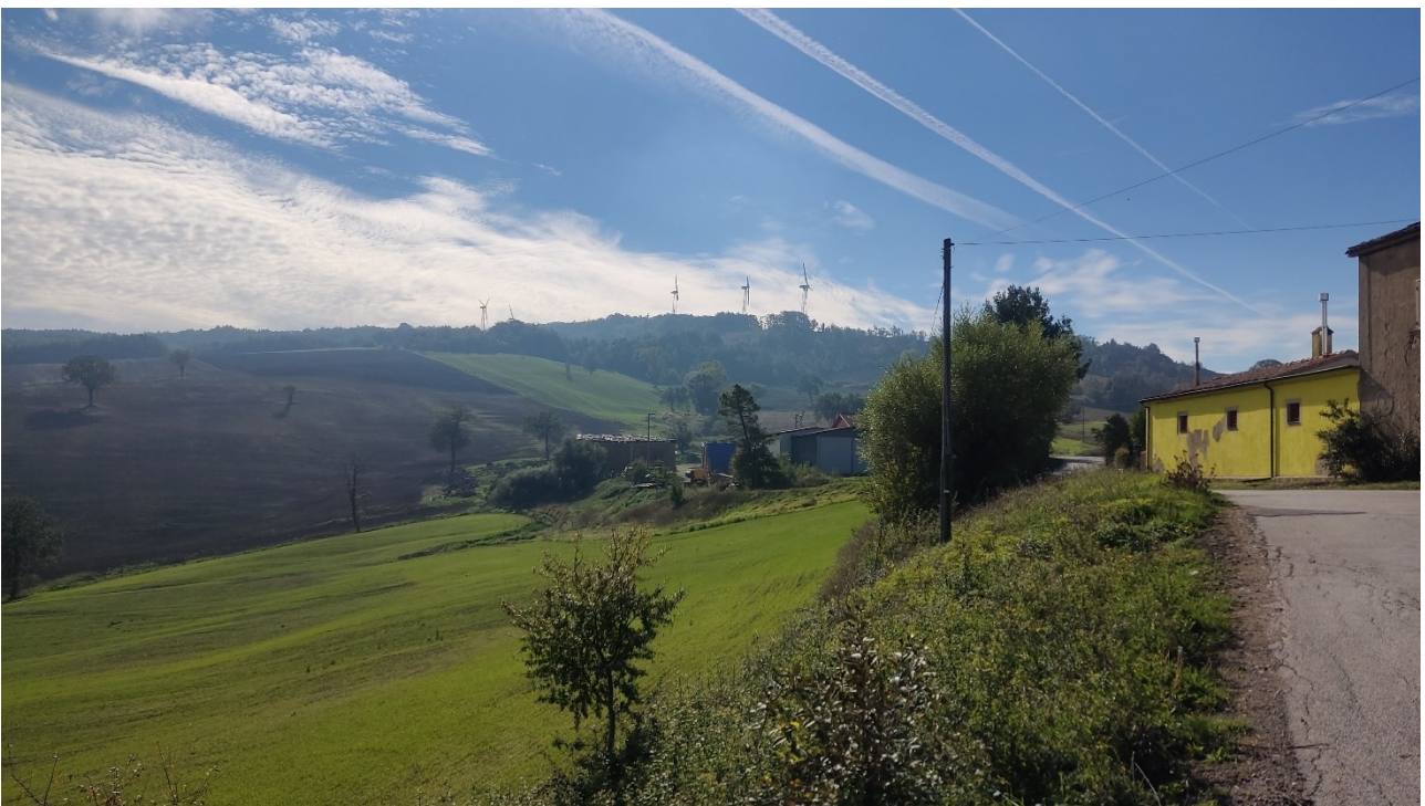
Punto di presa n° 26 - Stato di Fatto