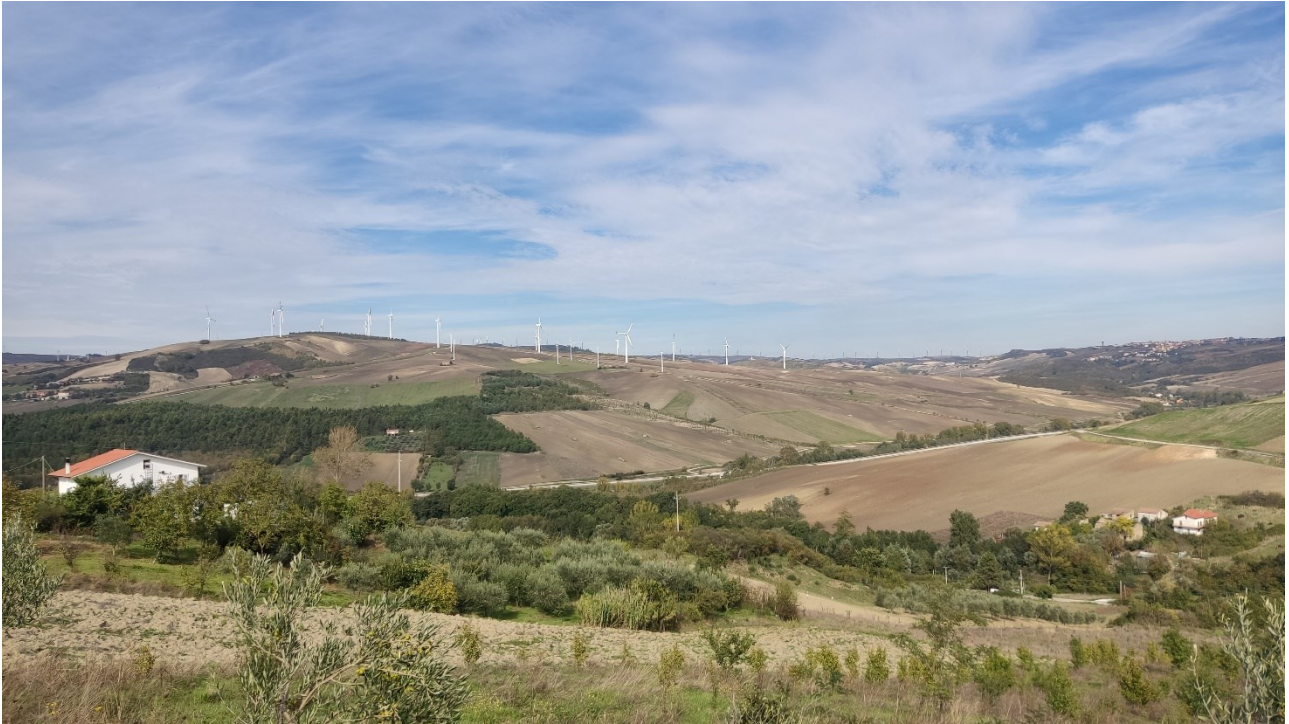
Punto di presa n° 7 - Stato di Fatto