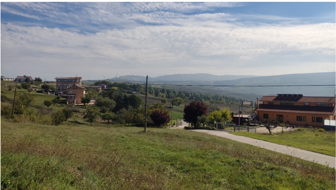
Punto di presa n° 10 - Stato di Fatto