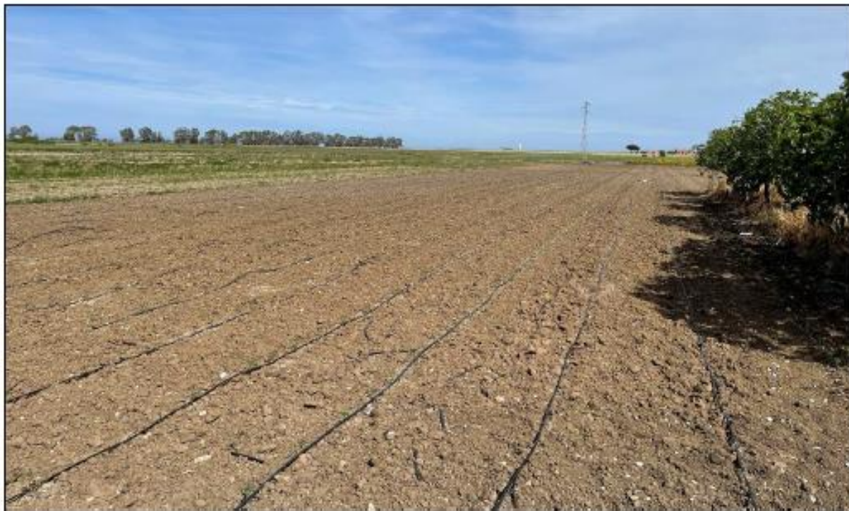
Figura 1: Vista panoramica del campo 9-10