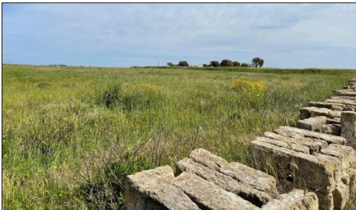
Figura 1: Vista panoramica del campo 8