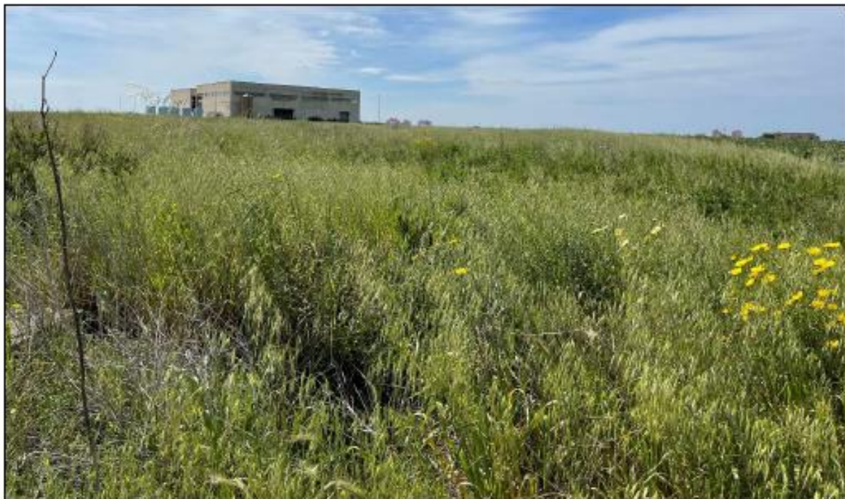
Figura 1: Vista panoramica del campo 1