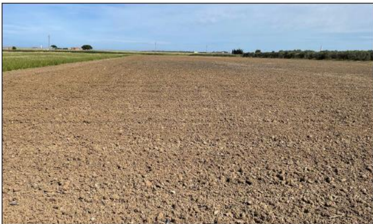
Figura 1: Vista panoramica del campo 12