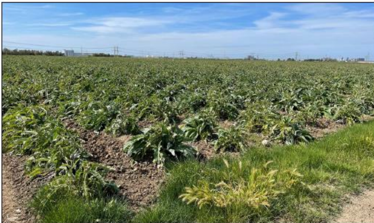
Figura 1: Vista panoramica del campo 5