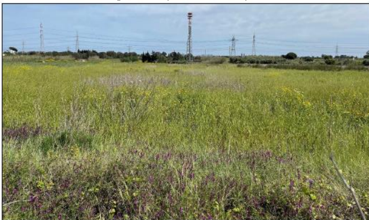
Figura 1: Vista panoramica del campo 2