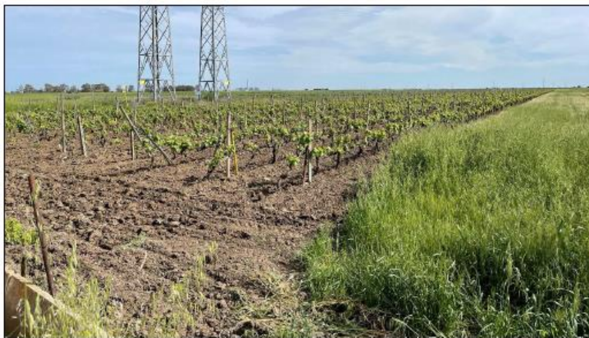
Figura 1: Vista panoramica del campo 6