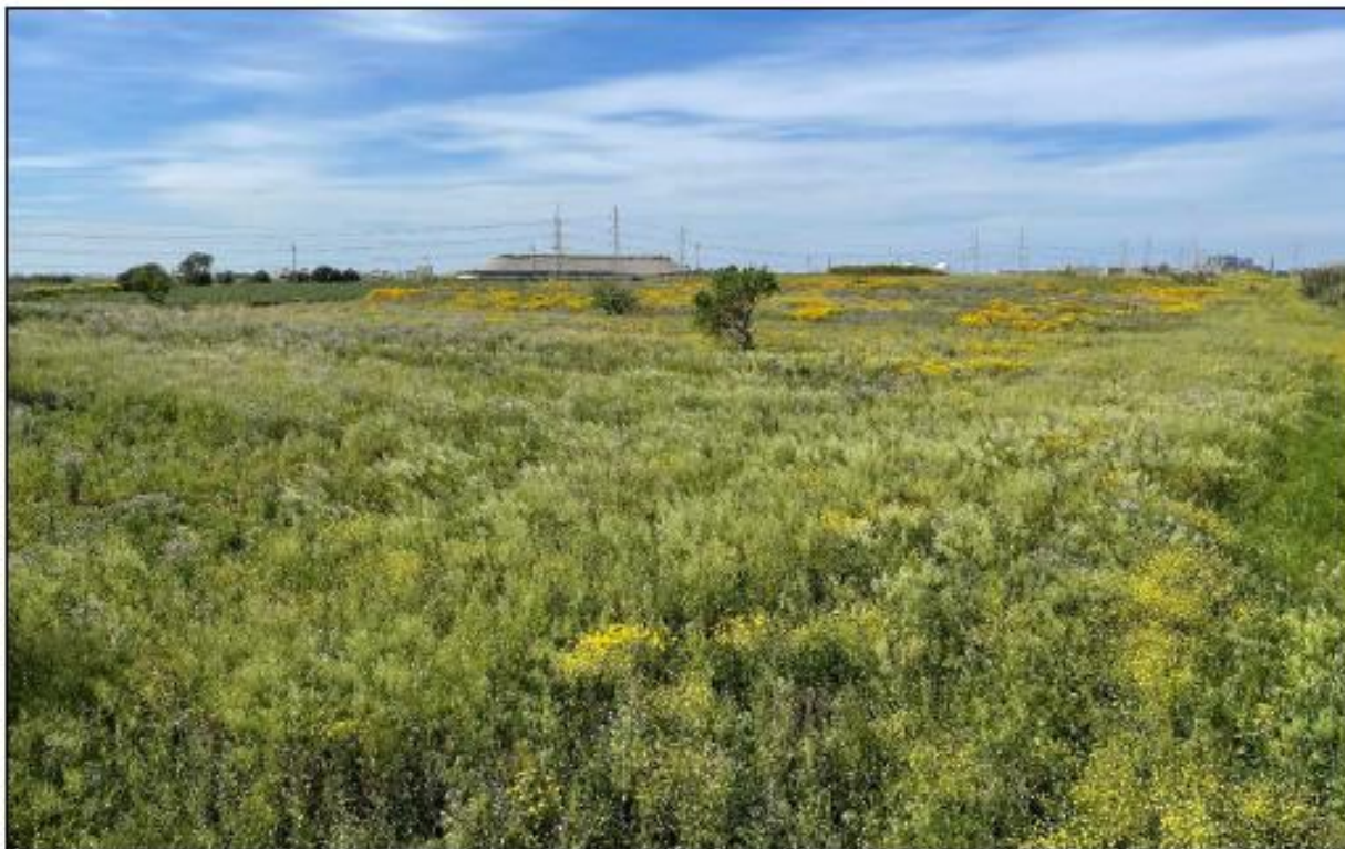
Figura 1: Vista panoramica del campo 3