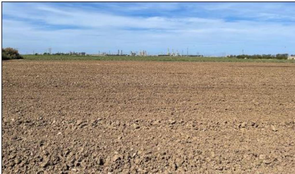
Figura 1: Vista panoramica del campo 7