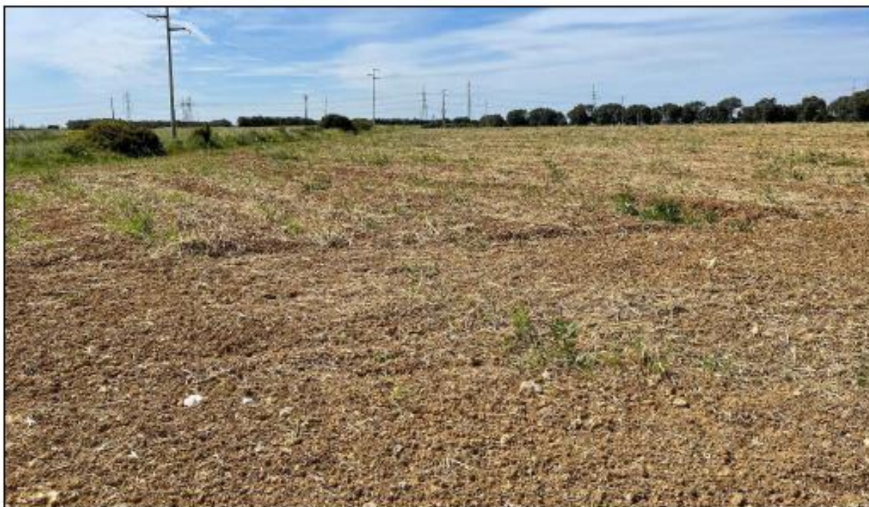
Figura 1: Vista panoramica del campo 4