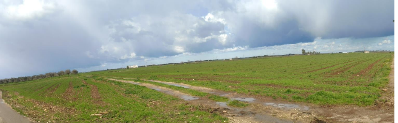
Figura 3-2: Terreno interessato dall'impianto