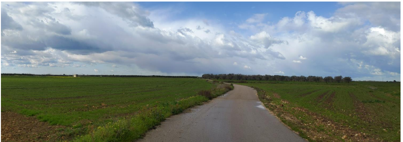
Figura 3-1: Viabilità locale di accesso all'impianto

Nello specifico sulle aree tra le strutture di sostegno dei pannelli fotovoltaici sarà piantumato un prato permanente polifita di leguminose adatto alle caratteristiche pedoclimatiche della superficie di progetto.