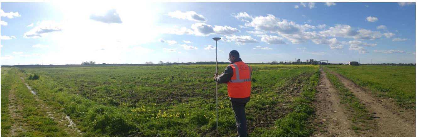
Figura 3-4: Terreno interessato dall'impianto