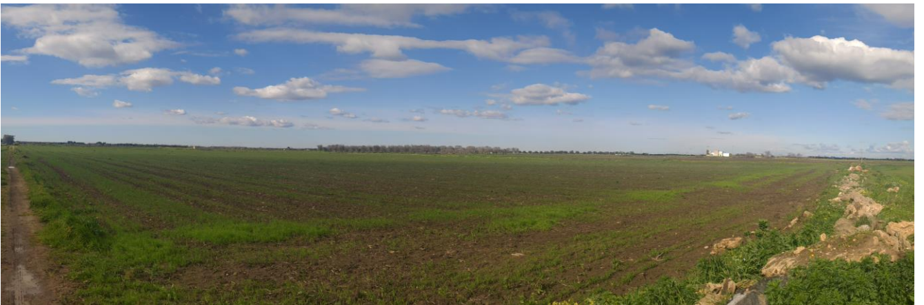
Figura 3-3: Terreno interessato dall'impianto