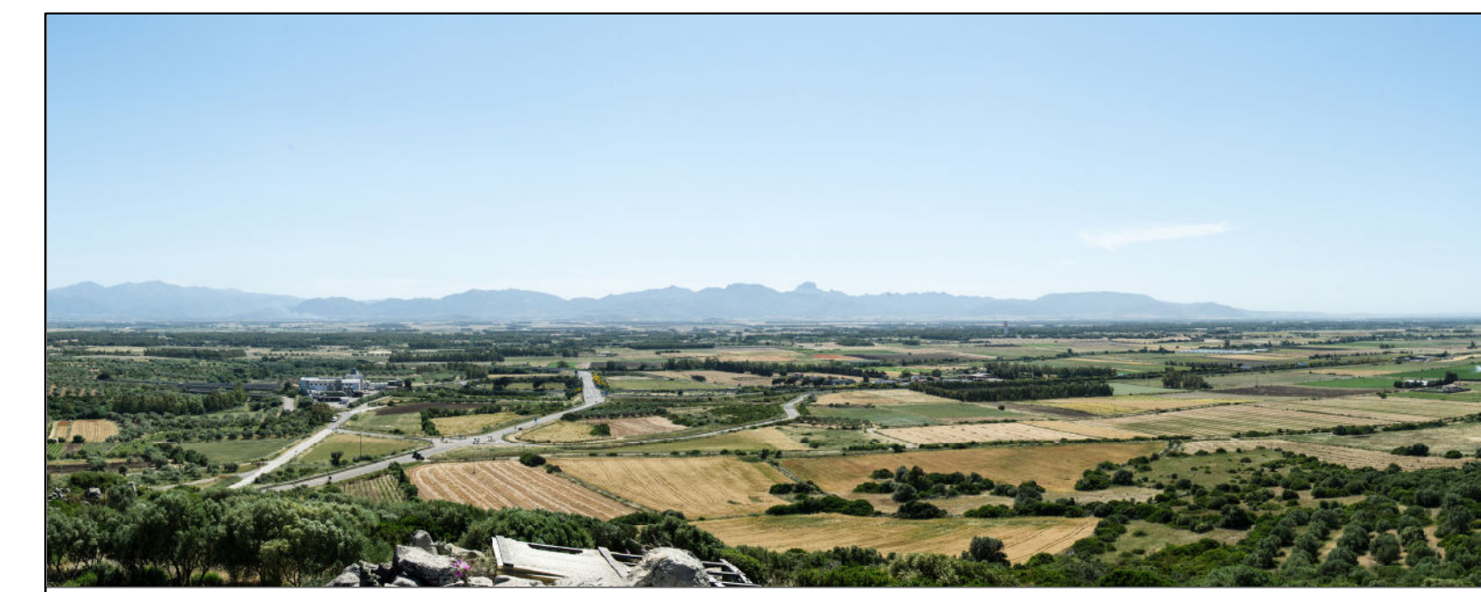
IMPIANTI AGROVOLTAICI S'Arrideli e Narbonis COMUNE DI URAS