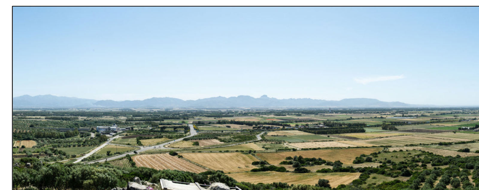
Rafforzamento connessione Uras-Arcidano COMUNI DI URAS E SAN NICOLO' D'ARCIDANO