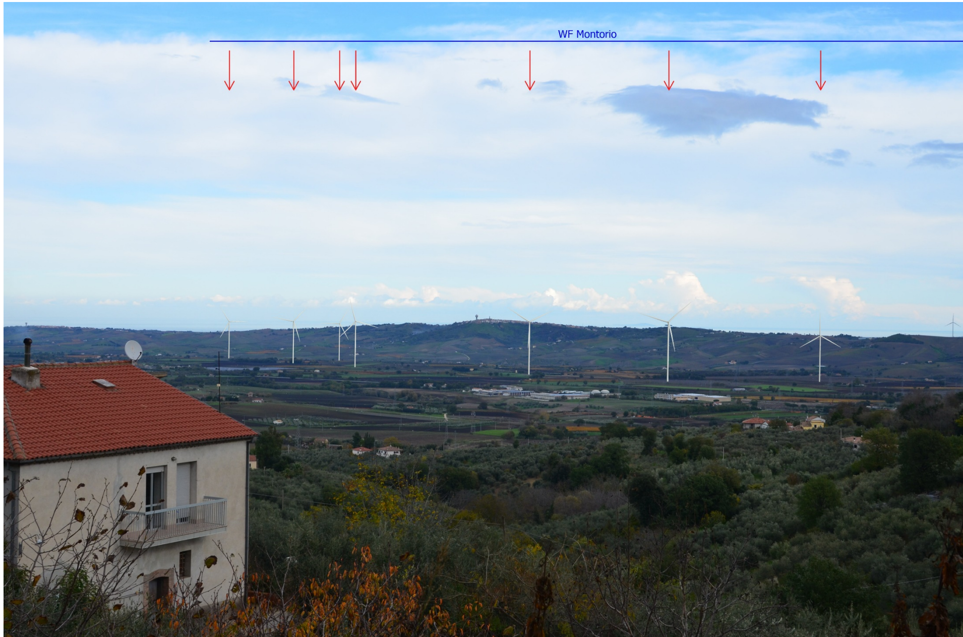
Foto 1b: Punto di ripresa fotografica (P1) 41.812156° 14.923839° (strada di accesso al Comune di Larino) - vista panoramica area d'impianto – POST OPERAM