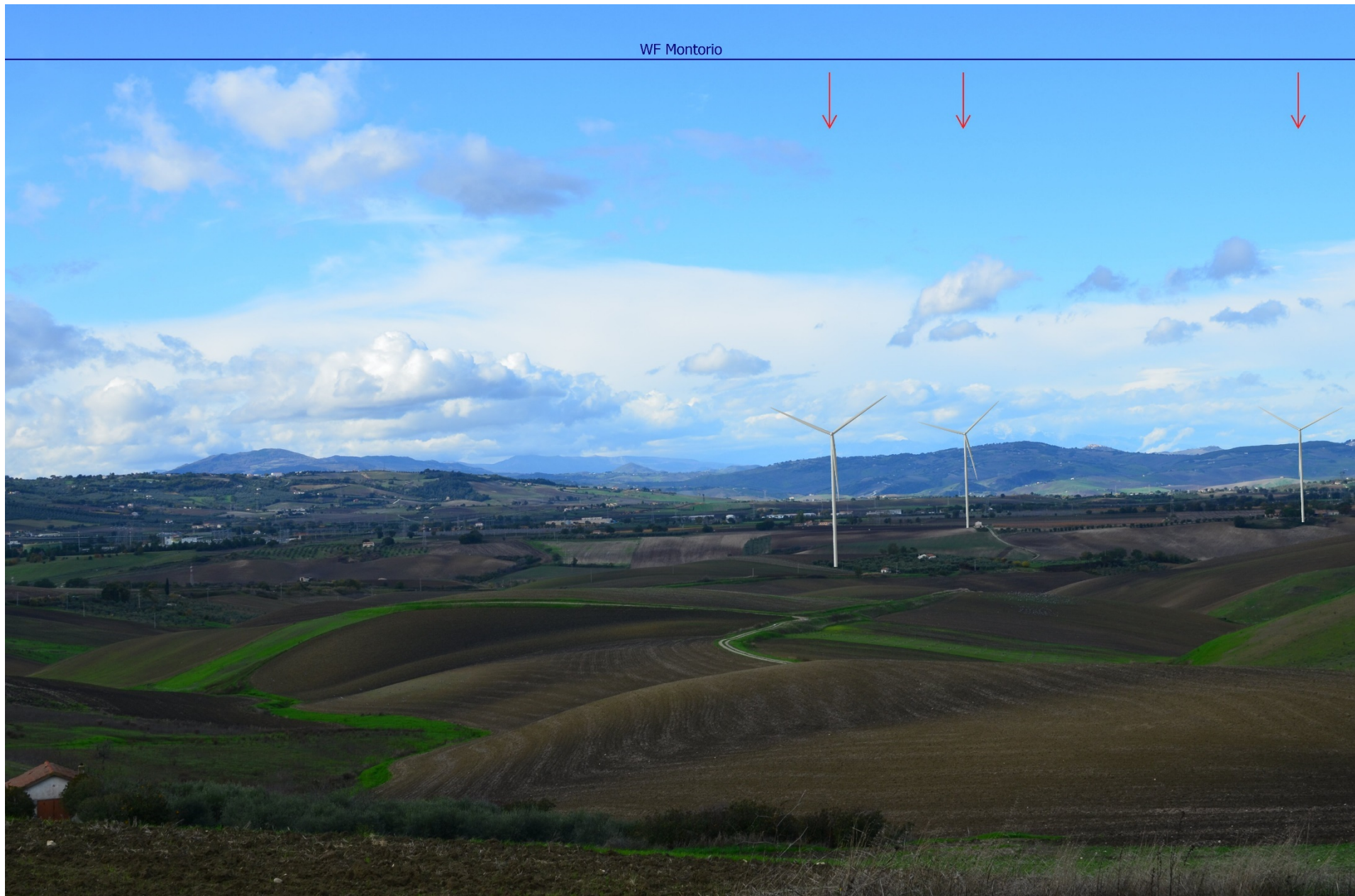
Foto 7b: Punto di ripresa fotografica (P2) 41.819645° 15.002383° (strada di accesso al Comune di Ururi) - vista panoramica area d'impianto – POST OPERAM