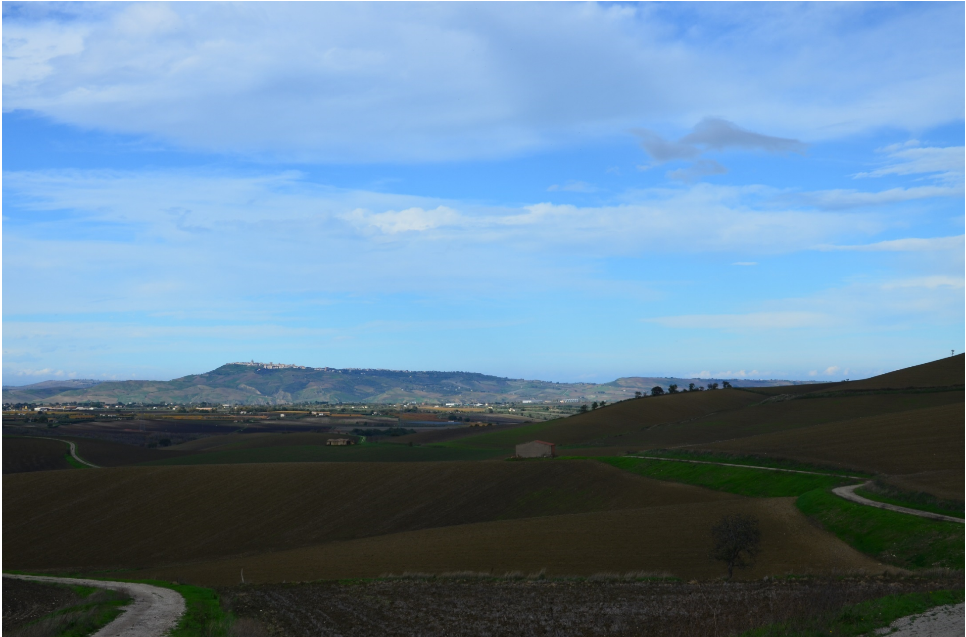
Foto 5a: Punto di ripresa fotografica (P2) 41.819645° 15.002383° (strada di accesso al Comune di Ururi) - vista panoramica area d'impianto – ANTE OPERAM