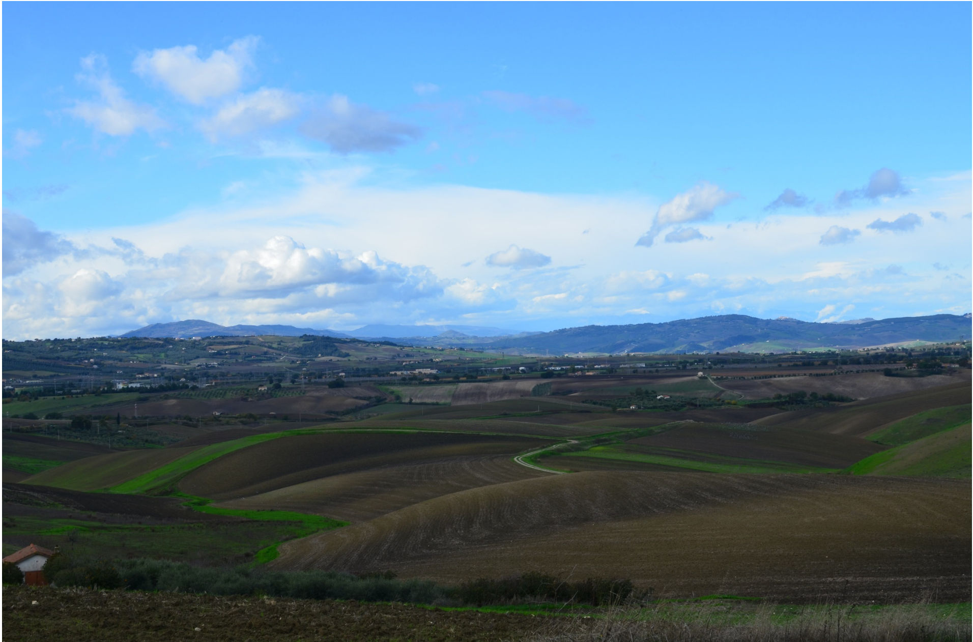
Foto 7a: Punto di ripresa fotografica (P2) 41.819645° 15.002383° (strada di accesso al Comune di Ururi) - vista panoramica area d'impianto – ANTE OPERAM