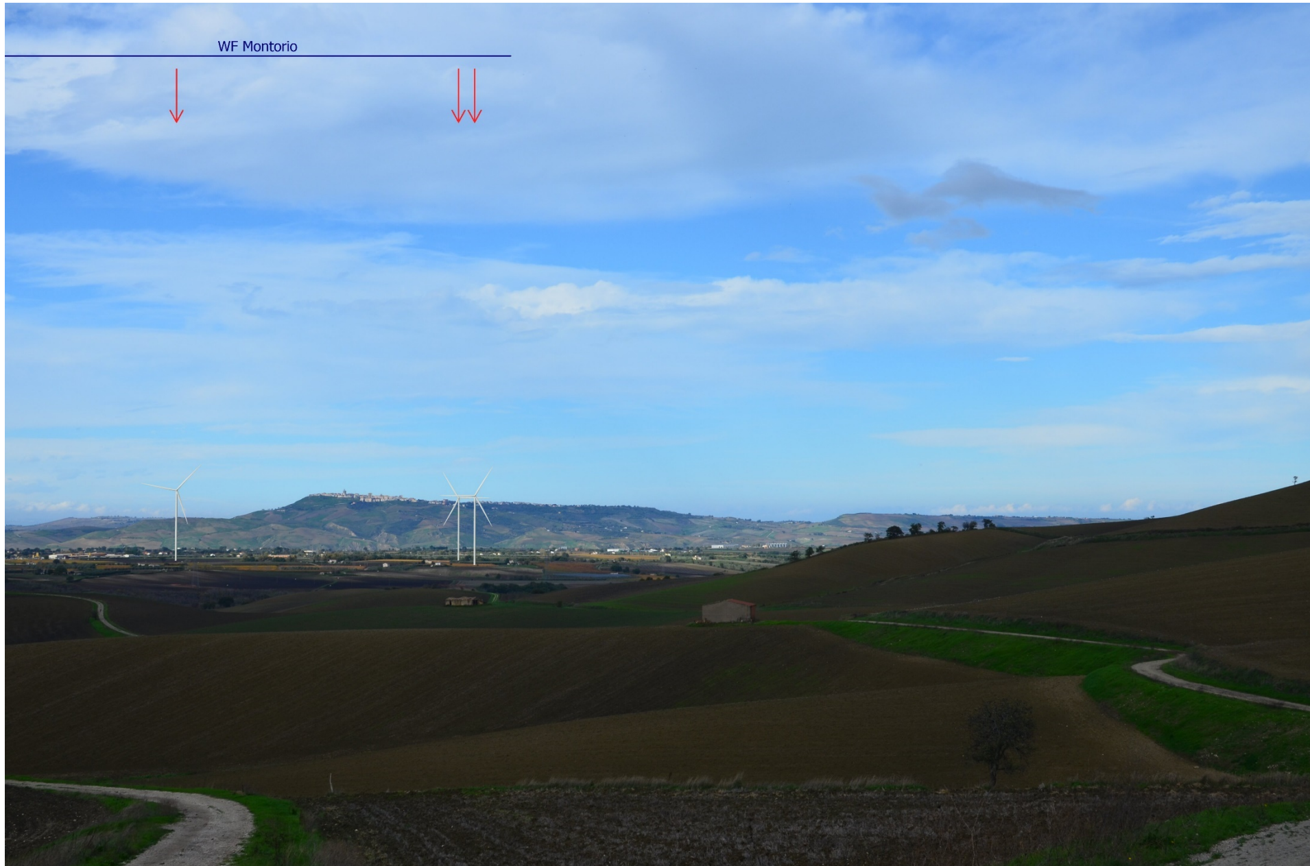
Foto 5b: Punto di ripresa fotografica 41.819645° 15.002383° (strada di accesso al Comune di Ururi) – Vista panoramica del Comune di Larino – POST OPERAM