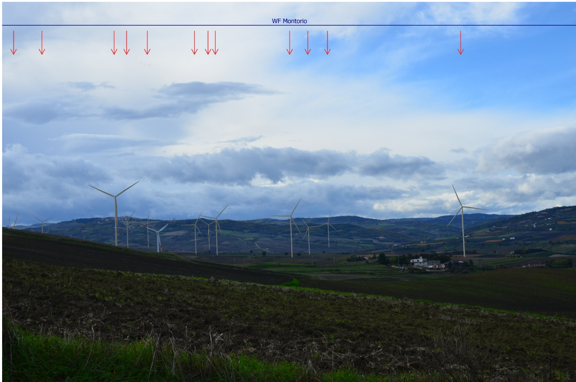
Foto 8b: Punto di ripresa fotografica (P2) 41.819645° 15.002383° (strada di accesso al Comune di Ururi) - vista panoramica area d'impianto – POST OPERAM