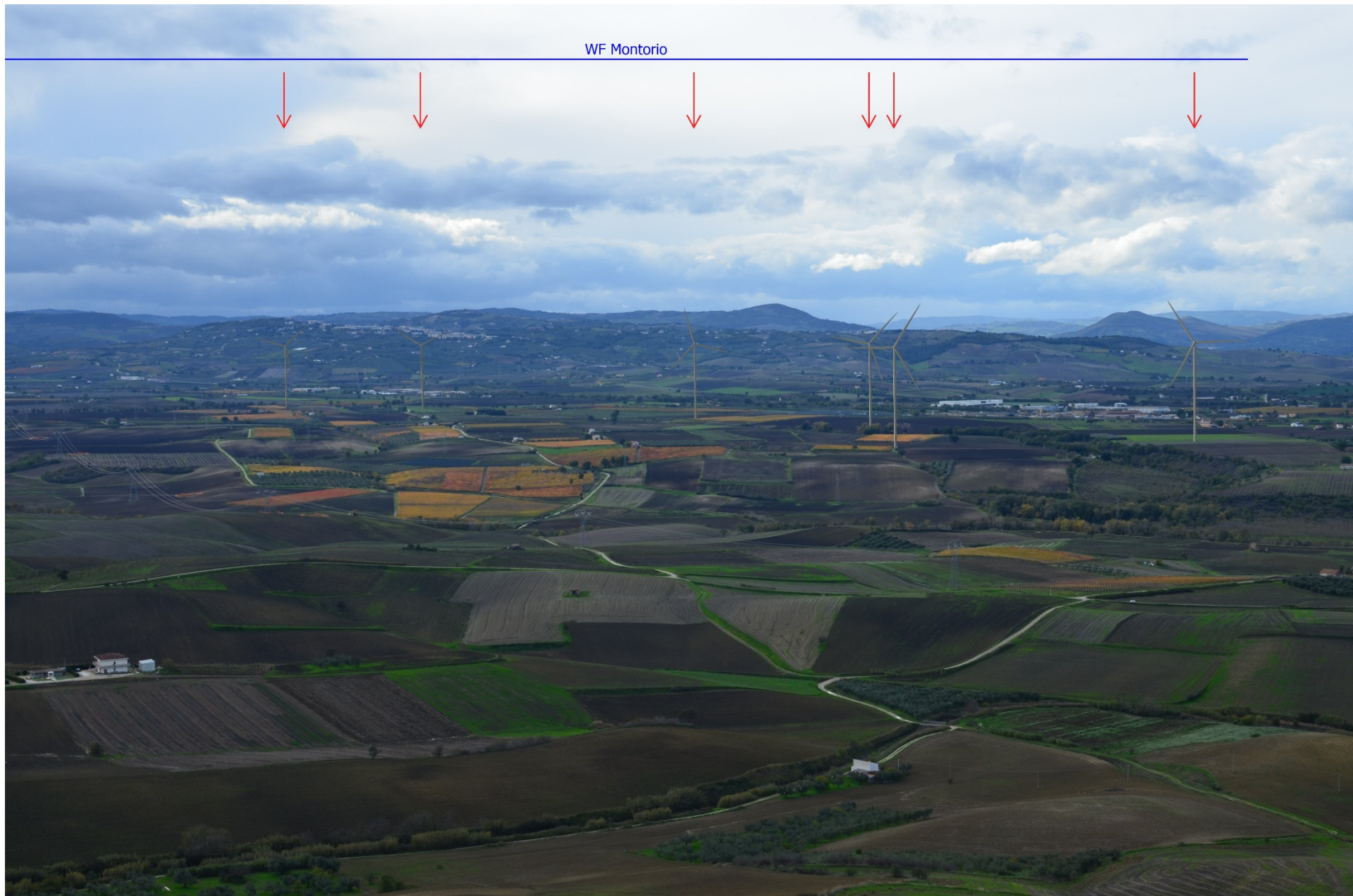
Foto 10b: Punto di ripresa fotografica (P3) 41.869084° 15.008437° (Belvedere Comune di San Martino in Pensilis) - vista panoramica area d'impianto – POST OPERAM