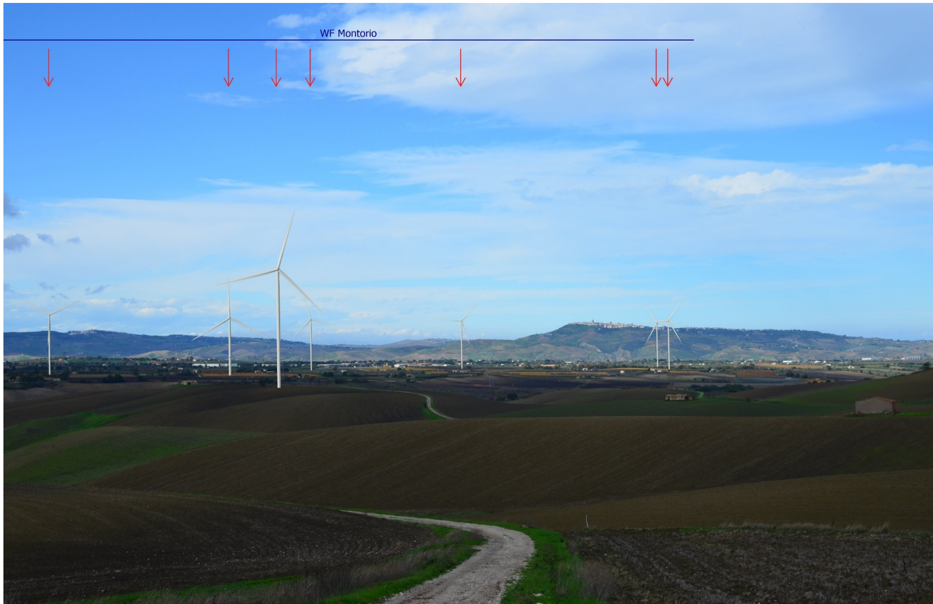
Foto 6b: Punto di ripresa fotografica (P2) 41.819645° 15.002383° (strada di accesso al Comune di Ururi) -vista panoramica dei Comuni di Larino e Montorio nei Frentani – POST OPERAM