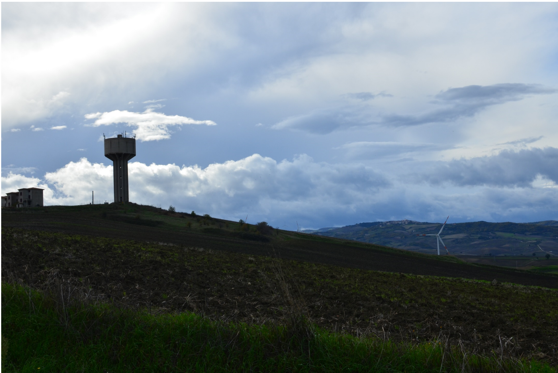
Foto 9a: Punto di ripresa fotografica (P2) 41.819645° 15.002383° (strada di accesso al Comune di Ururi) - vista panoramica area d'impianto – ANTE OPERAM