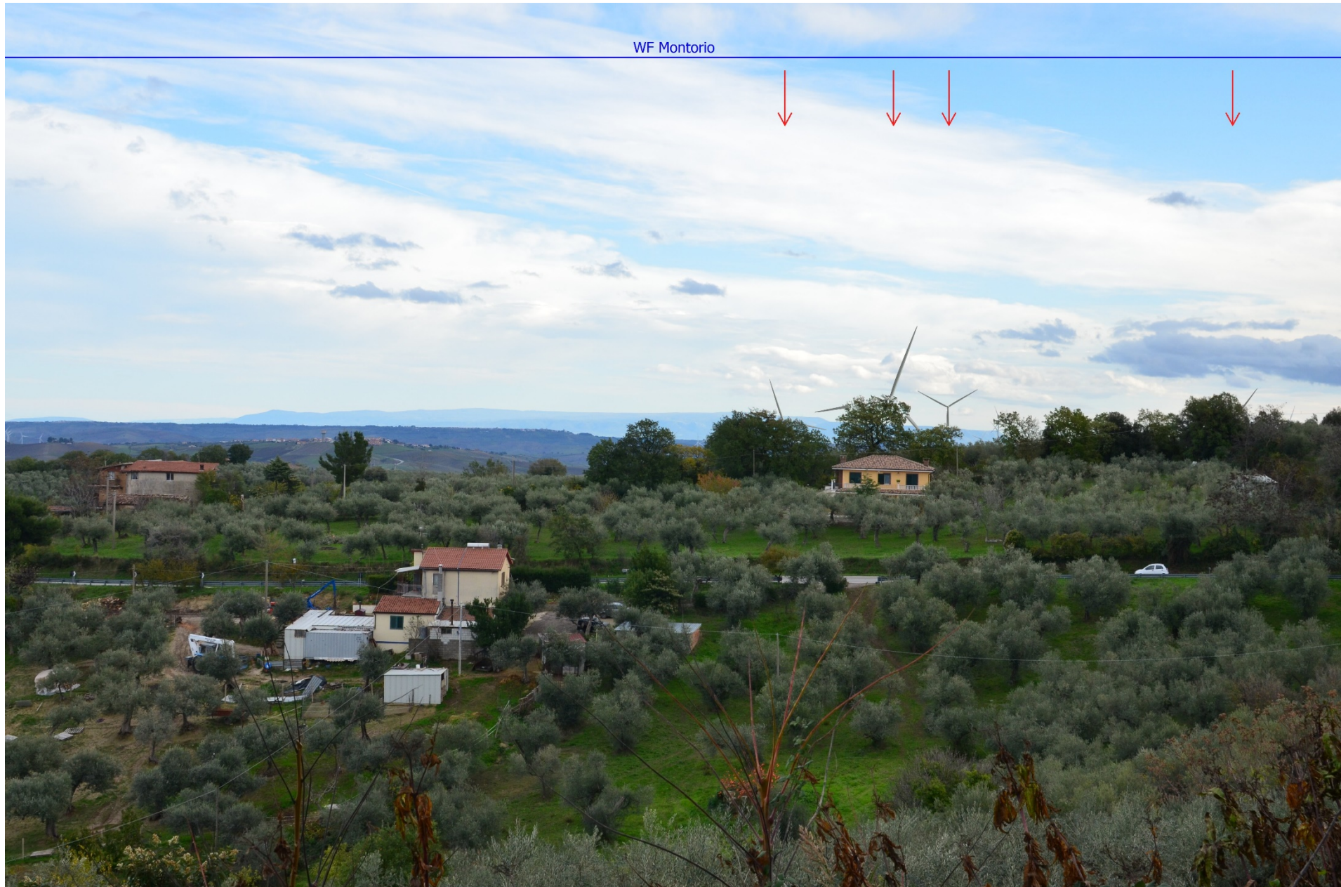
Foto 4b: Punto di ripresa fotografica (P1) 41.812156° 14.923839° (strada di accesso al Comune di Larino) - vista panoramica area d'impianto – POST OPERAM