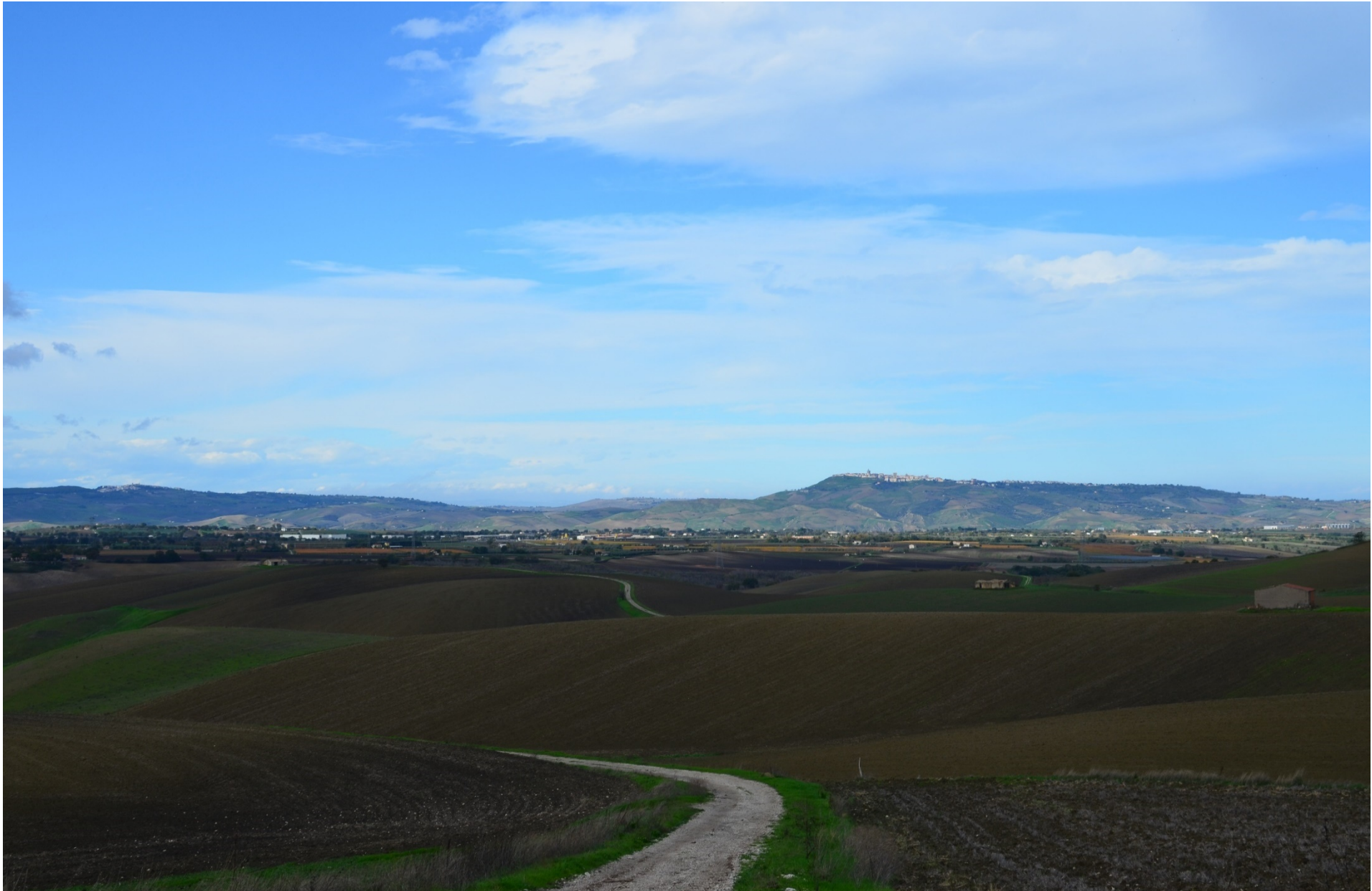
Foto 6a: Punto di ripresa fotografica (P2) 41.819645° 15.002383° (strada di accesso al Comune di Ururi) - Vista panoramica dei Comuni di Larino e Montorio nei Frentani – ANTE OPERAM