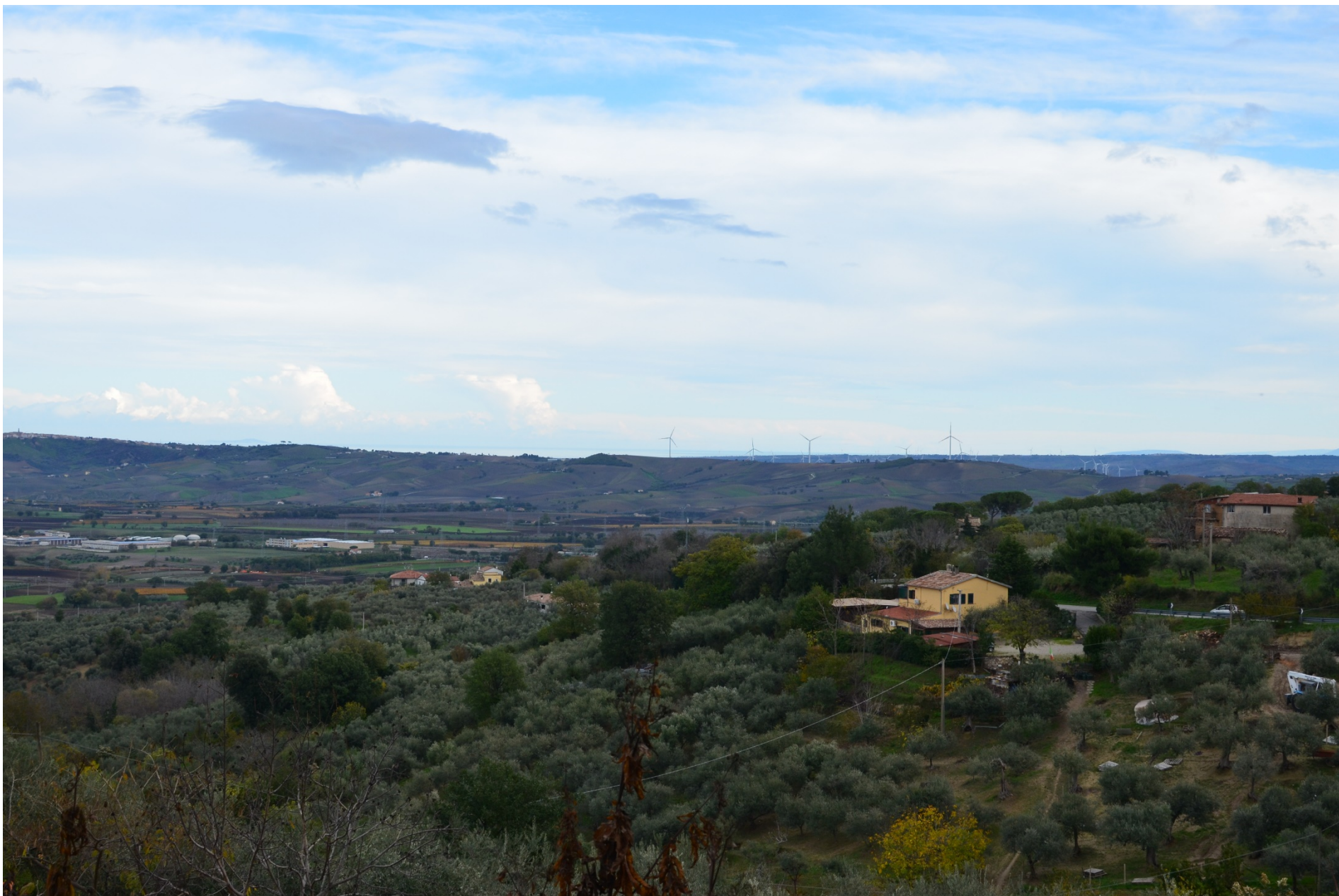
Foto 2a: Punto di ripresa fotografica (P1) 41.812156° 14.923839° (strada di accesso al Comune di Larino) - vista panoramica area d'impianto – ANTE OPERAM