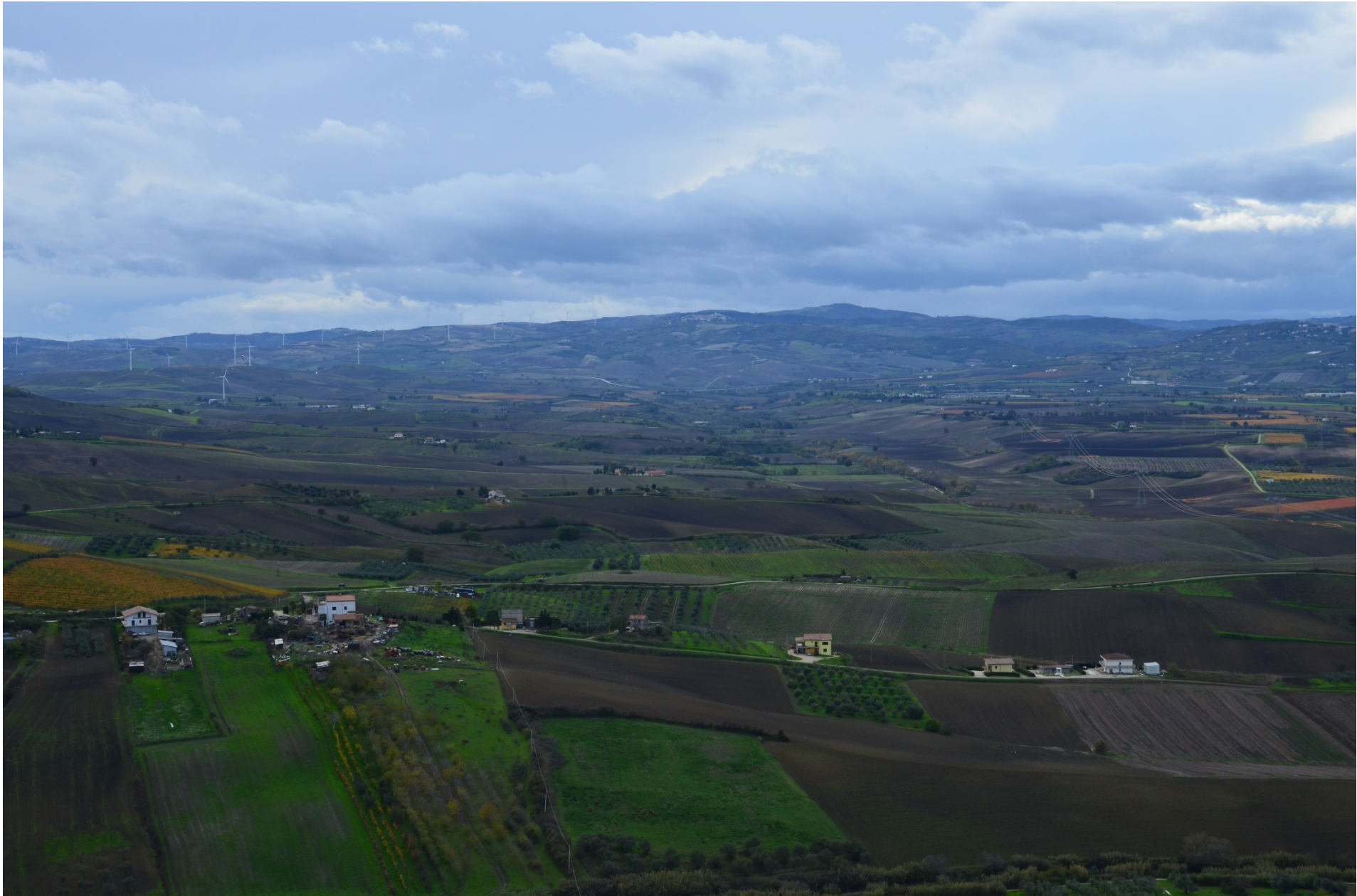
Foto 11a: Punto di ripresa fotografica (P3) 41.869084° 15.008437° (Belvedere Comune di San Martino in Pensilis) - vista panoramica area d'impianto – ANTE OPERAM