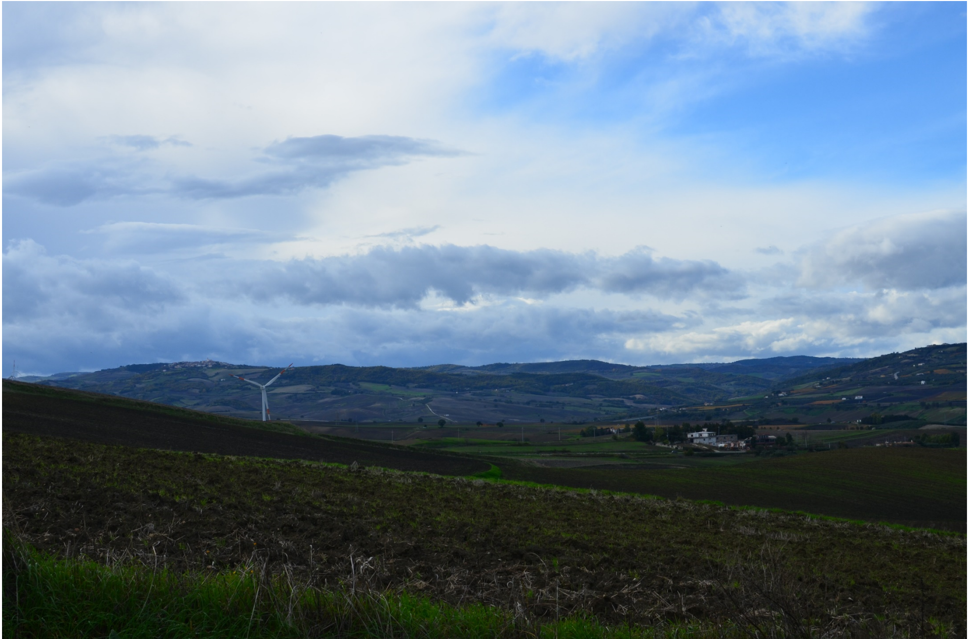
Foto 8a: Punto di ripresa fotografica (P2) 41.819645° 15.002383° (strada di accesso al Comune di Ururi) - vista panoramica area d'impianto – ANTE OPERAM