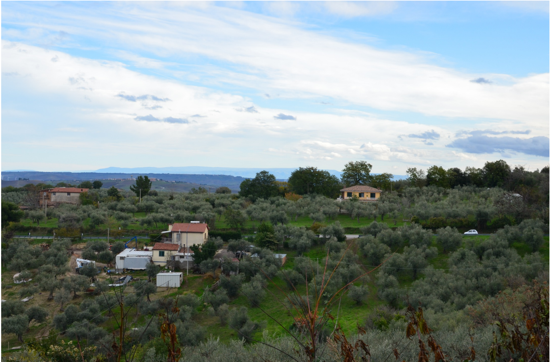
Foto 4a: Punto di ripresa fotografica (P1) 41.812156° 14.923839° (strada di accesso al Comune di Larino) - vista panoramica area d'impianto – ANTE OPERAM