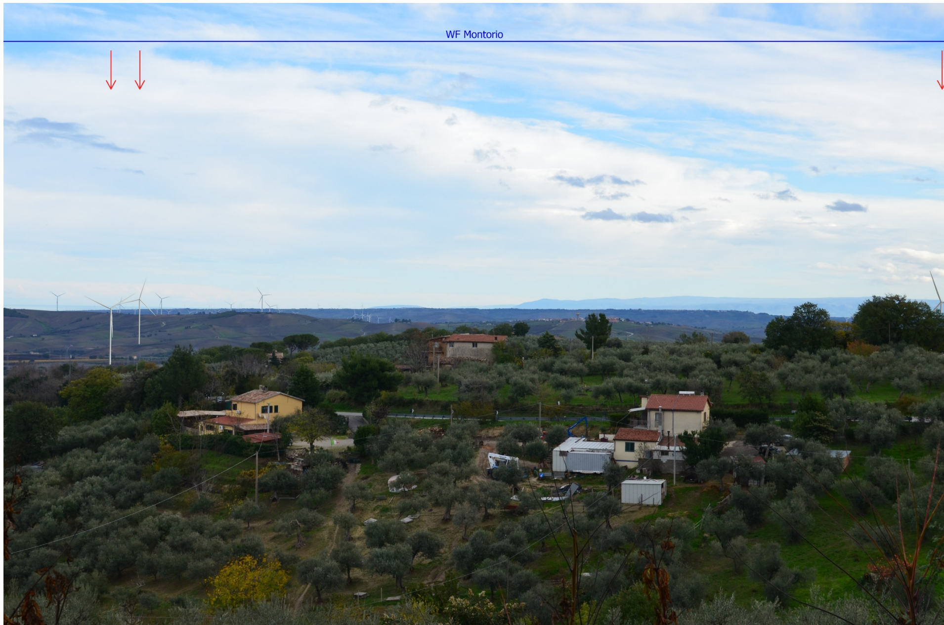
Foto 3b: Punto di ripresa fotografica (P1) 41.812156° 14.923839° (strada di accesso al Comune di Larino) - vista panoramica area d'impianto – POST OPERAM