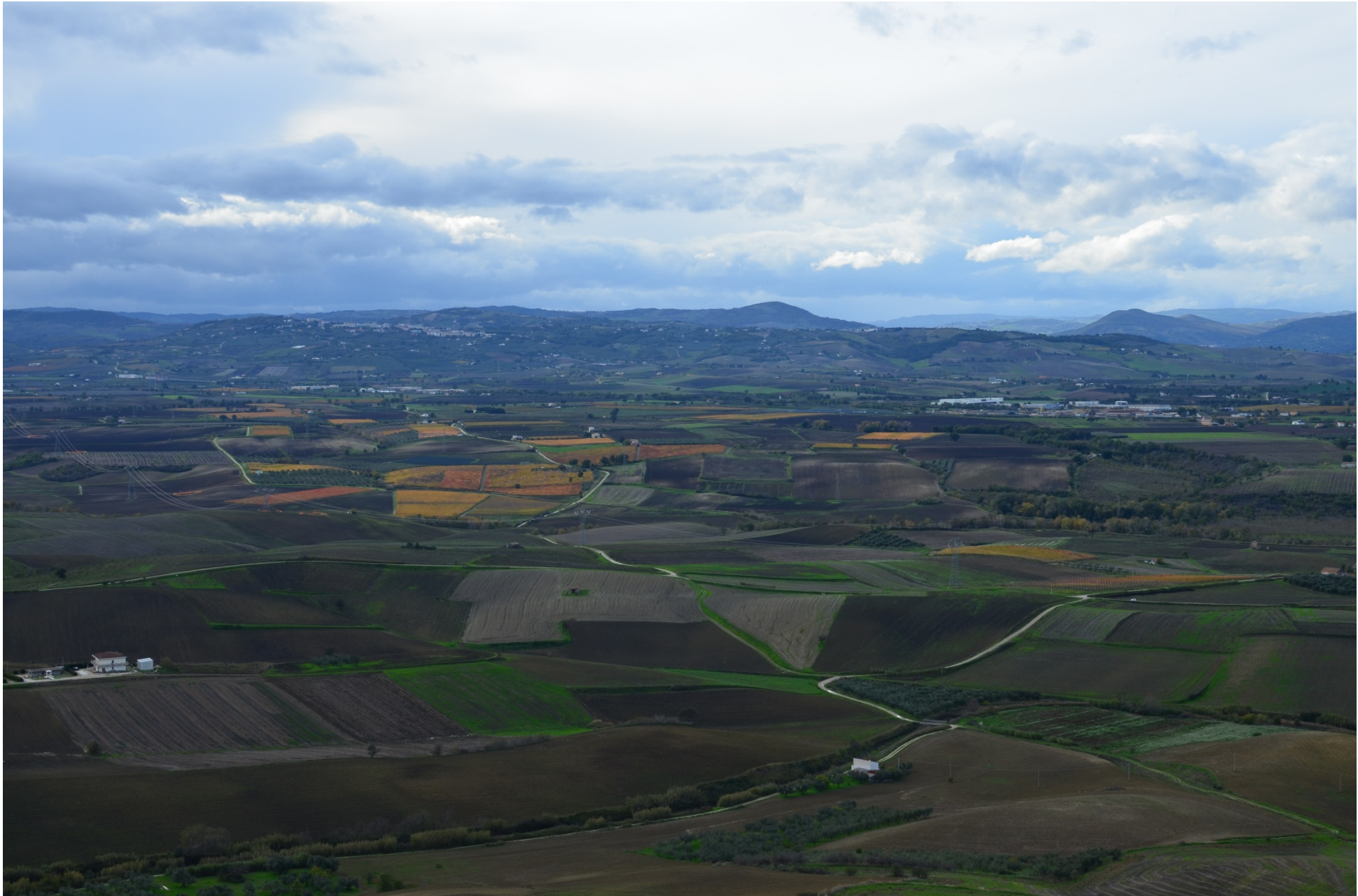
Foto 10a: Punto di ripresa fotografica (P3) 41.869084° 15.008437° (Belvedere Comune di San Martino in Pensilis) - vista panoramica area d'impianto – ANTE OPERAM