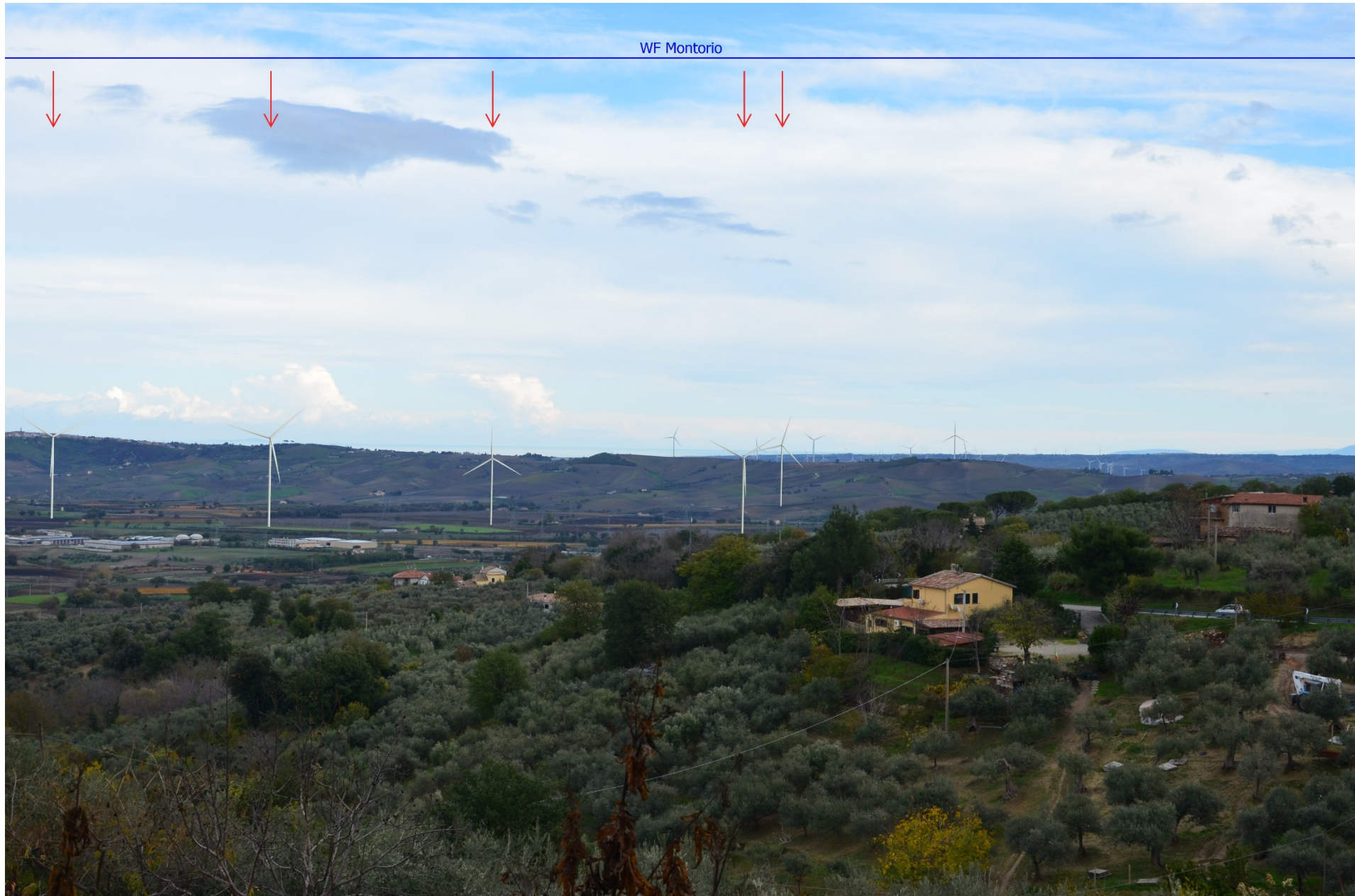
Foto 2b: Punto di ripresa fotografica (P1) 41.812156° 14.923839° (strada di accesso al Comune di Larino) - vista panoramica area d'impianto – POST OPERAM