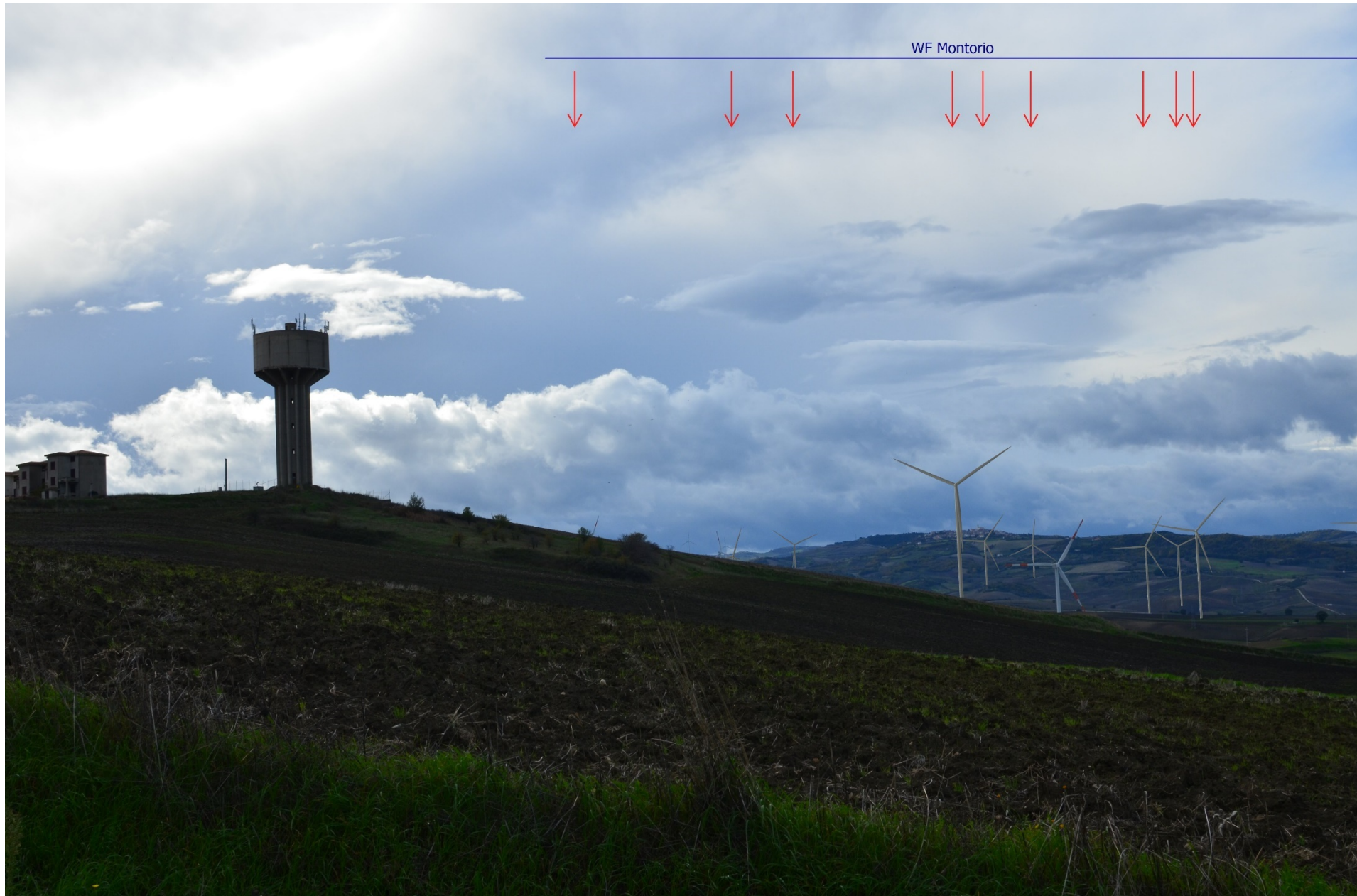
Foto 9b: Punto di ripresa fotografica (P2) 41.819645° 15.002383° (strada di accesso al Comune di Ururi) - vista panoramica area d'impianto – POST OPERAM