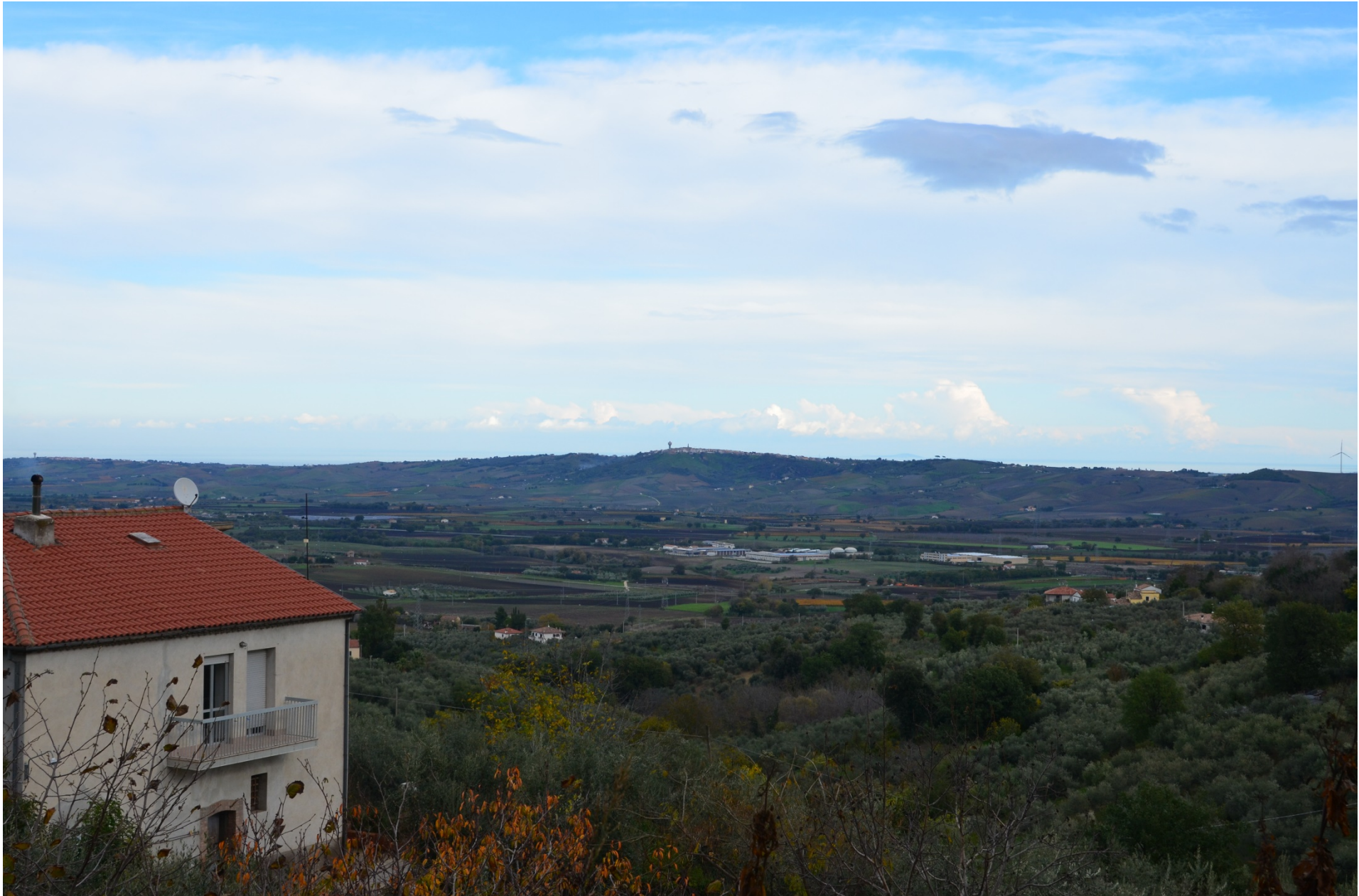
Foto 1a: Punto di ripresa fotografica (P1) 41.812156° 14.923839° (strada di accesso al Comune di Larino) - vista panoramica area d'impianto – ANTE OPERAM