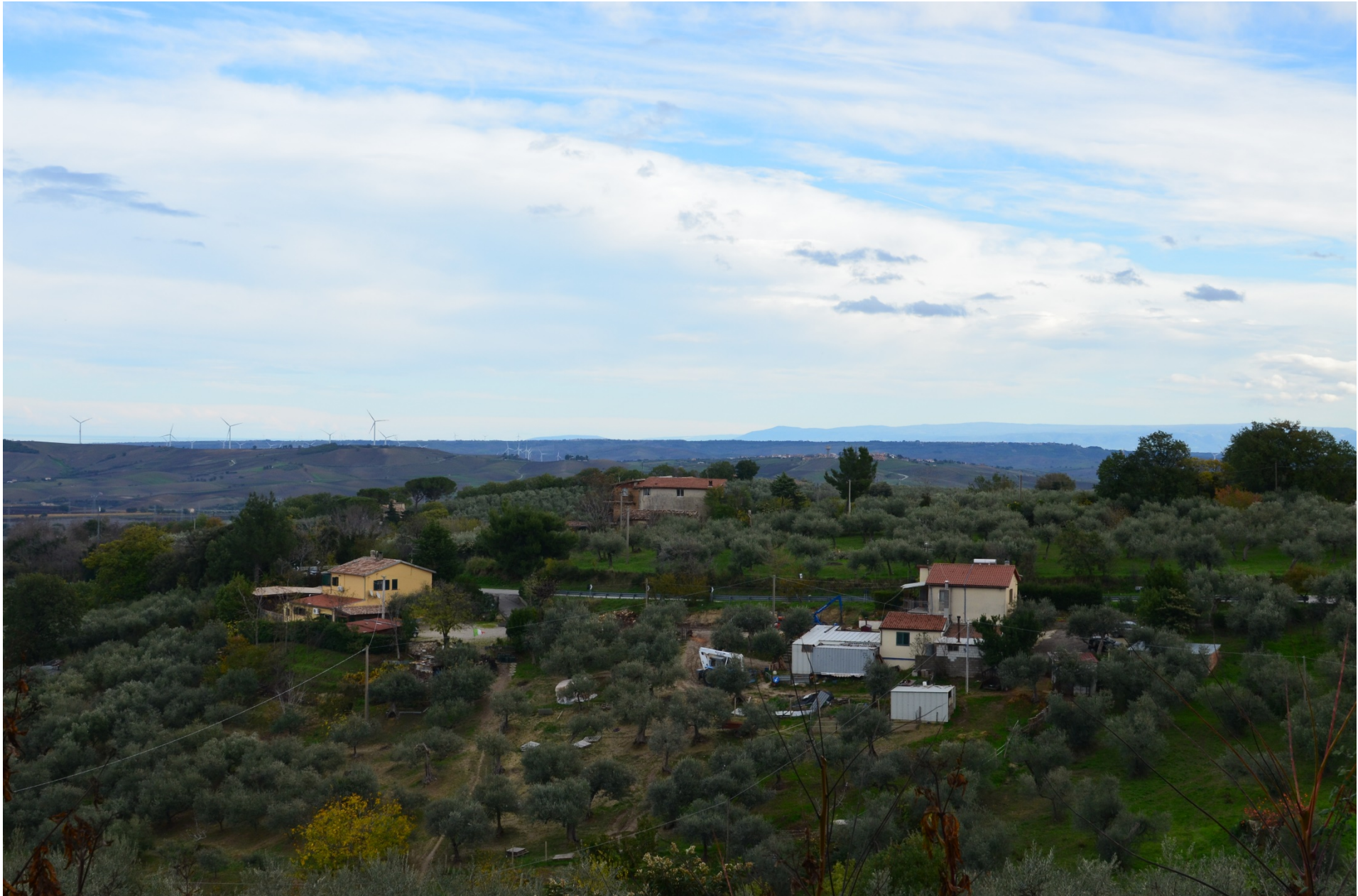
Foto 3a: Punto di ripresa fotografica (P1) 41.812156° 14.923839° (strada di accesso al Comune di Larino) - vista panoramica area d'impianto – ANTE OPERAM