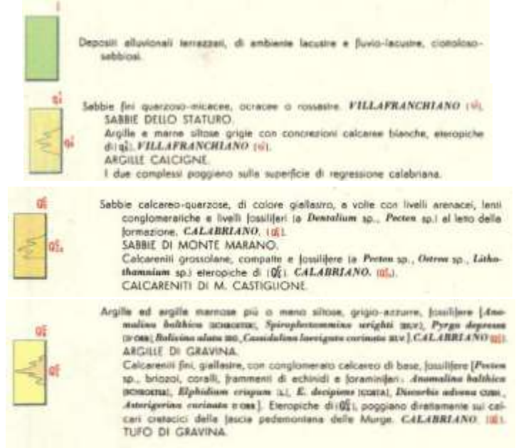
Stralcio F.º 189 "Altamura" della Carta Geologica d'Italia