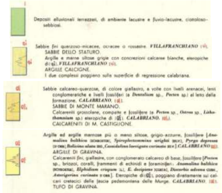
Stralcio F.º 189 "Altamura" della Carta Geologica