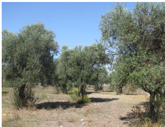
Figura 1. Oliveto tradizionale da rinfittire e valorizzare