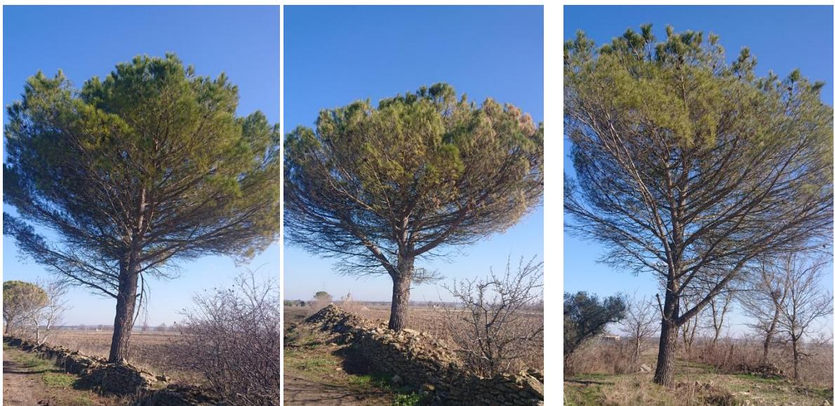
Figura 3. Esemplari di Pino italico non oggetto di intervento.

Nell'area agricola interessata dall'impianto e nel suo immediato intorno non sono presenti alberi monumentali. Da segnalare diversi esemplari di pino italico, i quali non saranno interessati dall'intervento e, quindi, saranno lasciati lungo la viabilità di servizio già presente (Fig. 3). Nell'area interessata dal progetto ricadono cinque parcelle arborate con olivi, vite e altri fruttiferi, alcuni consociati con seminativi. Nessun olivo presenta caratteristiche di monumentalità, secondo quanto previsto dalla L.R. n. 14/2007; la maggior parte degli alberi sono in stato di abbandono, degrado e grave improduttività (Fig. 4), non recuperabili con ordinarie tecniche colturali. Essi pertanto saranno estirpati e sostituiti con il mandorleto. L'oliveto posto nella zona di rispetto dal Regio Tratturo sarà, invece, recuperato come già previsto.