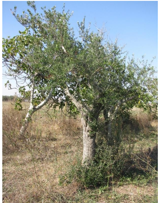
Figura 4. Olivi e Fruttiferi consociati, in condizioni di degrado e di grave improduttività.