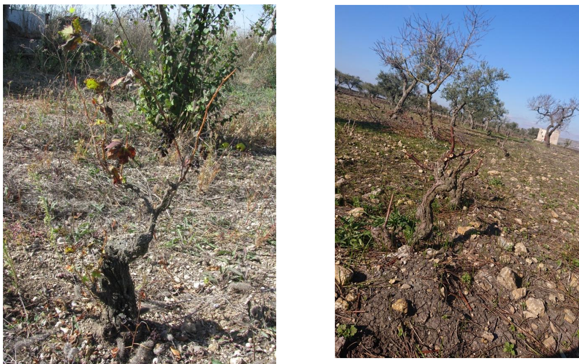
Figura 2. Vigneto tradizionale ad alberello da valorizzare.

Infine, nell'area a S-W cuscinetto tra le due aree di rispetto, di circa metri quadrati, sarà impiantato un oliveto con cultivar da mensa.