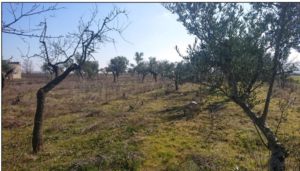
Olivi e Fruttiferi in condizioni di degrado e di grave improduttività

Nell'area interessata dal progetto ricadono cinque parcelle arborate con olivi, vite e altri fruttiferi, alcuni consociati con seminativi. Nessun olivo presenta caratteristiche di monumentalità, secondo quanto previsto dalla L.R. n. 14/2007; la maggior parte degli alberi sono in stato di abbandono, degrado e grave improduttività, non recuperabili con ordinarie tecniche colturali. Essi pertanto saranno estirpati e sostituiti con il mandorleto. L'oliveto posto nella zona di rispetto dal Regio Tratturo sarà, invece, recuperato come già previsto.