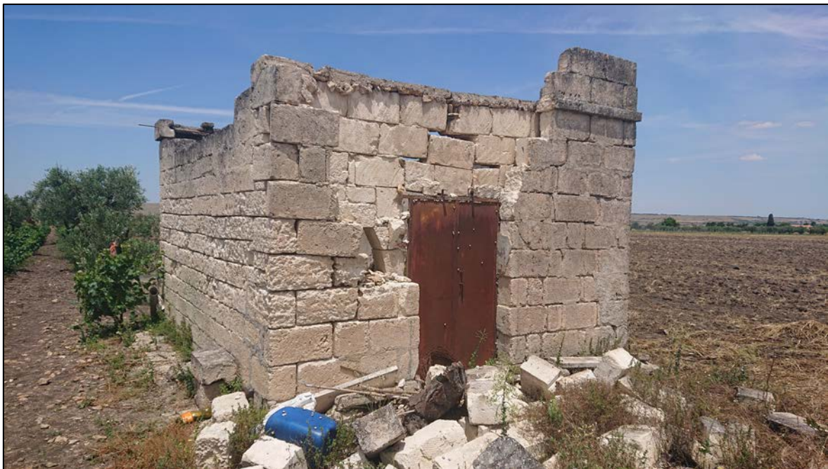
Casolare monocellulare in tufo parzialmente crollata