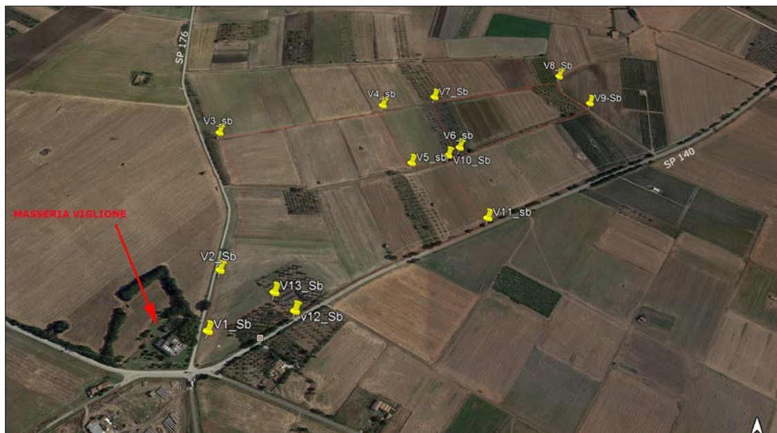
Ortofoto dell'area di intervento

La presente relazione descrive gli elementi del paesaggio agrario presenti nell'area di intervento e nel suo immediato intorno.