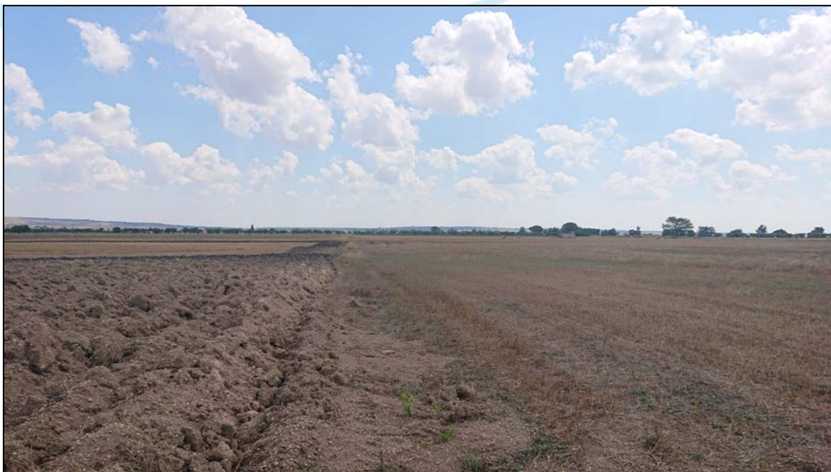
Immagine del lotto di intervento

Per quanto concerne il PPTR della Regione Puglia, il lotto confina a sud con la SP 140 che coincide con l'antico Regio Tratturello Santeramo-Laterza. Per tale motivo questo tratto di strada è ricompreso negli Ulteriori Contesti del PPTR come Testimonianze della Stratificazione Insediativa (art.143, comma 1, lett. e del Codice) nello specifico Aree appartenenti alla rete dei Tratturi . Parte del lotto, di conseguenza, rientra nell'Area di Rispetto del Tratturo (100 m). Queste aree rientrano, dunque, tra le Componenti culturali e insediative (art. 143, comma 1, lettera e, del Codice / art. 74 del PPTR).