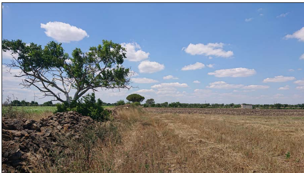
Muretto a secco lungo strada interpoderale

Come riportato sugli shapefile allegati, si rileva, in questa fascia di rispetto, la presenza di muretti a secco per lo più lungo alcune strade interpoderali.