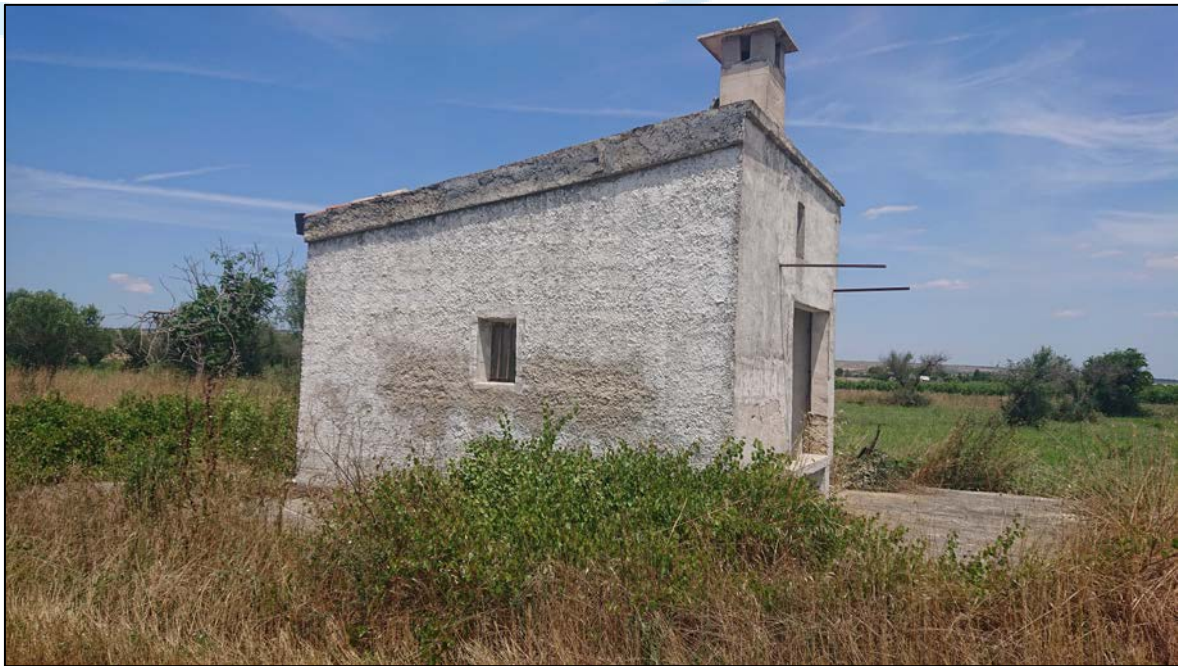
Casolare monocellulare in cemento per il ricovero degli attrezzi