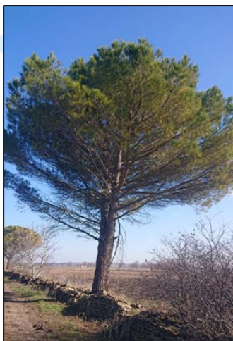
Pino italicus non oggetto di intervento

Nell'area interessata dal progetto ricadono cinque parcelle arborate con olivi, vite e altri fruttiferi, alcuni consociati con seminativi. Nessun olivo presenta caratteristiche di monumentalità, secondo quanto previsto dalla L.R. n. 14/2007; la maggior parte degli alberi sono in stato di abbandono, degrado e grave improduttività, non recuperabili con ordinarie tecniche colturali. Essi pertanto saranno estirpati e sostituiti con il mandorleto. L'oliveto posto nella zona di rispetto dal Regio Tratturo sarà, invece, recuperato come già previsto.