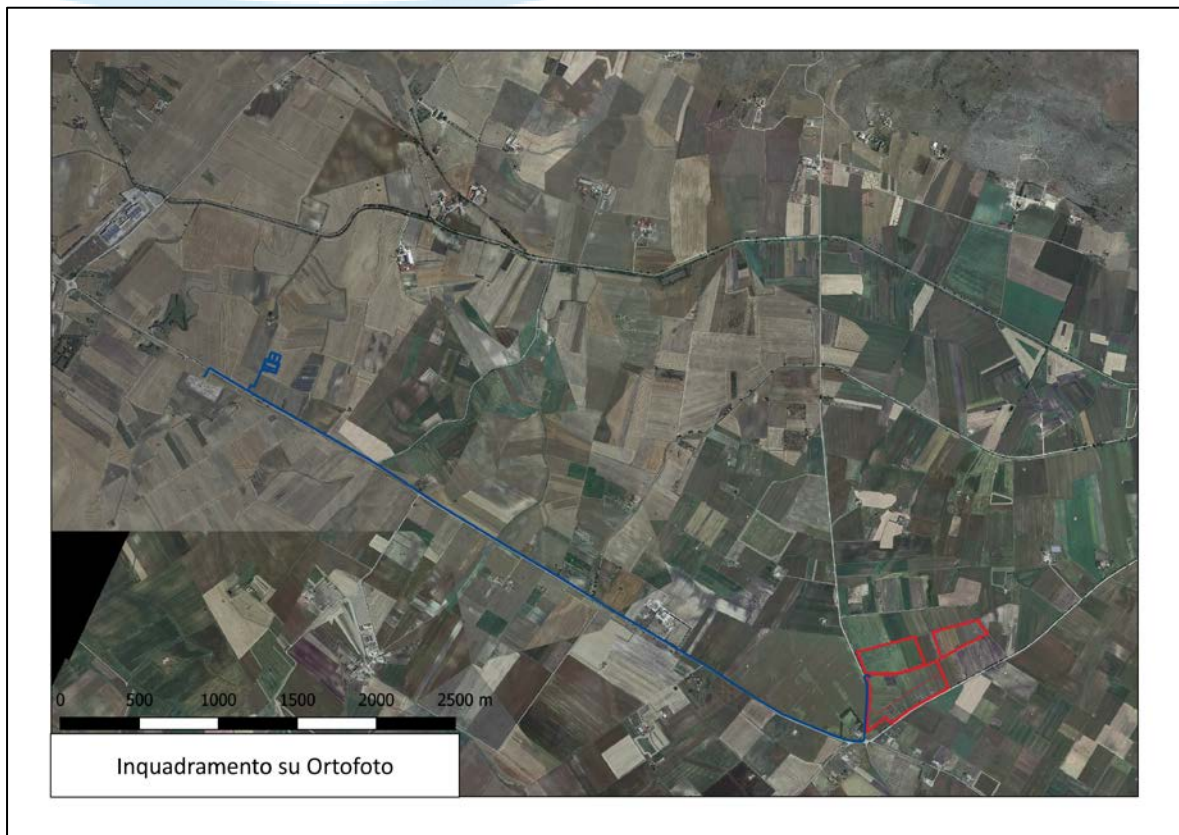
Ortofoto dell'area di intervento

L'area è inquadrata in zona E di PRG. La zona E è destinata, nelle previsioni di piano, alle attività primaria destinate in prevalenza all'agricoltura. Sono, altresì, ammesse attività industriali connesse con l'agricoltura.