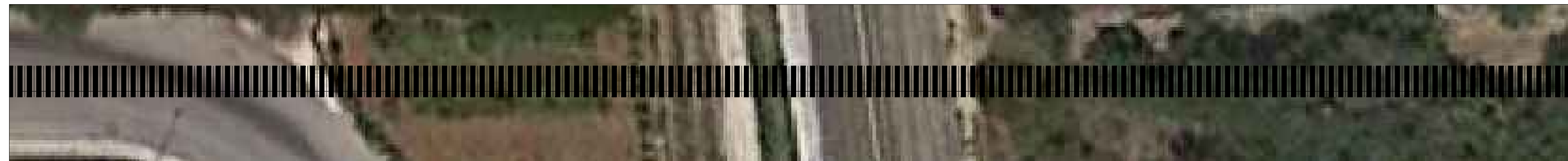
TRACCIA SU ORTOFOTO