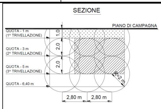
Figura 10-2 – Schema della bonifica profonda – in sezione