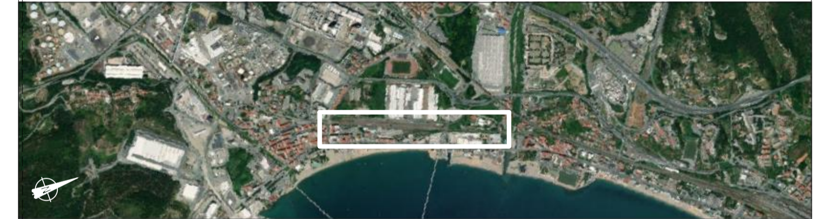
01 SEZIONE GEOLOGICA E GEOMORFOLOGICA scala 1:250/1:1000