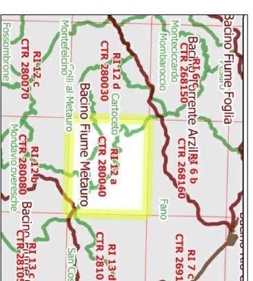
Tavola RI 12 a