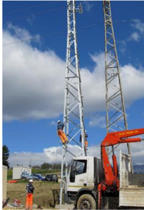
FIGURA 6 – FOTO DI ATTIVITA' DI MANUTENZIONE STRAORDINARIA SU IMPIANTI X-ELIO COSTRUITI IN ITALIA