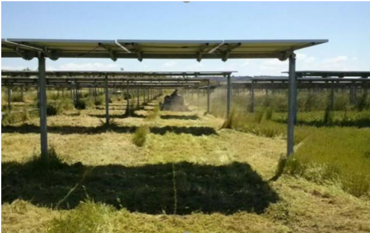
FIGURA 4 – FOTO DI ATTIVITA' MANUTENTIVE DEL VERDE SU IMPIANTI X-ELIO REALIZZATI IN ITALIA