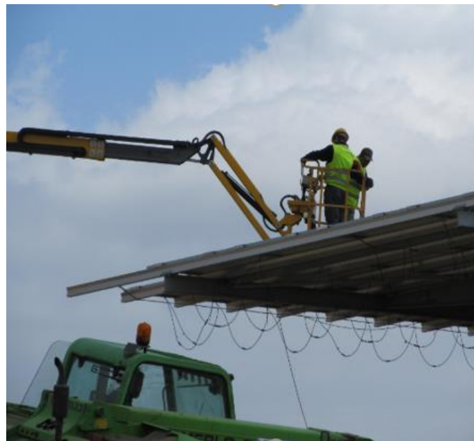
FIGURA 5 – FOTO DI ATTIVITA' MANUTENTIVE IMPIANTISTICHE SU IMPIANTI X-ELIO REALIZZATI IN ITALIA