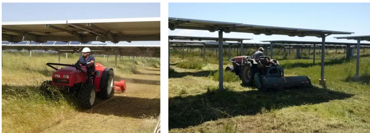
FIGURA 3 – ATTIVITA' AGRICOLE SU IMPIANTI REALIZZATI NEL 2011 (FOTO TRATTE DA UN REPORT DI MANUTENZIONE DEL 2014)*

Come si può apprezzare da queste foto di repertorio in cui vengono ritratti alcuni dipendenti della X-Elio durante attività manutentive di routine, già in tempi “non sospetti” la attività agricola non solo era presente, bensì rivestiva un ruolo importantissimo in termini di costo e di tempo nella attività manutentiva ordinaria degli impianti fotovoltaici. Infatti, la importante crescita della vegetazione sotto i pannelli e tra le fila, costringe a effettuare 3-4 tagli all’anno, allo scopo di evitare ombreggiamenti, e soprattutto incendi che frequentemente entrano nei terreni di impianto durante il periodo estivo. In questi casi l’erba sottostante veniva ceduta come foraggio alle aziende agricole nei dintorni. Con l’agrovoltaico, non si fa altro che incrementare tale attività in modo che possa generare ulteriore reddito per le aziende agricole locali e minori costi manutentivi per la X-Elio.