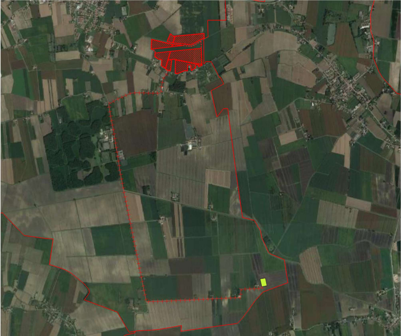
Figura 1 - inquadramento territoriale (scala 1:10.000)

In Figura 1 si riportano l'inquadramento territoriale dei lotti.